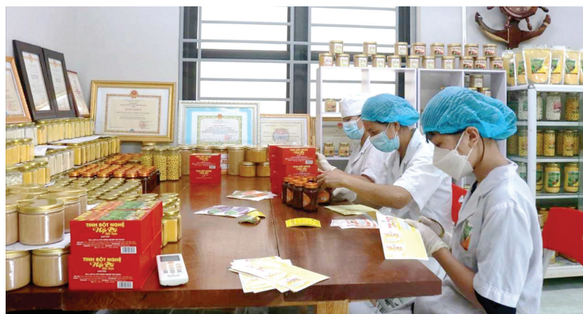
Năm 2024, tỉnh Bắc Kạn có 5 sản phẩm và bộ sản phẩm được trao chứng nhận sản phẩm CNNT tiêu biểu khu vực phía Bắc

NĂM 2024, TRONG TỔNG SỐ 126 SẢN PHẨM, BỘ SẢN PHẨM ĐƯỢC TRAO GIẤY CHỨNG NHẬN SẢN PHẨM CÔNG NGHIỆP NÔNG THÔN TIÊU BIỂU KHU VỰC PHÍA BẮC, TỈNH BẮC KẠN CÓ 5 SẢN PHẨM VÀ BỘ SẢN PHẨM.