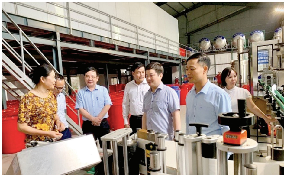
Đoàn công tác của Sở Công Thương Tuyên Quang khảo sát đối tượng thụ hưởng kinh phí khuyến công địa phương năm 2024 tại Hợp tác xã Nông sản hữu cơ Bình Minh

Từ những đề án cụ thể, thiết thực tại Tuyên Quang, có thể thấy rõ, khi được tiếp sức đúng lúc, đúng cách, các cơ sở nhỏ vẫn có thể làm nên điều lớn lao - không chỉ nâng tầm sản phẩm, mà còn góp phần gìn giữ môi trường và tạo dựng ngành công nghiệp nông thôn phát triển hài hòa, bền vững. ■