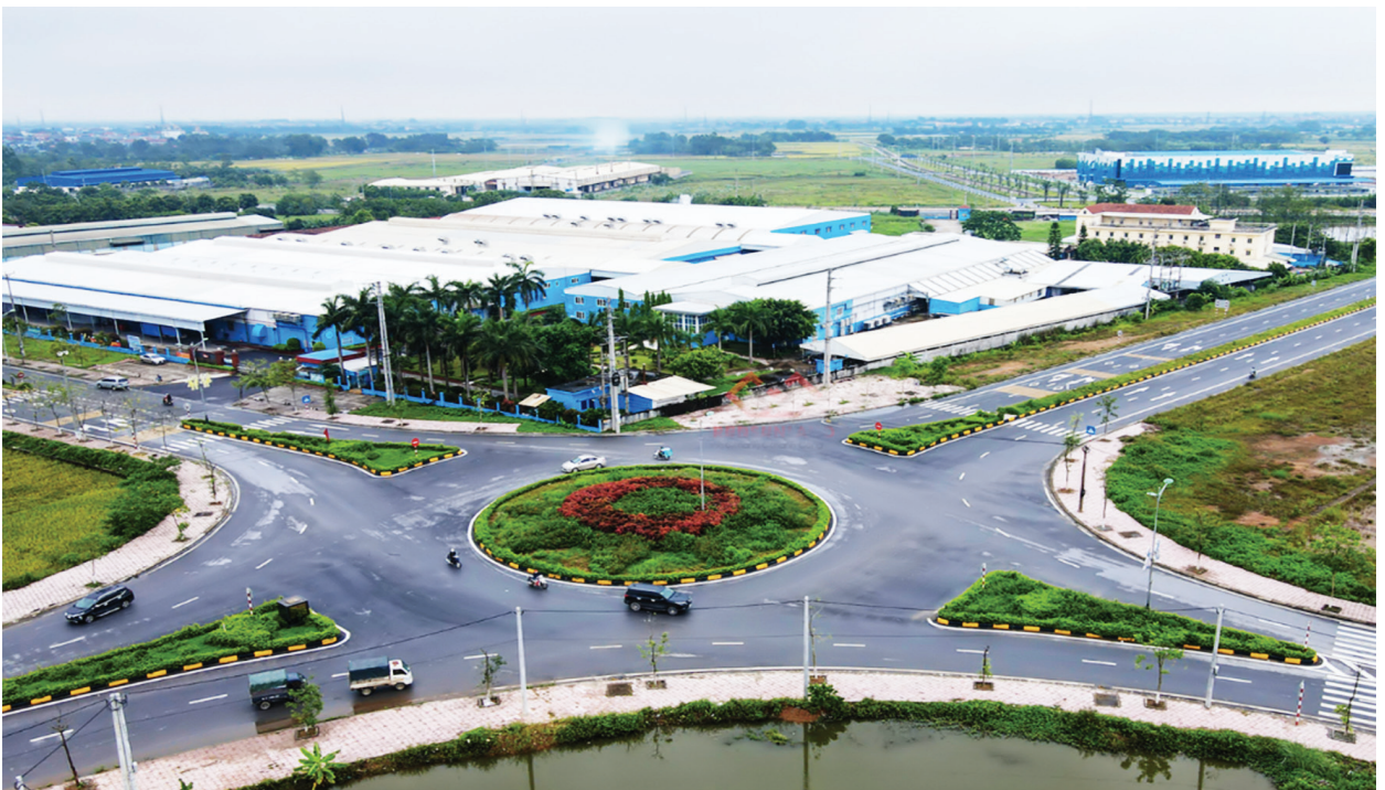
Cụm Công nghiệp Đồng Sóc Phú Thọ

Trong bối cảnh nền kinh tế toàn cầu chuyển mình mạnh mẽ sang mô hình phát triển xanh, bền vững, hoạt động khuyến công tại Việt Nam cũng đang chứng kiến sự thay đổi căn bản cả về định hướng, nội dung và phương thức triển khai. Trong đó tiếp tục huy động các nguồn lực hiệu quả, hỗ trợ sản xuất xanh.