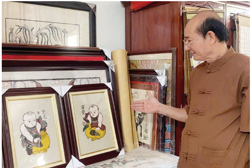
Bộ tranh Vinh hoa - Phú quý được công nhận sản phẩm công nghiệp nông thôn tiêu biểu cấp tỉnh Bắc Ninh năm 2024

Tính đến nay, tỉnh Bắc Ninh đã tổ chức 6 lần bình chọn, với 121 sản phẩm được chứng nhận là sản phẩm CNNT tiêu biểu cấp tỉnh. Đáng chú ý, nhiều sản phẩm thủ công mỹ nghệ, chế biến nông - lâm - thủy sản, thiết bị cơ khí đã vượt ra ngoài quy mô địa phương, được công nhận cấp khu vực và quốc gia. Gần 40 sản phẩm trong số này đã góp phần tạo dựng hình ảnh sản phẩm xanh, sạch và giàu bản sắc