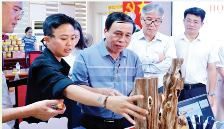
Lãnh đạo Sở Công Thương tỉnh Nghệ An và Lâm Đồng tham quan gian hàng trưng bày sản phẩm của hai tỉnh

Đặc biệt, hội nghị đã chứng kiến lễ ký kết biên bản ghi nhớ hợp tác giữa các doanh nghiệp tiêu biểu của hai tỉnh. Điển hình, Công ty Cổ phần Tập đoàn Dinh dưỡng Hadalifa (Nghệ An) và Công ty TNHH Nông sản Macca