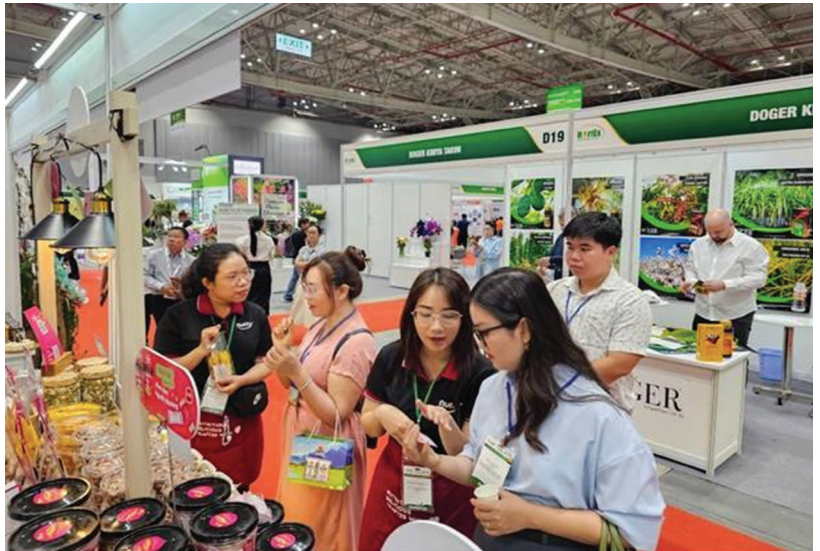
Gian hàng tỉnh Long An tại HortEx Vietnam 2025 - Triển lãm và Hội thảo quốc tế lần thứ 7 về công nghệ sản xuất và chế biến rau, hoa, quả tại Việt Nam (12-14/3/2025) thu hút sự quan tâm của người tiêu dùng

Công tác khuyến công đang âm thầm nhưng bền bỉ góp phần tạo nên những thay đổi tích cực trong sản xuất công nghiệp nông thôn của Long An. Không chỉ dừng lại ở hỗ trợ kỹ thuật hay quảng bá sản phẩm, khuyến công đang định hình một hướng đi mới khi hỗ trợ doanh nghiệp tiếp cận mô hình sản xuất xanh, bền vững và thích ứng với yêu cầu hội nhập quốc tế.