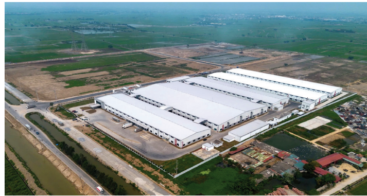
Cụm công nghiệp Đoàn Tùng 2 đã sẵn sàng thu hút đầu tư

Năm 2019, UBND tỉnh Hải Dương đã ban hành Quyết định số 3366/QĐ-UBND ngày 27/9/2019 về việc thành lập Cụm công nghiệp Đoàn Tùng 2 với diện tích khoảng 46,5 ha, thuộc xã Đoàn Tùng, huyện Thanh Miện, tỉnh Hải Dương. CCN Đoàn Tùng 2 do Công ty TNHH Hòa Quần làm chủ đầu tư hạ tầng kỹ thuật CCN.