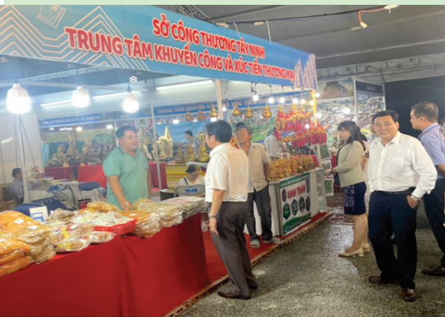
Gian hàng của Tây Ninh tại Hội chợ triển lãm hàng công nghiệp nông thôn tiêu biểu khu vực phía Nam năm 2024

Nhằm mục đích phục vụ cho các hoạt động quảng bá sản phẩm, hàng hóa, dịch vụ của địa phương cũng như phối hợp tổ chức các chương trình kết nối giao thương, mở rộng thị trường hỗ trợ kịp thời đến các doanh nghiệp trong tỉnh trong thời gian tới.