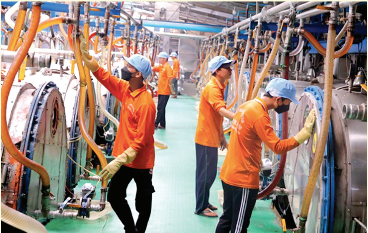
Dây chuyền sản xuất đường phèn tại Công ty TNHH Tân Dương Đồng Tháp (TP Hồng Ngự, tỉnh Đồng Tháp)

Ngoài ra, tỉnh cũng xác định cần đổi mới cách thức triển khai khuyến công để không chỉ hỗ trợ về tài chính mà còn đóng vai trò tư vấn chiến lược phát triển, từ đó giúp cơ sở sản xuất "lớn lên" đúng hướng, bền vững. ■