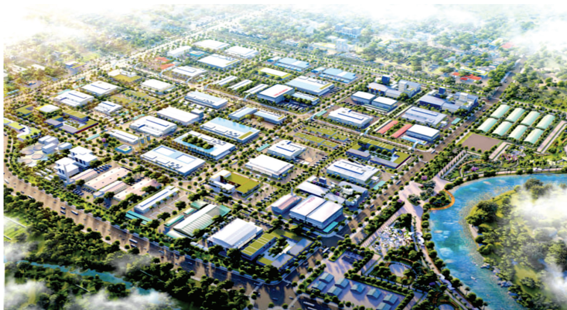
Cụm công nghiệp Quang Trung tỉnh Đồng Nai được thiết kế xây dựng theo hướng CCN xanh

Trong bối cảnh Việt Nam đang đẩy mạnh mục tiêu phát triển bền vững, chuyển đổi sang mô hình kinh tế xanh và thực hiện các cam kết khí hậu quốc tế, việc xây dựng và nhân rộng các CCN xanh là yêu cầu tất yếu. Mô hình này không chỉ giải quyết bài toán ô nhiễm môi trường từ gốc rễ, mà còn mở ra cơ hội thu hút đầu tư chất lượng cao, nâng tầm giá trị công nghiệp nông thôn và tạo sinh kế bền vững cho hàng triệu lao động nông thôn. Đây cũng là hướng đi để công nghiệp nông thôn Việt Nam không bị tụt lại phía sau trên hành trình chuyển đổi xanh toàn cầu. ■