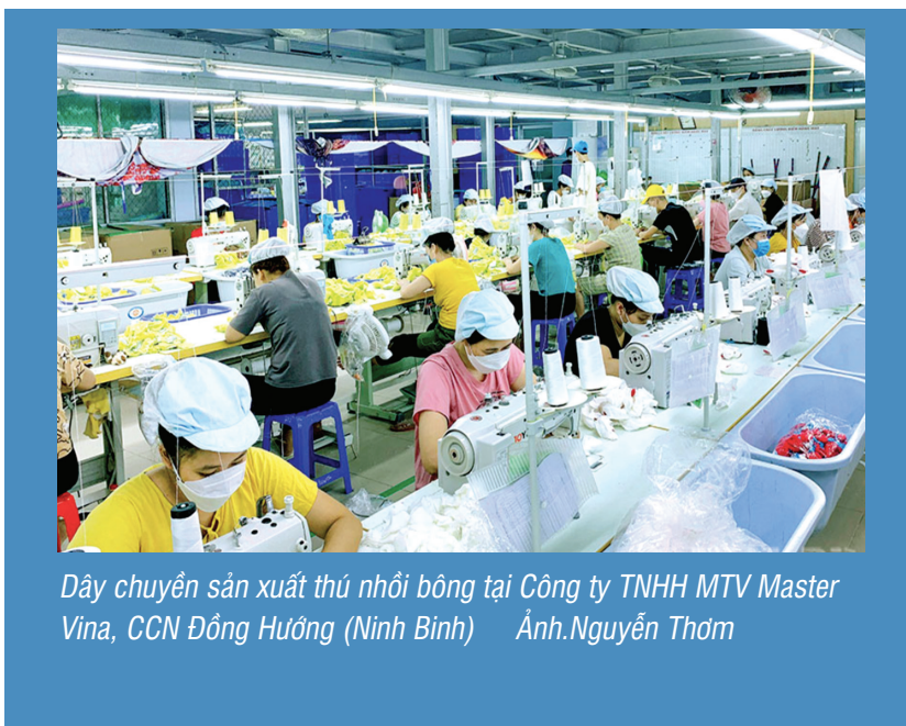
Dây chuyền sản xuất thú nhồi bông tại Công ty TNHH MTV Master Vina, CCN Đông Hương (Ninh Bình)

Đơn cử như làng nghề tái chế nhựa ở Văn Lâm (Hưng Yên), làng nghề cơ khí Phùng Xá (Hà Nội), hoặc nhuộm vải ở Ninh Bình, đều tồn tại tình trạng nước thải đổ thẳng ra môi trường, khí thải độc