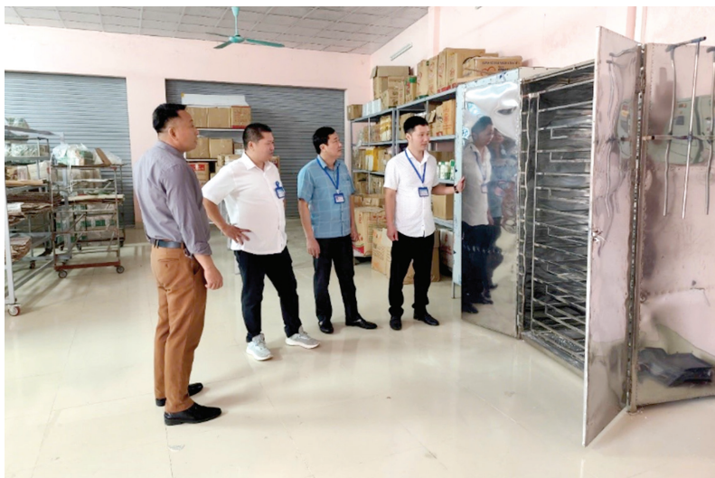
Nghiệm thu đề án khuyến công địa phương năm 2024, “Hỗ trợ ứng dụng máy móc thiết bị tiên tiến vào sản xuất gia công cơ khí” tại Công ty TNHH quảng cáo nội thất Tự Lực (thành phố Hòa Bình)

Được biết, từ đầu năm 2025 đến nay, thực hiện chương trình công tác, Trung tâm đã phối hợp với các đơn vị liên quan tiến hành khảo sát, đánh giá nhu cầu và năng lực thực tế tại 26 cơ sở công nghiệp nông thôn trên địa bàn 8 huyện, thành phố. Trên cơ sở kết quả khảo sát, Trung tâm sẽ tổng hợp và xây dựng kế hoạch, đề án khuyến công năm 2025, đảm bảo đúng quy định, sát thực tế, ưu tiên lựa chọn các cơ sở, ngành nghề có thế mạnh, sức lan tỏa và hỗ trợ kịp thời đến các cơ sở sản xuất công nghiệp nông thôn. ■