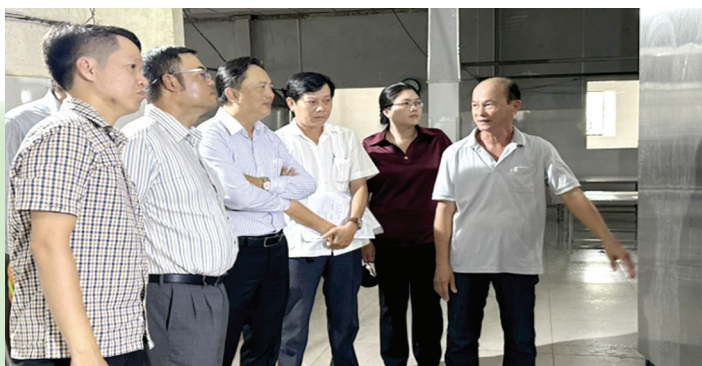
Sở Công Thương Sóc Trăng nghiệm thu Đề án khuyến công địa phương năm 2024 “Hỗ trợ ứng dụng máy móc thiết bị tiên tiến trong sản xuất lập xưởng” tại thị trấn Mỹ Xuyên, huyện Mỹ Xuyên.

Còn với doanh nghiệp tham gia có cơ hội quảng bá hàng hóa, thương hiệu và xúc tiến kết nối hình thành mạng lưới phân phối xuống cấp huyện để tiếp cận trực tiếp với người tiêu dùng... Qua các lần tổ chức cho thấy số lượng lẫn chất lượng hàng hóa, sản phẩm góp mặt tại phiên chợ cũng ngày càng được nâng lên, trong khi lượng khách đến tham quan mua sắm và doanh số bán hàng hàng năm đều tăng.