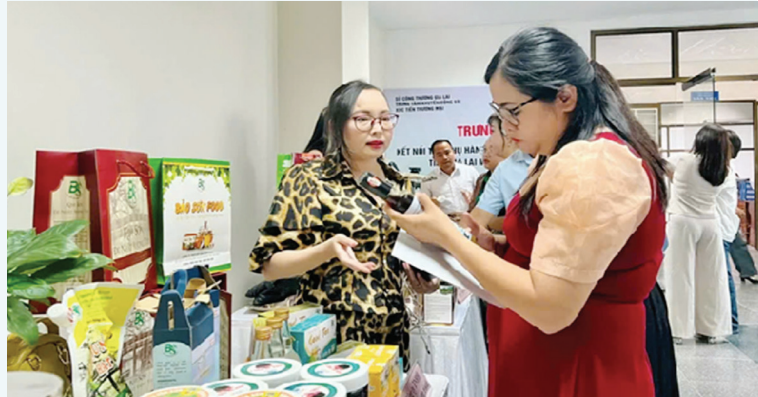
Doanh nghiệp Gia Lai và Ninh Bình giới thiệu sản phẩm