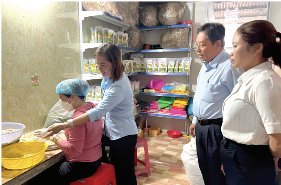
Hợp tác xã Dịch vụ nông nghiệp sen Hải Nhơn được hỗ trợ kinh phí khuyến công địa phương năm 2024 cho ứng dụng máy móc thiết bị tiên tiến vào sản xuất

Giám đốc Sở Công Thương Long An, cho biết trong bối cảnh nền kinh tế đang chuyển mình theo hướng xanh, số hóa và bền vững, ngành Công Thương Long An đã xác định rõ các trụ cột phát triển chiến lược để đưa công nghiệp của tỉnh bước vào giai đoạn mới - hiện đại, hiệu quả và hội nhập sâu.