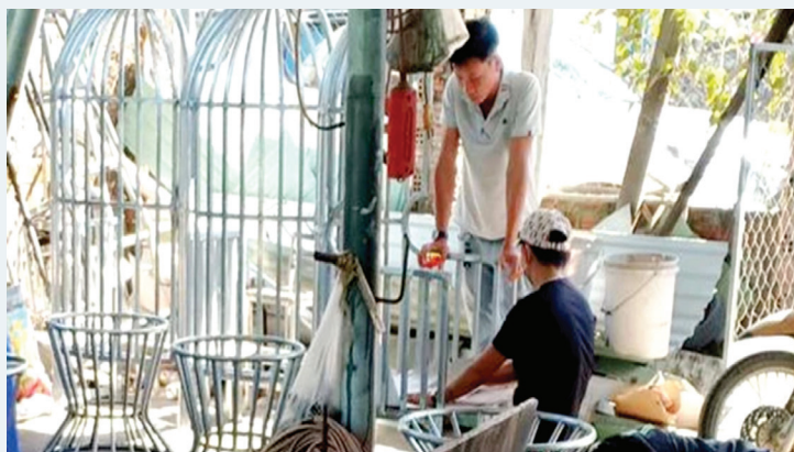
CCN Hoà Nhơn (TP Đà Nẵng) sẽ dành cho các ngành nghề cơ khí, điện tử, dệt may...

hiện đầy đủ các nghĩa vụ tài chính. Đồng thời, thực hiện đúng nội dung cam kết của chủ đầu tư tại hồ sơ đề nghị thành lập CCN Hòa Nhơn.