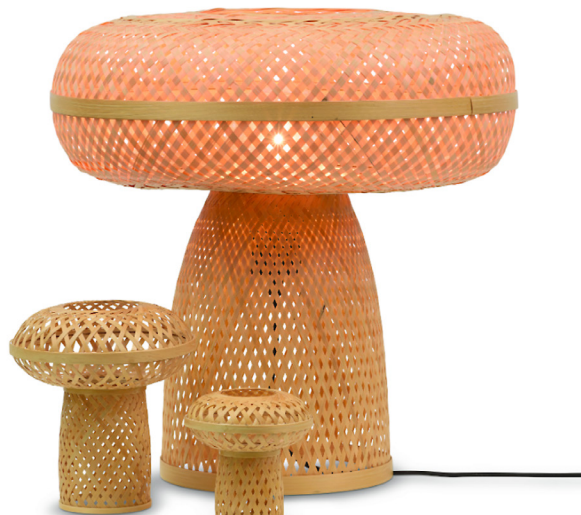
Bộ sản phẩm mây tre đan “Nấm mẹ và nấm con” của Công ty TNHH Đức Phong (Nghệ An) được bình chọn sản phẩm CNNT tiêu biểu cấp quốc gia năm 2023

VỚI NHỮNG SẢN PHẨM ĐƯỢC BÌNH CHỌN SẢN PHẨM CNNT TIÊU BIỂU CẤP QUỐC GIA BÊN CẠNH NHỮNG PHẦN THƯỞNG KHUYẾN KHÍCH VÀ GIẤY CHỨNG NHẬN SẼ ĐƯỢC ƯU TIÊN HỖ TRỢ TỪ NGUỒN KINH PHÍ KHUYẾN CÔNG CHO TRIỂN KHAI CÁC HOẠT ĐỘNG PHÁT TRIỂN SẢN XUẤT, QUẢNG BÁ SẢN PHẨM VÀ KẾT NỐI THỊ TRƯỜNG TIÊU THỤ.