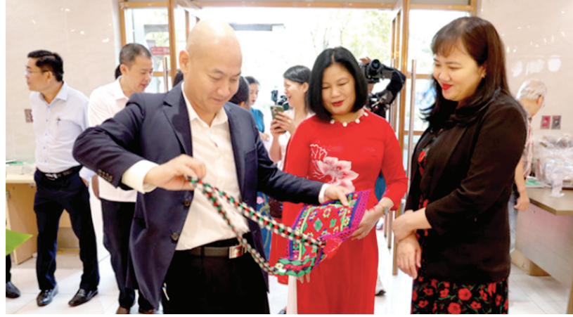
Sản phẩm công nghiệp nông thôn của Cao Bằng thu hút người tiêu dùng Ảnh minh họa