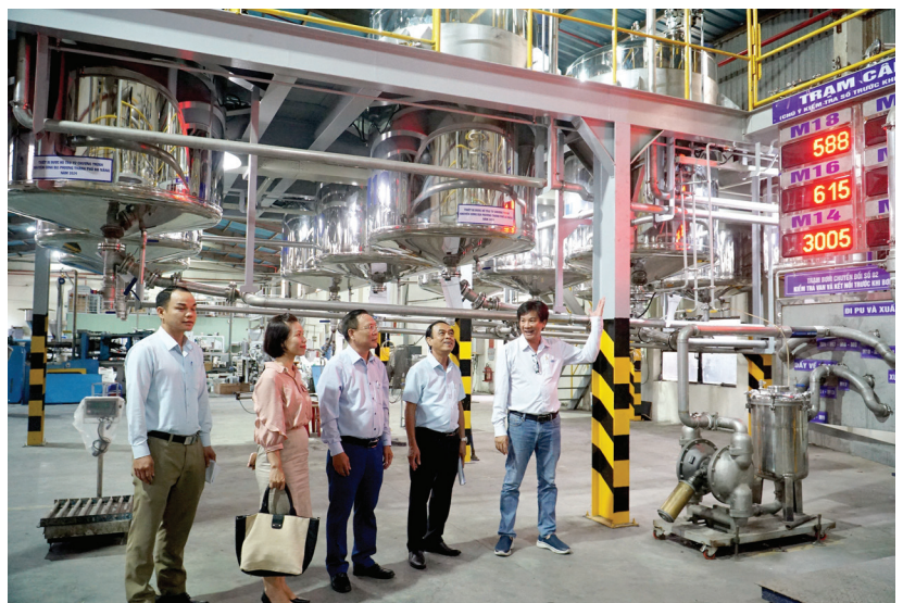
Chương trình khuyến công Đà Nẵng hỗ trợ cơ sở sản xuất công nghiệp thí điểm áp dụng mô hình sản xuất sạch hơn năm 2024