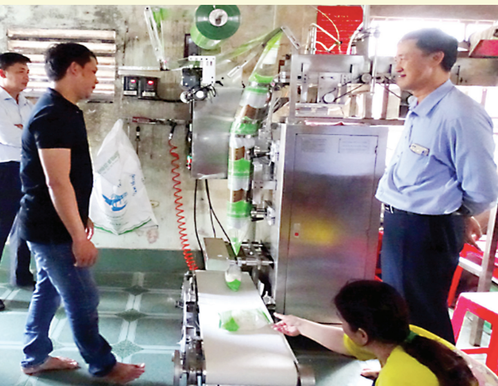
Thiết bị máy móc được hỗ trợ tại Hộ kinh doanh Duy Kha (Đồng Tháp) từ nguồn khuyến công địa phương năm 2024

Trong giai đoạn 2021- 2025, Chương trình khuyến công quốc gia theo Quyết định số 1881/QĐ-TTg ngày 20/11/2020 của Thủ tướng Chính phủ đã và đang phát huy vai trò là “bà đỡ” vững chắc cho phát triển công nghiệp ở Đồng Tháp. Với cách tiếp cận thiết thực, linh hoạt, chú trọng yếu tố con người và công nghệ, hoạt động khuyến công đã thổi luồng sinh khí mới vào các cơ sở công nghiệp nông thôn, mở ra hướng đi bài bản, hiệu quả và bền vững cho khu vực vốn trước đây còn manh mún và thiếu đầu tư.