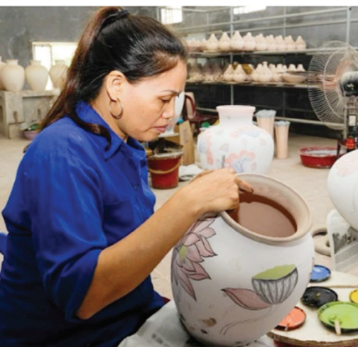
Vẽ hoa văn lên các sản phẩm tại làng gốm Bát Tràng, Hà Nội

Chính vì vậy, cần có chính sách linh hoạt và quyết đoán hơn. Có thể áp dụng cơ chế “khoán sạch”, tức là Nhà nước đầu tư hạ tầng xử lý nước thải, rác thải, còn các hộ đóng phí sử dụng hợp lý. Đồng thời, cần đẩy mạnh xã hội hóa, thu hút doanh nghiệp tham gia đầu tư công nghệ xử lý môi trường như mô hình hợp tác công tư. Ngoài ra, phân loại làng nghề theo mức độ ô nhiễm và đặc thù sản xuất để có giải pháp phù hợp, tránh dàn trải, thiếu hiệu quả. ■