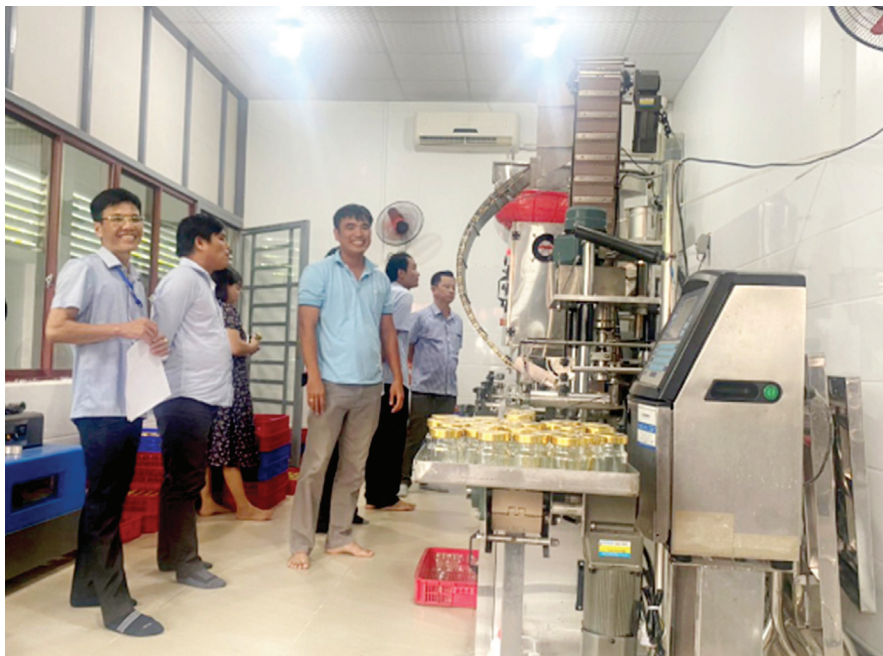
Thiết bị được khuyến công địa phương hỗ trợ năm 2023 tại Công ty TNHH một thành viên yến sào Nam Phú, tỉnh Bình Phước

Trong dòng chảy phát triển kinh tế - xã hội của Bình Phước, công tác khuyến công không đơn thuần là chính sách hỗ trợ, mà đang từng bước trở thành trụ cột cho công nghiệp nông thôn phát triển bền vững. Với những thành tựu đã đạt được trong năm 2024 và kế hoạch hành động rõ ràng cho năm 2025, tin rằng khuyến công Bình Phước sẽ tiếp tục là "ngọn gió lành" thổi bùng sức sống cho cộng đồng doanh nghiệp nông thôn, mở ra những chặng đường mới cho một nền công nghiệp mang đậm bản sắc địa phương nhưng không ngừng hội nhập, vươn xa. ■