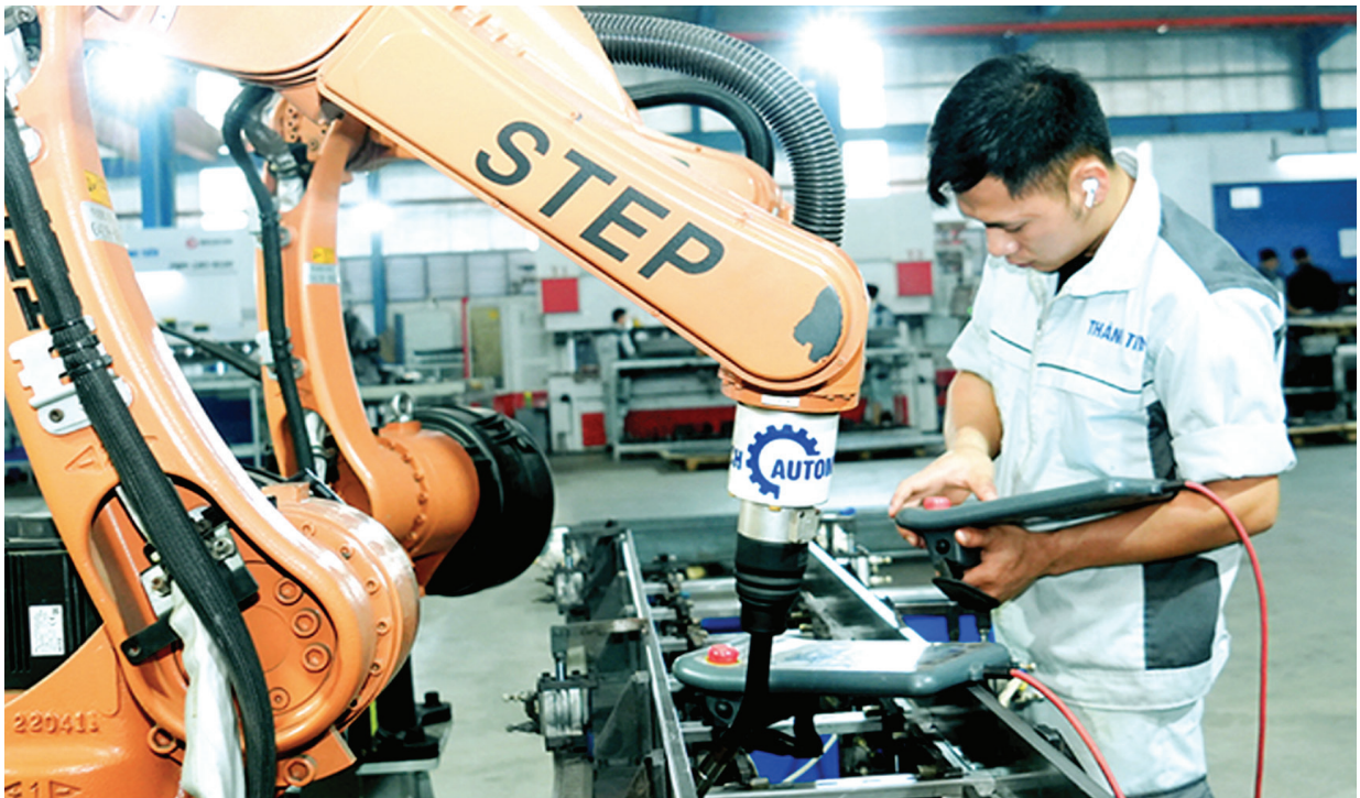
Công ty TNHH Sản xuất thương mại Thành Tiến - chi nhánh Vinh Phúc, Cụm công nghiệp Đồng Sóc

hiều thách thức lớn về môi trường. Sản xuất nhỏ lẻ, phân tán, sử dụng công nghệ lạc hậu, thiếu hệ thống xử lý chất thải và nhận thức còn hạn chế khiến không ít làng nghề, cơ sở sản xuất nông thôn trở thành điểm nóng về ô nhiễm môi trường.