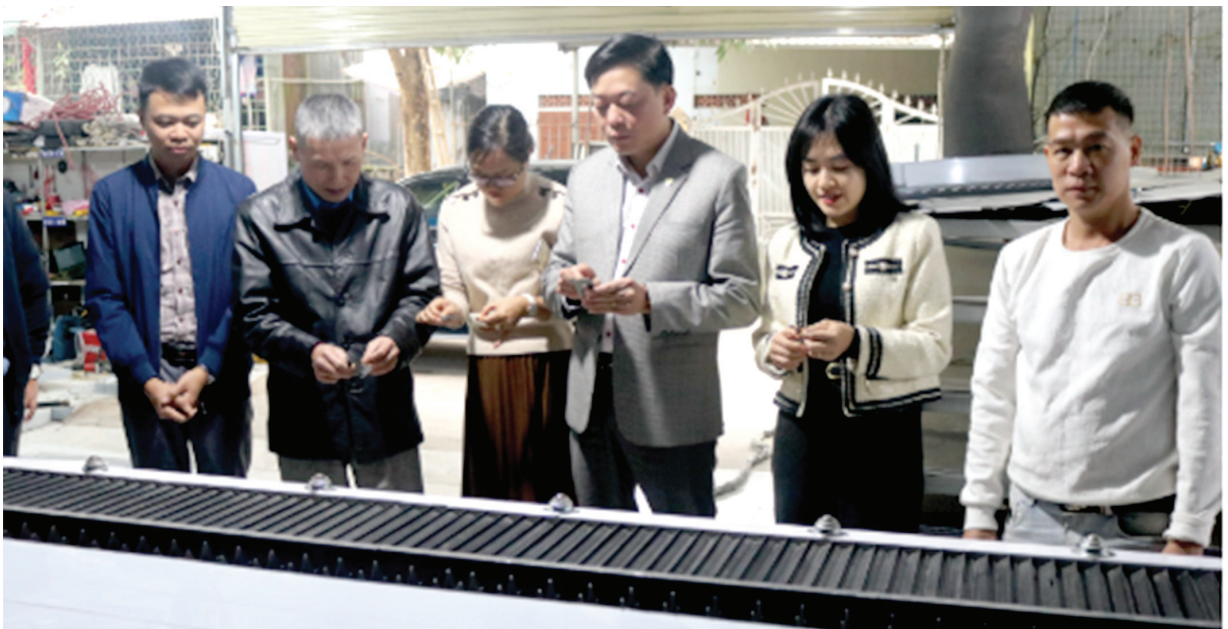
Đoàn công tác của Trung tâm Khuyến công và Tư vấn phát triển công nghiệp Hoà Bình khảo sát tại HTX liên kết dịch vụ nông nghiệp và chế biến tinh bột Nhuận Trạch (tỉnh Hòa Bình), năm 2025.

Với những kết quả cụ thể, thiết thực, Trung tâm Khuyến công và Tư vấn phát triển công nghiệp Hòa Bình (Trung tâm) tiếp tục khẳng định vai trò “bà đỡ” cho doanh nghiệp công nghiệp nông thôn vươn lên mạnh mẽ, theo hướng hiện đại, tiết kiệm năng lượng và thân thiện với môi trường.