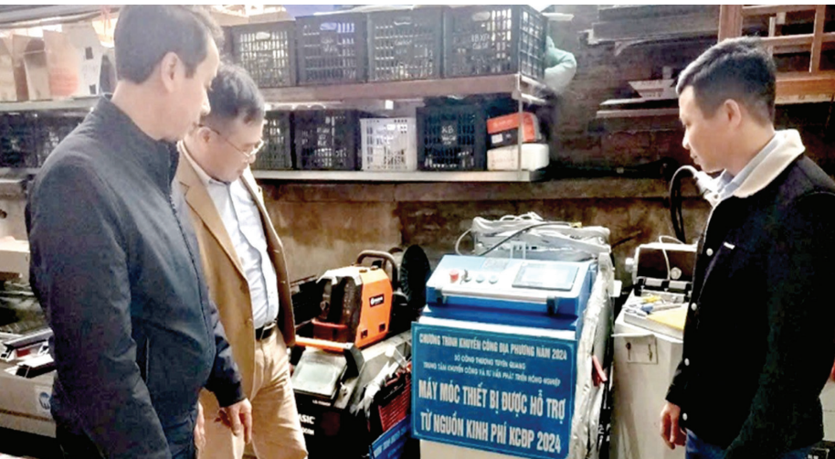
Công ty TNHH Quảng Lâm (Tuyên Quang) được hỗ trợ kinh phí địa phương năm 2024 cho ứng dụng thiết bị tiên tiến vào sản xuất

Dưới sự đồng hành và hỗ trợ của nguồn vốn khuyến công, ngày càng nhiều doanh nghiệp, hợp tác xã, hộ sản xuất công nghiệp nông thôn trên địa bàn tỉnh Tuyên Quang chủ động đầu tư đổi mới công nghệ, áp dụng các thiết bị tiên tiến, hướng tới mô hình sản xuất xanh, bền vững.