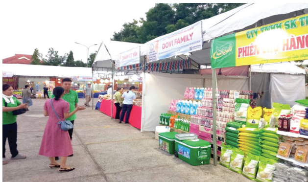
Nhiều sản phẩm công nghiệp nông thôn được giới thiệu tại Phiên chợ hàng Việt về miền núi tại huyện Hàm Thuận Bắc năm 2025 diễn ra từ ngày từ 30/5 - 1/6/2025

Sở Công Thương Bình Thuận mới phối hợp tổ chức Phiên chợ hàng Việt về miền núi tại huyện Hàm Thuận Bắc năm 2025 nhằm triển khai thực hiện cuộc vận động “Người Việt Nam ưu tiên dùng hàng Việt Nam” trên địa bàn tỉnh.