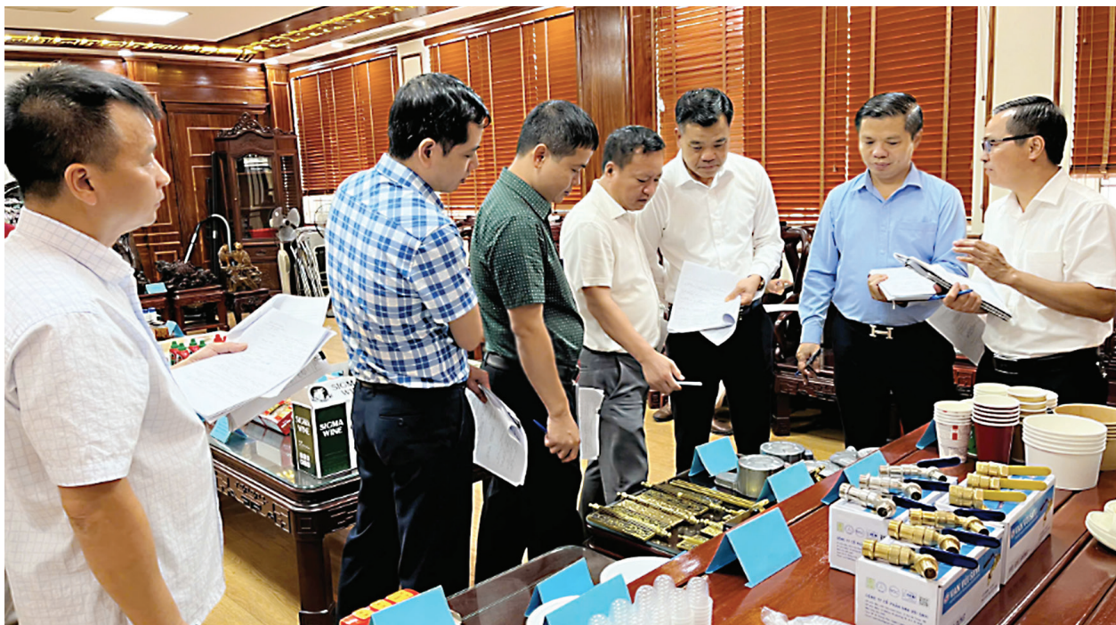
Ban giám khảo điểm cho sản phẩm công nghiệp nông thôn tiêu biểu tỉnh Bắc Ninh năm 2024

Trong chiến lược phát triển công nghiệp của Bắc Ninh giai đoạn 2021-2030, yếu tố “sản xuất xanh”, “phát triển tuần hoàn” được đặt ra như một định hướng chủ đạo. Điều này đã và sẽ được ngành Công Thương hướng tới phát triển công nghiệp nông thôn nói chung, sản phẩm CNNT tiêu biểu nói riêng. Để một sản phẩm không chỉ có mẫu mã đẹp, chất lượng tốt mà còn thân thiện môi trường, đảm bảo an toàn cho người sử dụng. ■