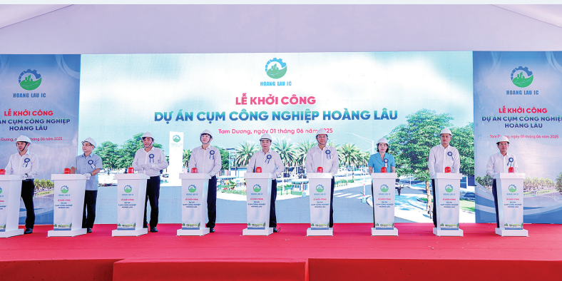
Lễ khởi công dự án Cụm công nghiệp Hoàng Lâu (tỉnh Vĩnh Phúc)

Sáng 1/6, Công ty TNHH Phát triển Cụm công nghiệp Hoàng Lâu tổ chức Lễ khởi công dự án Cụm công nghiệp (CCN) Hoàng Lâu. Đây là dự án hạ tầng công nghiệp trọng điểm trong quy hoạch phát triển công nghiệp của tỉnh đến năm 2050. Dự án có tổng diện tích 50 ha tại xã Hoàng Lâu (Tam Dương), do Công ty TNHH Phát triển CCN Hoàng Lâu