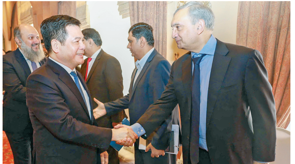
Bộ trưởng Nguyễn Hồng Diễm gặp gỡ các doanh nghiệp Pakistan