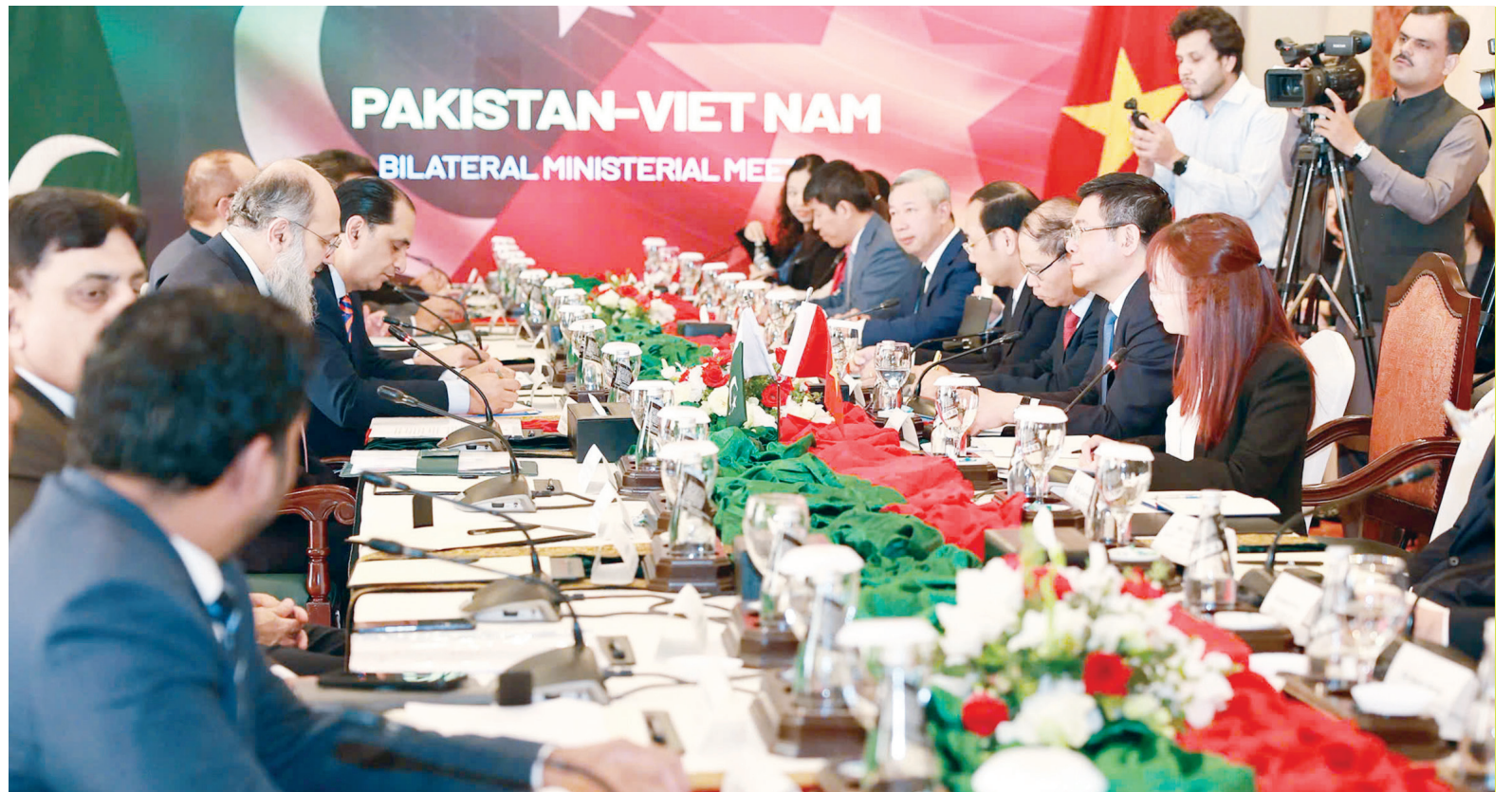
Bộ trưởng Bộ Công Thương Việt Nam Nguyễn Hồng Diên hội đàm với Bộ trưởng Bộ Thương mại Pakistan Jam Kamal Khan

Bộ trưởng Nguyễn Hồng Diên cũng thẳng thắn chỉ rõ, doanh nghiệp hai nước hiện vẫn gặp nhiều khó khăn liên quan đến các quy định về kiểm dịch, tiêu chuẩn