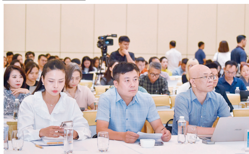
Đại diện các ban, bộ, ngành và cơ quan báo chí dự họp báo

Với chủ đề “Kết nối con người với sản xuất – kinh doanh”, Hội chợ Mùa Thu 2025 có quy mô hơn 130.000 m 2 , với gần 3.000 gian hàng của 2.500 doanh nghiệp trong và ngoài nước, dự kiến thu hút nửa triệu lượt khách mỗi ngày.