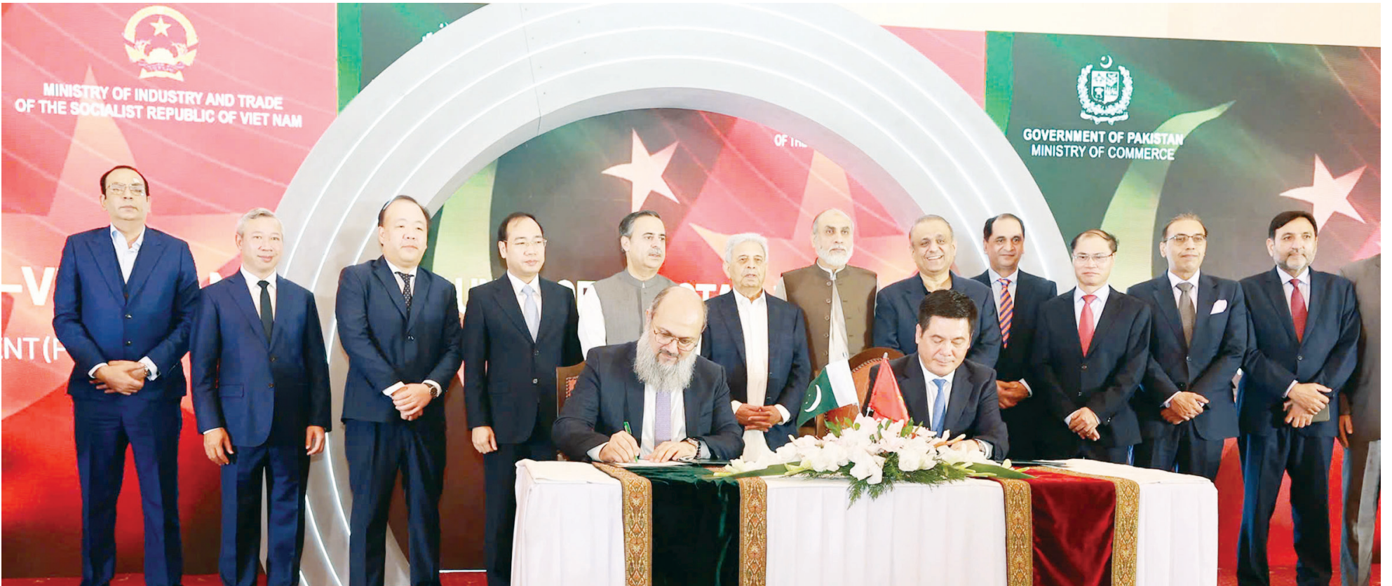
Bộ trưởng Nguyễn Hồng Diên và Ngài Jam Kamal Khan, Bộ trưởng Bộ Thương mại Pakistan ký Tuyên bố chung khởi động đàm phán Thỏa thuận thương mại ưu đãi (PTA) Việt Nam - Pakistan