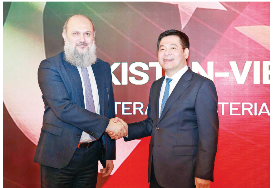
Bộ trưởng Bộ Công Thương Việt Nam Nguyễn Hồng Diễm và Bộ trưởng Bộ Thương mại Pakistan Jam Kamal Khan