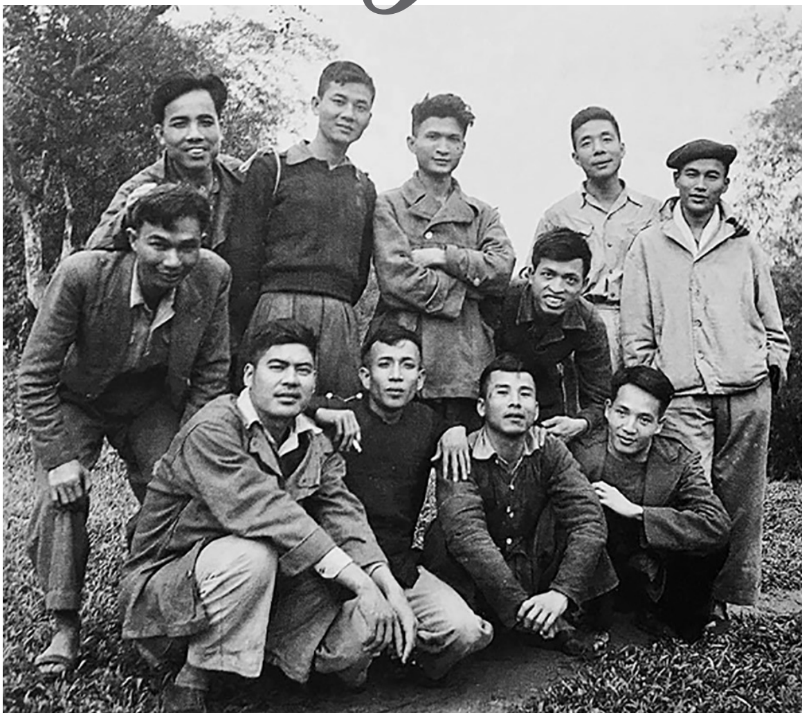
Nhà thơ Chế Lan Viên (thứ 4 từ trái sang, hàng sau) với các văn nghệ sĩ trong thời kỳ kháng chiến chống Pháp.

Tôi thường đi nói chuyện thơ ở dưới các huyện, các câu lạc bộ thơ. Mỗi lần bước lên diễn đàn, tôi nhìn xuống khán giả tự đặt ra câu hỏi: “Nếu các bạn hỏi tôi: Trong những nhà thơ thời thơ mới 1930 - 1942, anh yêu nhà thơ nào nhất?”