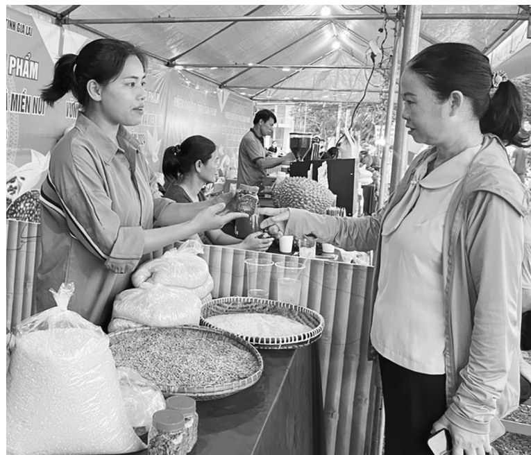
Bà con giới thiệu sản phẩm tại các phiên chợ

Với phương châm thương mại phải đi cùng sản xuất và tiêu thụ sản phẩm địa phương, cùng với các hoạt động xúc