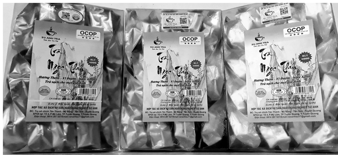
Sản phẩm trà Ngọc Thúy cấp đông do Hợp tác xã Sứ Anh sản xuất

đây, mỗi năm HTX chỉ sản xuất từ 3 đến 5 tấn chè khô, nhưng từ khi được hỗ trợ kinh phí khuyến công để đầu tư máy móc hiện đại như máy sao chè bằng gas, máy hút chân không, sản lượng chè thành phẩm đã tăng lên từ 7 đến 10 tấn mỗi năm, doanh thu đạt trên 5 tỷ đồng và tạo việc làm ổn định cho hàng chục lao động địa phương.