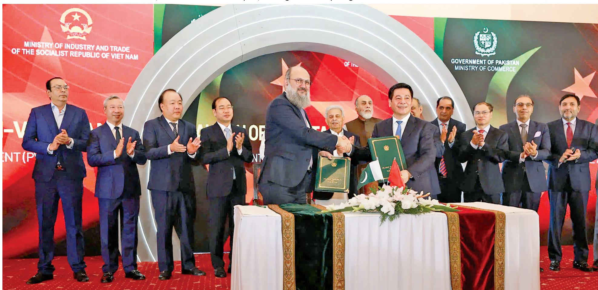
Bộ trưởng Bộ Công Thương Nguyễn Hồng Diên và Bộ trưởng Bộ Thương mại Jam Jam Kamal Khan ký Tuyên bố chung khởi động đàm phán Thỏa thuận thương mại ưu đãi Việt Nam - Pakistan