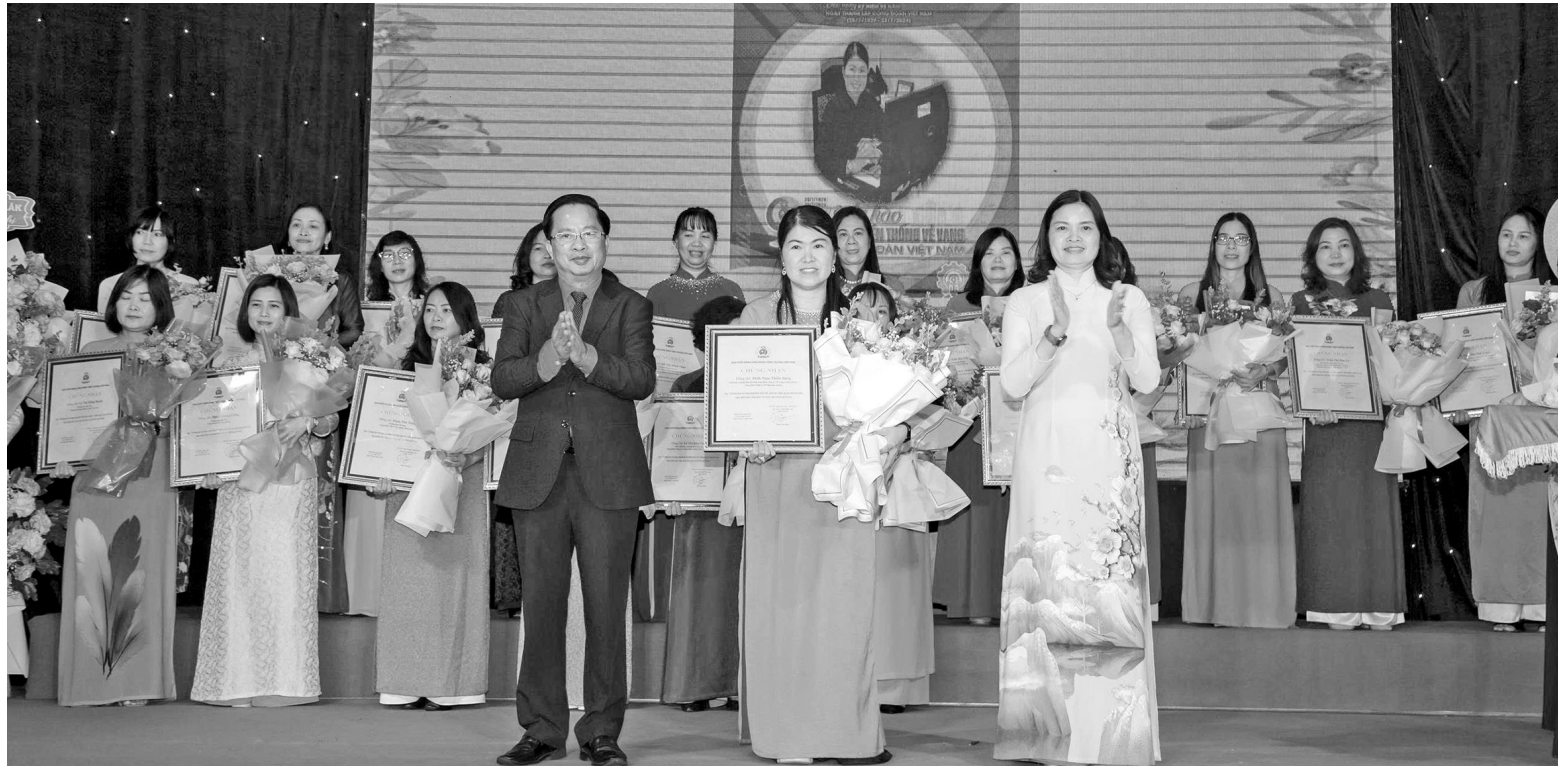
Công đoàn Công Thương Việt Nam tổ chức nhiều hoạt động biểu dương nữ công đoàn viên tiêu biểu