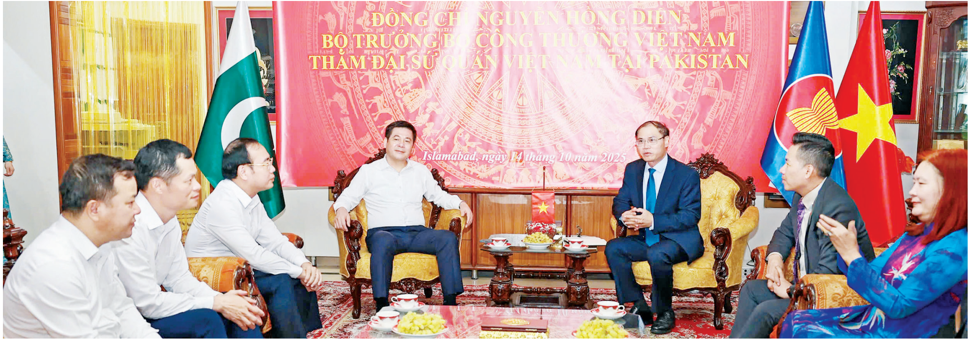
Bộ trưởng Bộ Công Thương Nguyễn Hồng Diễm thăm và làm việc tại Đại sứ quán Việt Nam tại Pakistan