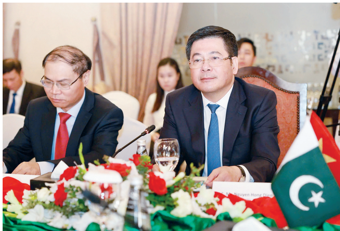
Bộ trưởng Bộ Công Thương Việt Nam Nguyễn Hồng Diên trao đổi nhiều giải pháp tạo thuận lợi hơn cho thương mại hai nước

kỹ thuật, thủ tục cấp phép nhập khẩu. Một số mặt hàng có thế mạnh của Việt Nam đang gặp khó khăn do thuế suất cao cùng các rào cản kỹ thuật và quy định kiểm dịch. Bộ trưởng đề nghị Pakistan nghiên cứu, xem xét giảm thuế, tạo điều kiện thuận lợi hơn cho hàng hóa Việt Nam tiếp cận thị trường.