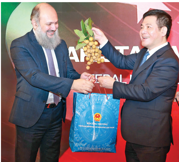
Bộ trưởng Nguyễn Hồng Diên gửi tặng Bộ trưởng Bộ Thương mại Pakistan Jam Kamal Khan nông sản đặc trưng của Việt Nam - nhân lồng Hưng Yên