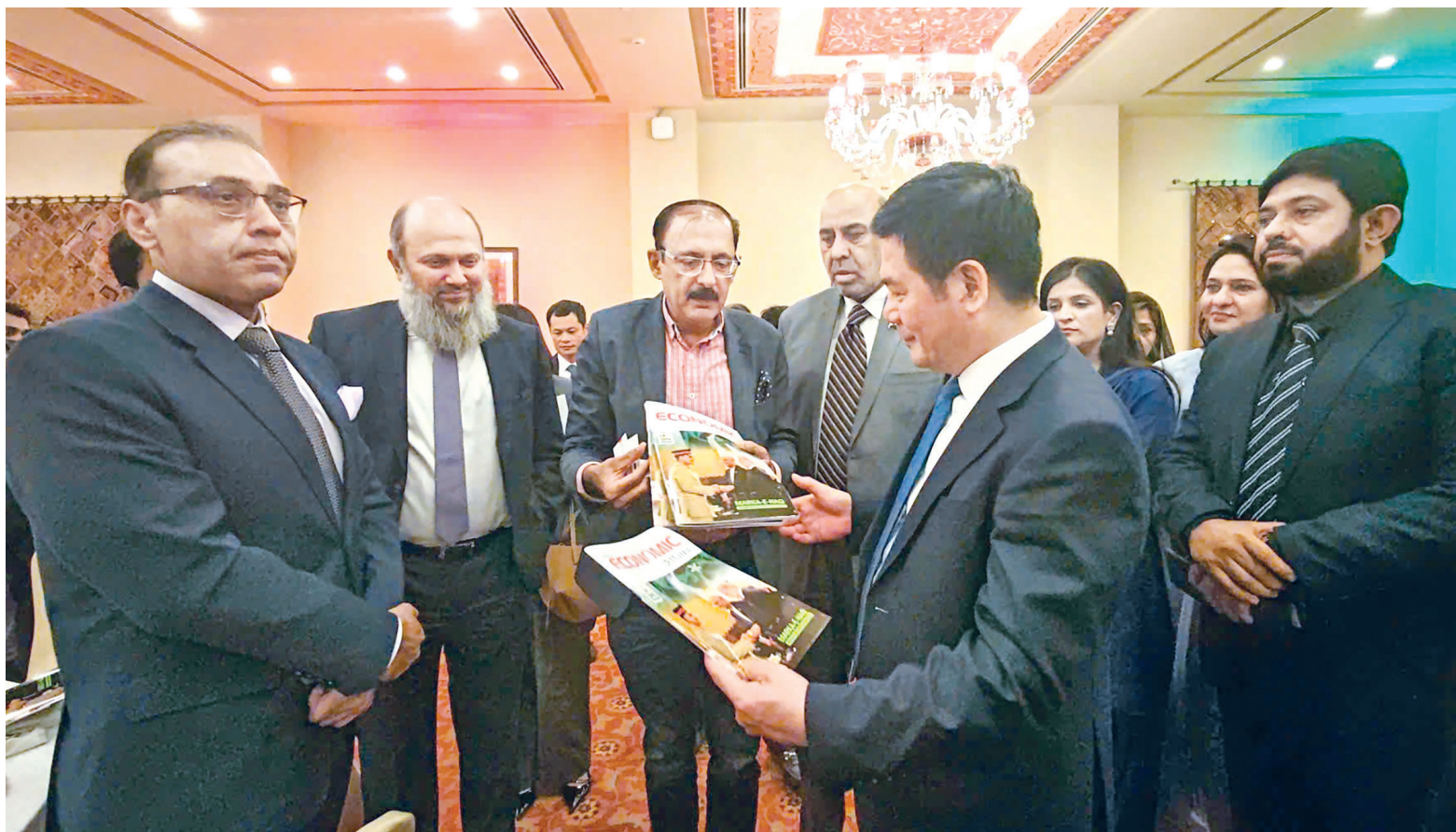
Sau diễn đàn, nhiều doanh nghiệp Pakistan đã gặp Bộ trưởng Nguyễn Hồng Diên để tìm hiểu thông tin hợp tác đầu tư, kinh doanh

biết, Việt Nam và Pakistan là 2 nền kinh tế ở khu vực châu Á đang phát triển rất năng động, có tổng quy mô dân số hơn 350 triệu người và đều ở vị trí chiến lược kết nối hai khu vực trọng yếu là Đông Nam Á và Nam Á. Cả hai đều có những thế mạnh riêng biệt: Nếu Pakistan là quốc gia có nguồn tài nguyên phong phú, công nghiệp dệt may, da giày, dược phẩm và ngành thực phẩm Halal phát triển, đang vươn lên mạnh mẽ ở khu vực Nam Á; thì Việt Nam đang được cộng đồng quốc tế đánh giá là một trong những nền kinh tế phát triển rất năng động, là điểm sáng trong bức tranh kinh tế của khu vực và thế giới.