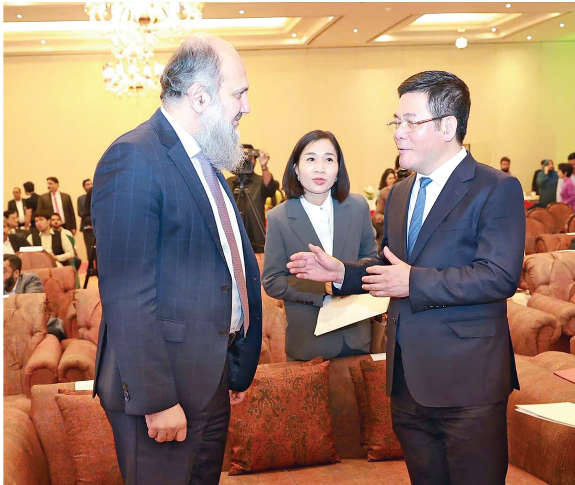
Hai Bộ trưởng trao đổi, thống nhất nhiều nội dung quan trọng trước diễn đàn