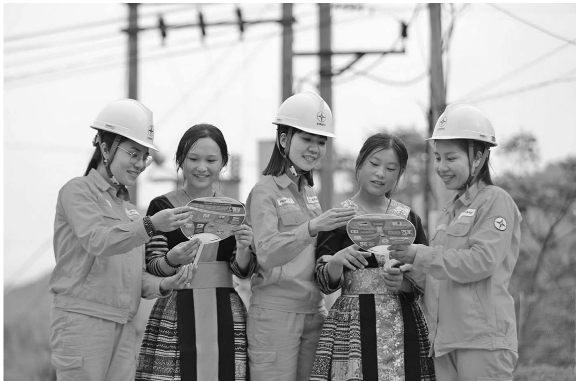
Lao động nữ có vai trò quan trọng trong ngành điện

bộ, hạnh phúc, văn minh". Phong trào đã trở thành nét đẹp truyền thống, lan tỏa mạnh mẽ trong đời sống của đoàn viên và người lao động.