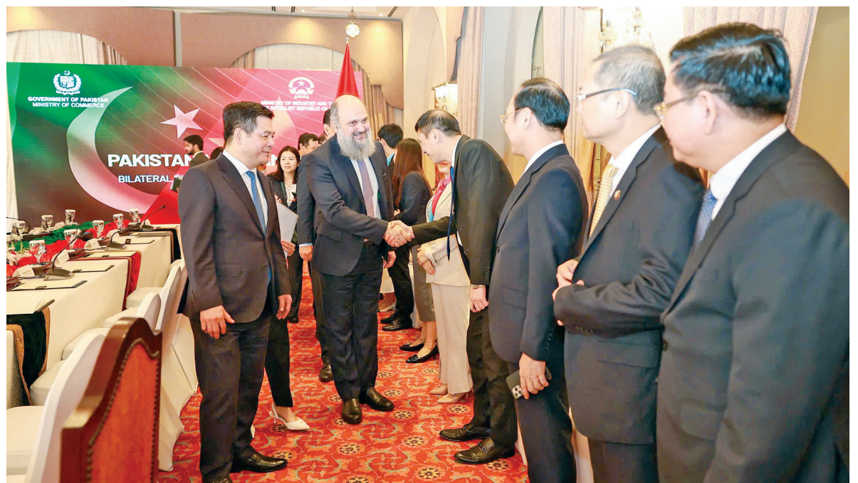
Bên lề hội đàm, Bộ trưởng Bộ Thương mại Pakistan Jam Kamal Khan gặp gỡ đoàn công tác Việt Nam