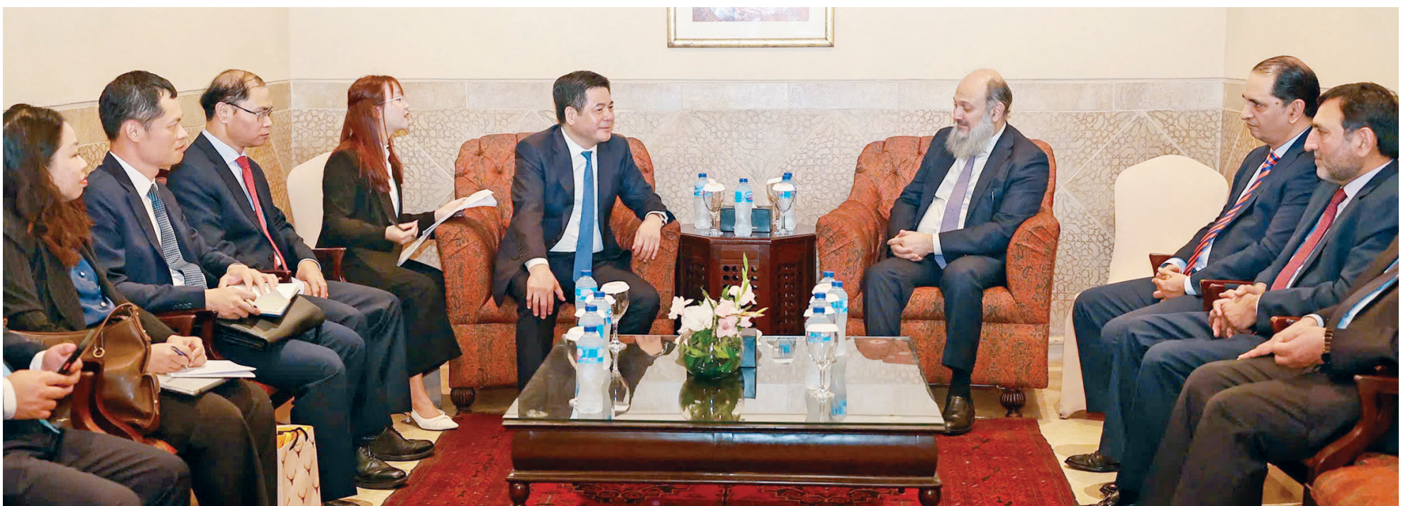
Trước hội đàm, hai Bộ trưởng đã có cuộc họp hẹp, trao đổi và thống nhất các nội dung thảo luận trong hội đàm