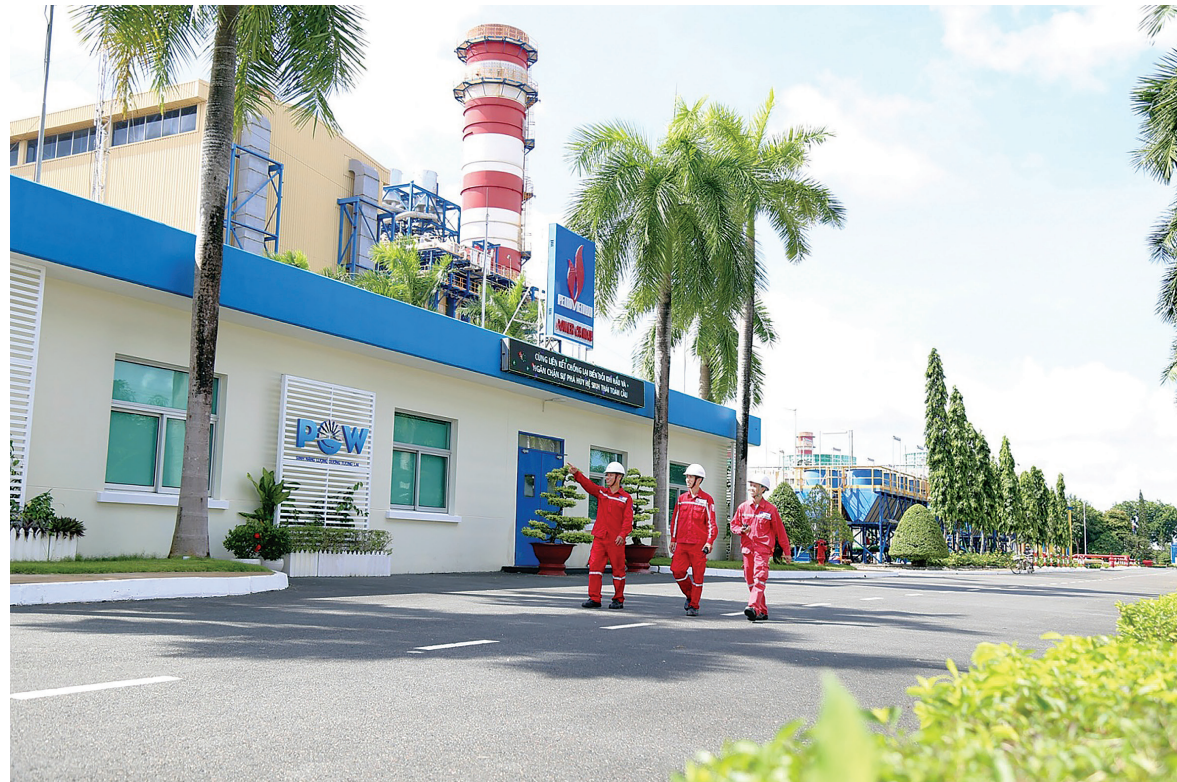
Nhà máy Điện Cà Mau

Quan trọng hơn, sự hiện diện của cụm công trình đã làm thay đổi diện mạo vùng đất cực Nam. Từ một tỉnh nông nghiệp thuần túy, Cà Mau vươn lên trở thành trung tâm công nghiệp năng