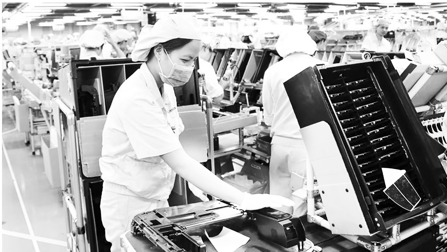
Hà Nội đang là điểm đến hấp dẫn của nhà đầu tư

"Trong Luật Thủ đô có nhiều chính sách đặc thù, vượt trội. Một trong số đó là tạo thêm cơ chế thu hút đầu tư của các nhà đầu tư tư nhân trong nước, nhà đầu tư chiến lược và nhà đầu tư nước ngoài. Hà Nội cũng đặc biệt chú trọng đến việc tạo ra môi trường kinh doanh thuận lợi thời gian qua. Tất cả những điều này cộng với Luật Thủ đô đã gửi tới một thông điệp mạnh mẽ, tạo ra sự hứng khởi cho các nhà đầu tư trong nước và nhà đầu tư nước ngoài", TS Lê Duy Bình chia sẻ. ■