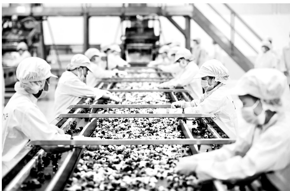
Kim ngạch xuất khẩu của Việt Nam sang thị trường các nước tham gia RCEP năm 2024 đạt 155,44 tỷ USD

đến là Nhật Bản tăng 27,5% và nhiều quốc gia ASEAN đạt mức tăng trung bình 20%. Sang giai đoạn 2023-2024, xu hướng tích cực này tiếp tục duy trì, nhiều loại nông sản của Việt Nam xuất khẩu sang Trung Quốc, Hàn Quốc, Nhật Bản và các nước ASEAN vẫn đạt kết quả khả quan, giữ vững đà tăng trưởng.