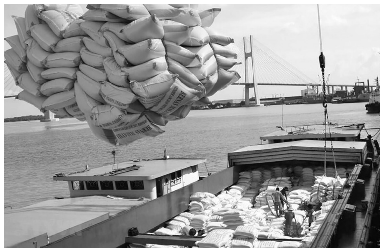
Tăng cường các giải pháp thúc đẩy sản xuất, xuất khẩu và ổn định thị trường gạo

Ngoài ra, nghiên cứu đàm phán, ký kết thỏa thuận ưu đãi thương mại với các thị trường