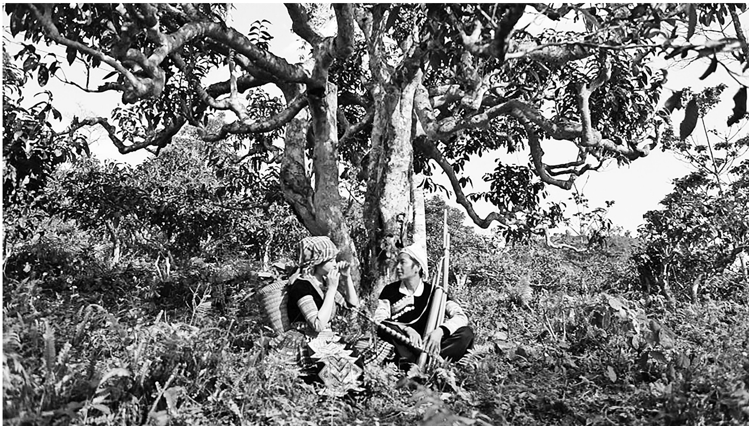
Lào Cai đang sở hữu nhiều tiềm năng phát triển hàng hóa, nông sản

Cùng với đó, tỉnh cần khuyến khích doanh nghiệp đầu tư vào chế biến sâu và xuất khẩu. Đây là giải pháp then chốt để nâng cao giá trị gia tăng, giảm phụ thuộc