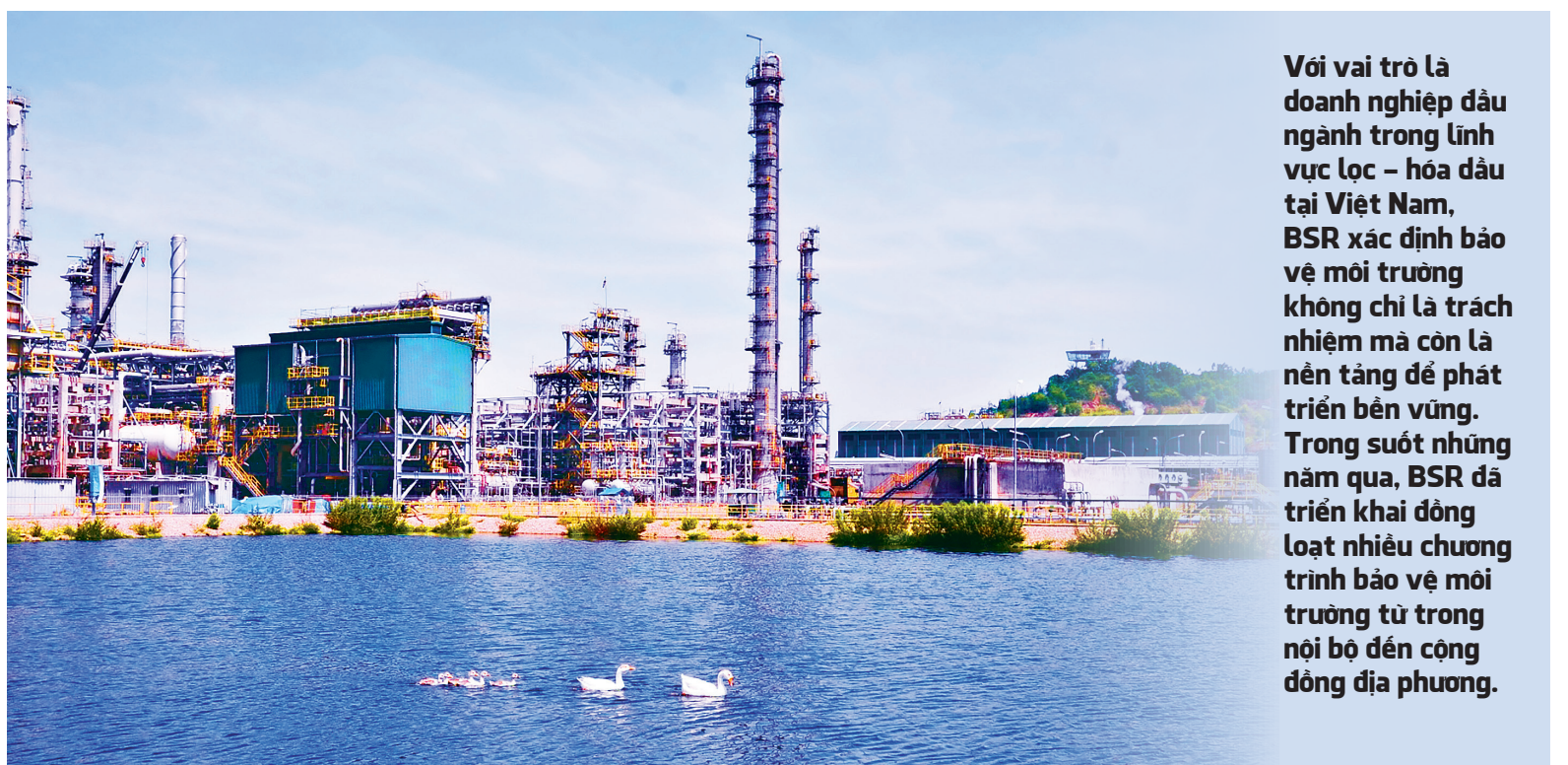
Khu vực hồ chứa nước thải đã được xử lý tại Nhà máy Lọc dầu Dung Quất

Thời gian qua, BSR tích cực nghiên cứu và phối hợp phát triển các nhiên liệu tương lai như hydro xanh và nhiên liệu hàng không bền vững (SAF). Đầu năm 2025, BSR đã ký kết với Tập đoàn Kellogg Brown & Root (KBR) hợp đồng tư vấn nghiên cứu tiên khả thi nhiên liệu hàng không bền vững (SAF). Đây là một trong những bước đi mới trong hành trình góp phần chuyển dịch năng lượng và giảm phát thải CO 2 của BSR. Qua đó, thúc đẩy quá trình chuyển đổi năng lượng tại Việt Nam. Bên cạnh đó, BSR cũng tích cực nghiên cứu chuỗi cung ứng về hydro xanh, đây được kỳ vọng là nhiên liệu sử dụng trong ngành giao thông vận tải trong tương lai. ■