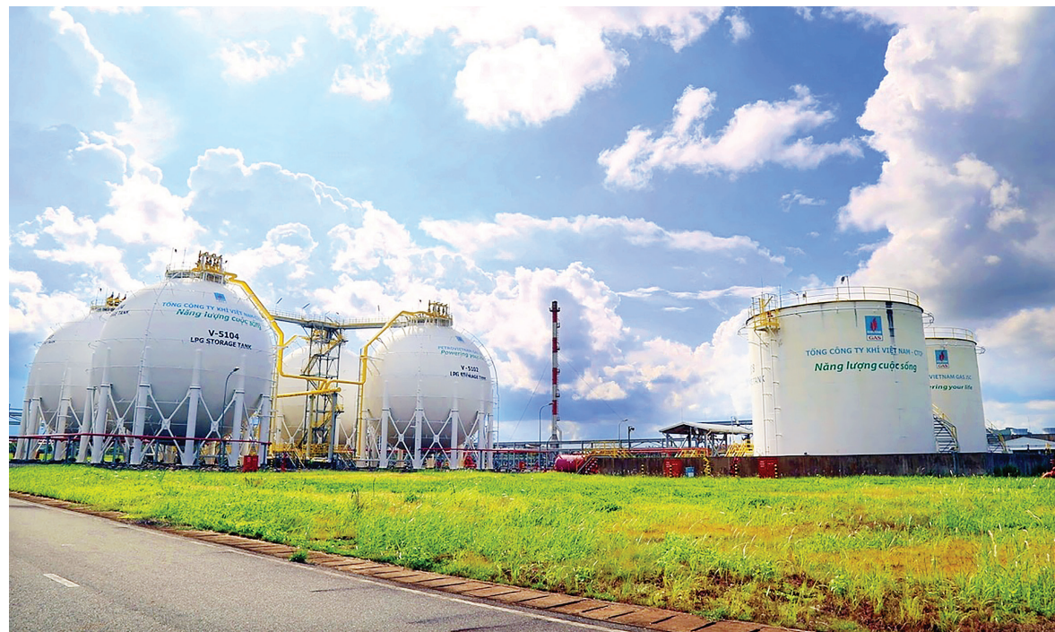
Các bồn chứa ở Nhà máy Xử lý khí Cà Mau

lượng - hóa chất của cả nước. Hệ thống hạ tầng giao thông, dịch vụ, thương mại, đời sống xã hội được cải thiện rõ rệt.