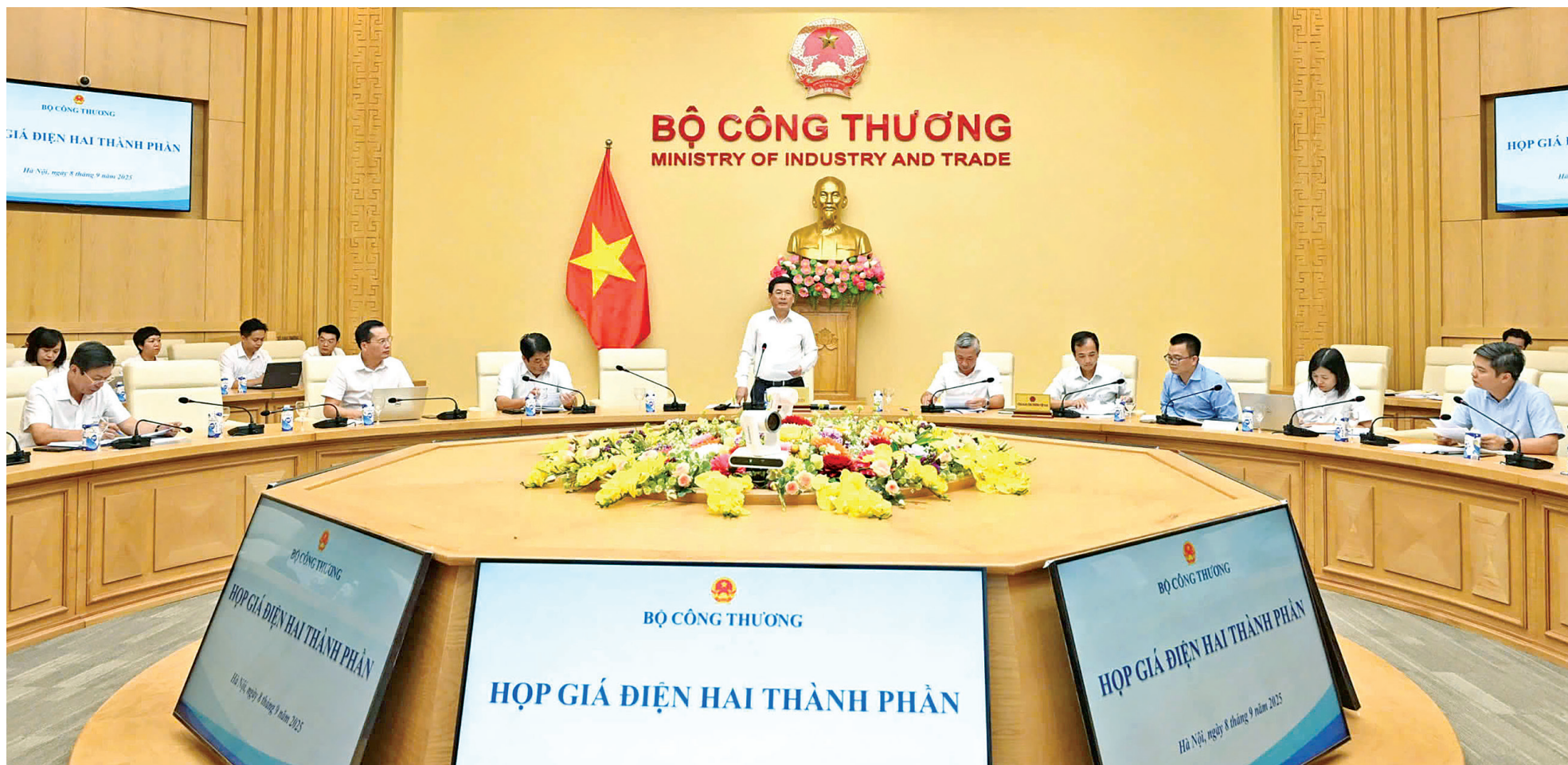
Toàn cảnh buổi làm việc