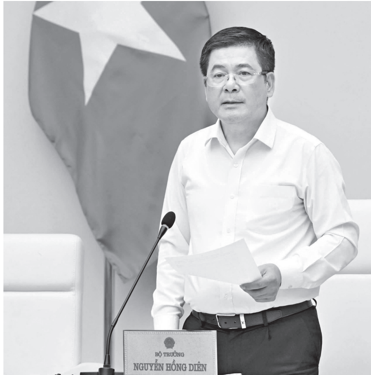
Bộ trưởng Nguyễn Hồng Diên chỉ đạo triển khai 5 nhiệm vụ trọng tâm

Ngày 8/9, Bộ trưởng Bộ Công Thương Nguyễn Hồng Diên đã chủ trì buổi làm việc với các đơn vị trực thuộc Bộ, lãnh đạo Tập đoàn Điện lực Việt Nam (EVN) và các tổng công ty điện lực về giá điện 2 thành phần.