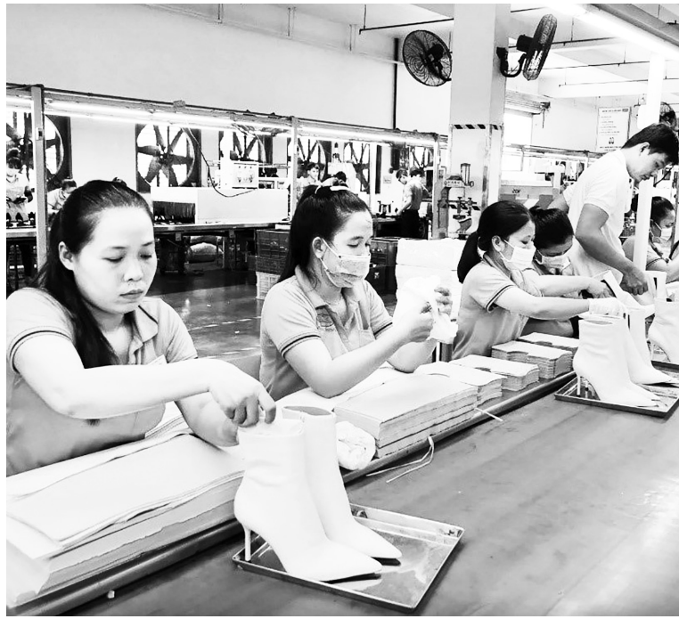
RCEP cũng mang lại lợi ích cạnh tranh cho các SMEs thông qua việc đơn giản hóa các quy tắc xuất xứ

RCEP còn thúc đẩy kinh tế số với các cam kết hỗ trợ doanh nghiệp nhỏ và siêu nhỏ chuyển đổi số, phát triển thương mại điện tử và thanh toán số. Đây là hướng