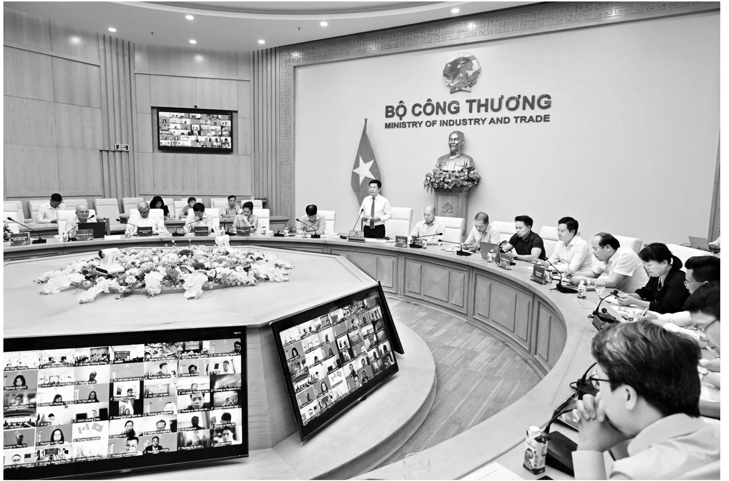
Toàn cảnh hội nghị