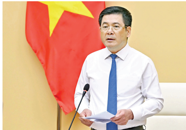
Bộ trưởng Bộ Công Thương Nguyễn Hồng Diên phát biểu chỉ đạo tại Hội nghị giao ban xúc tiến thương mại với hệ thống thương vụ Việt Nam ở nước ngoài tháng 8/2025