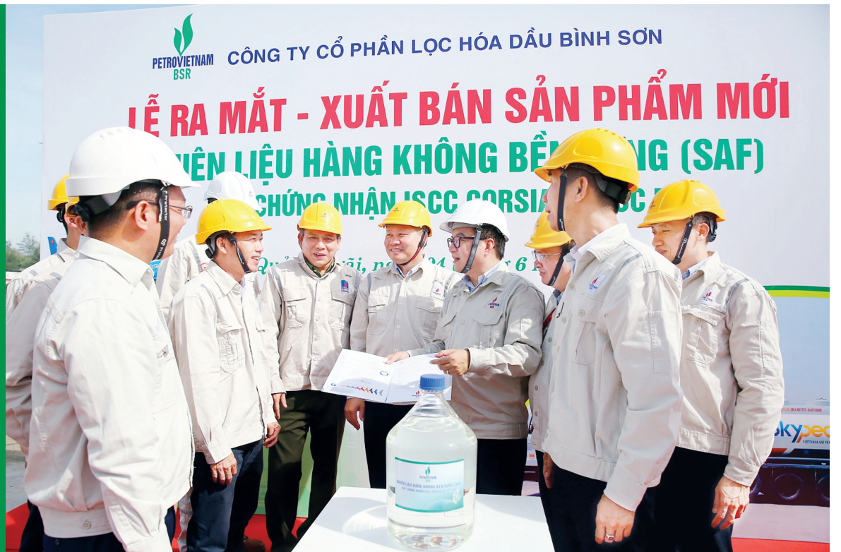
BSR tự hào là một trong những đơn vị tiên phong triển khai thương mại hóa nhiên liệu hàng không bền vững