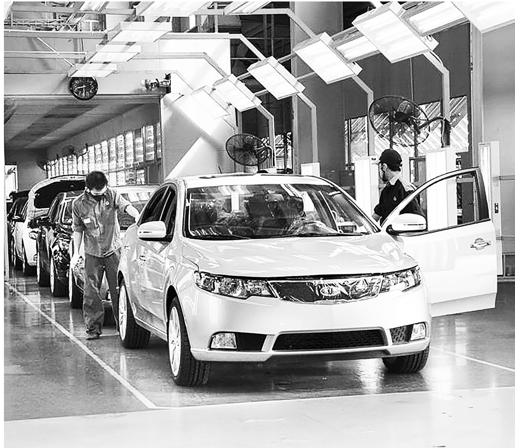
CNHT là nền tảng chiến lược cho quá trình công nghiệp hóa, hiện đại hóa của Việt Nam

Cũng theo ông Bình, thời gian qua, Chính phủ Việt Nam đã và đang tạo mọi điều