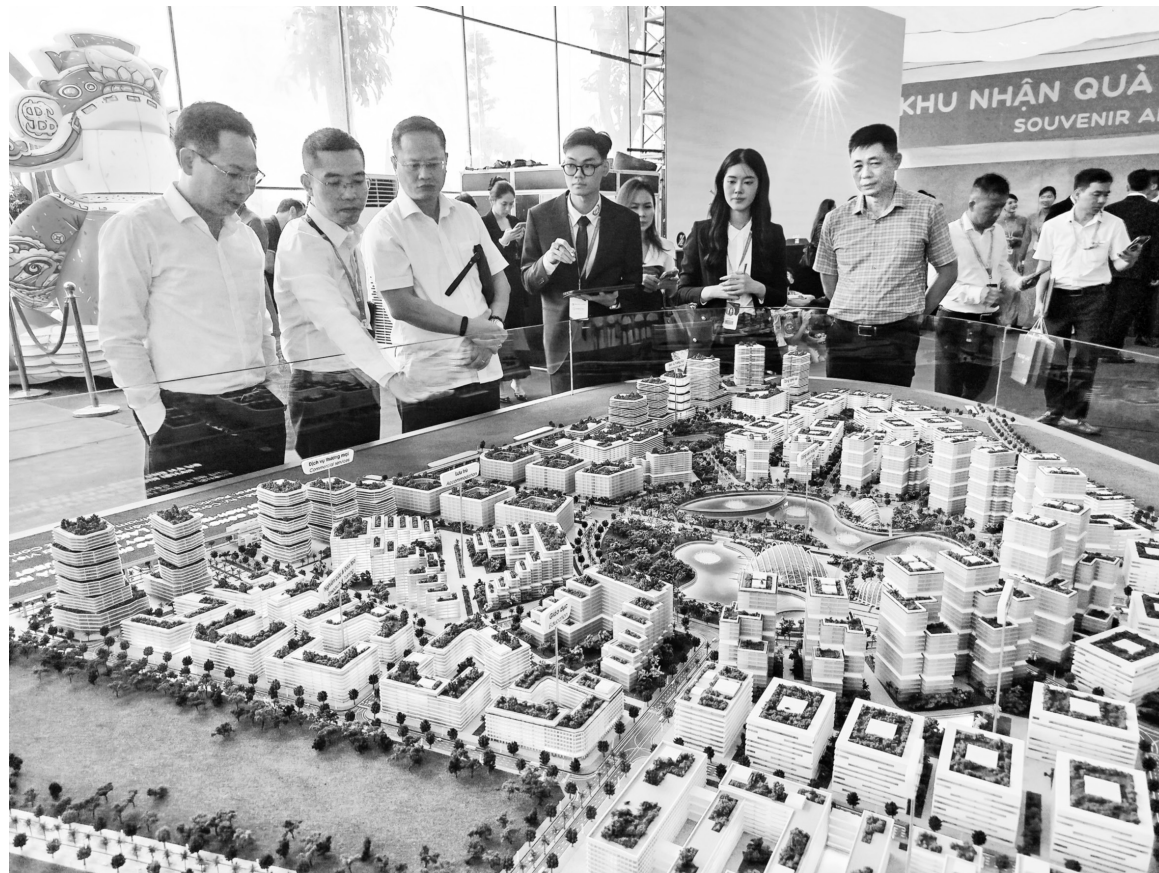
Phối cảnh dự án Khu công nghệ cao sinh học Hà Nội, thuộc nhóm doanh nghiệp FDI vừa được khởi công tháng 8/2025

Ngoài Gamuda Land, nhiều dự án FDI quy mô lớn cũng đang góp phần định hình diện mạo đô thị mới của Hà Nội như: Khu đô thị mới C2-Gamuda Gardens, Khu