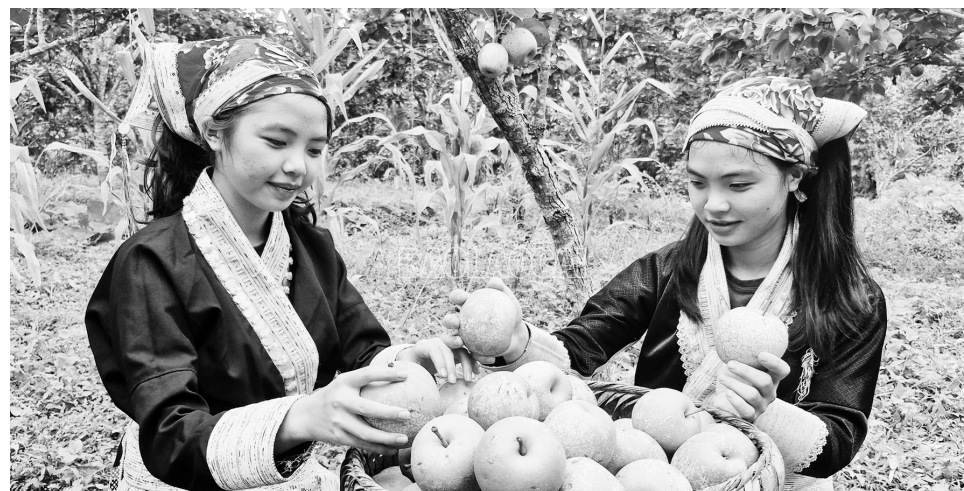
Thu hoạch lê Tai Nung ở xã Mường Hum (tỉnh Lào Cai)

UBND phường Tuần Châu, tỉnh Quảng Ninh trân trọng thông báo để các hộ dân, tổ chức liên quan biết, phối hợp và thực hiện.