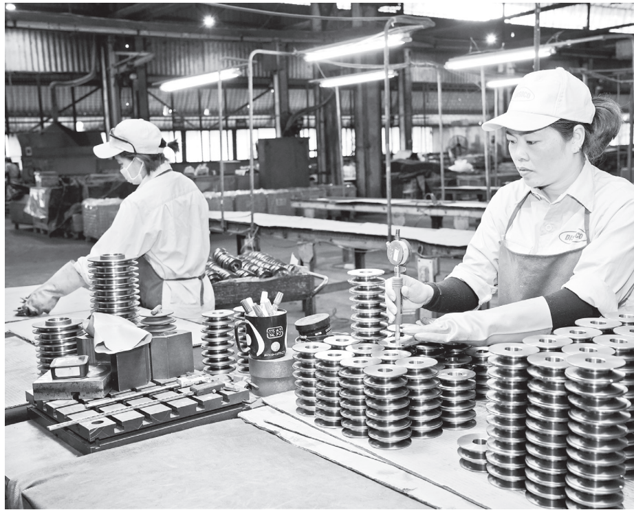
Kinh tế địa phương tăng trưởng tích cực trong 8 tháng năm 2025

Cách làm "cầm tay chỉ việc" đã giúp chính quyền địa phương vận hành mô hình mới một cách ổn định. Từ đó, tạo điều kiện thuận lợi, nhanh chóng cho doanh nghiệp và người dân tiếp cận thủ tục hành chính. Đây là một cải cách quan trọng, giúp gắn kết công tác quản lý từ trung ương đến cơ sở, góp phần