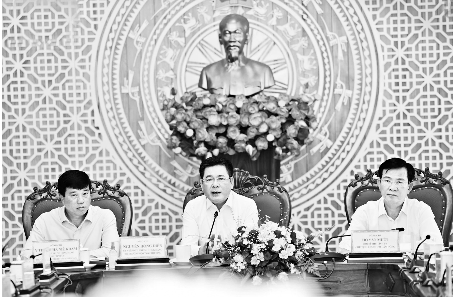
Đoàn công tác của Bộ Công Thương do Bộ trưởng Nguyễn Hồng Diên làm Trưởng đoàn có buổi làm việc với Thường trực Tỉnh ủy và UBND tỉnh Lâm Đồng

Thứ hai, triển khai rà soát, điều chỉnh quy hoạch tỉnh cho giai đoạn phát triển mới, trên cơ sở cấu trúc không gian mở, gắn kết vùng sinh thái, cao nguyên, trung du, duyên hải... tạo nên một chỉnh thể thống nhất, đồng bộ, lan tỏa.