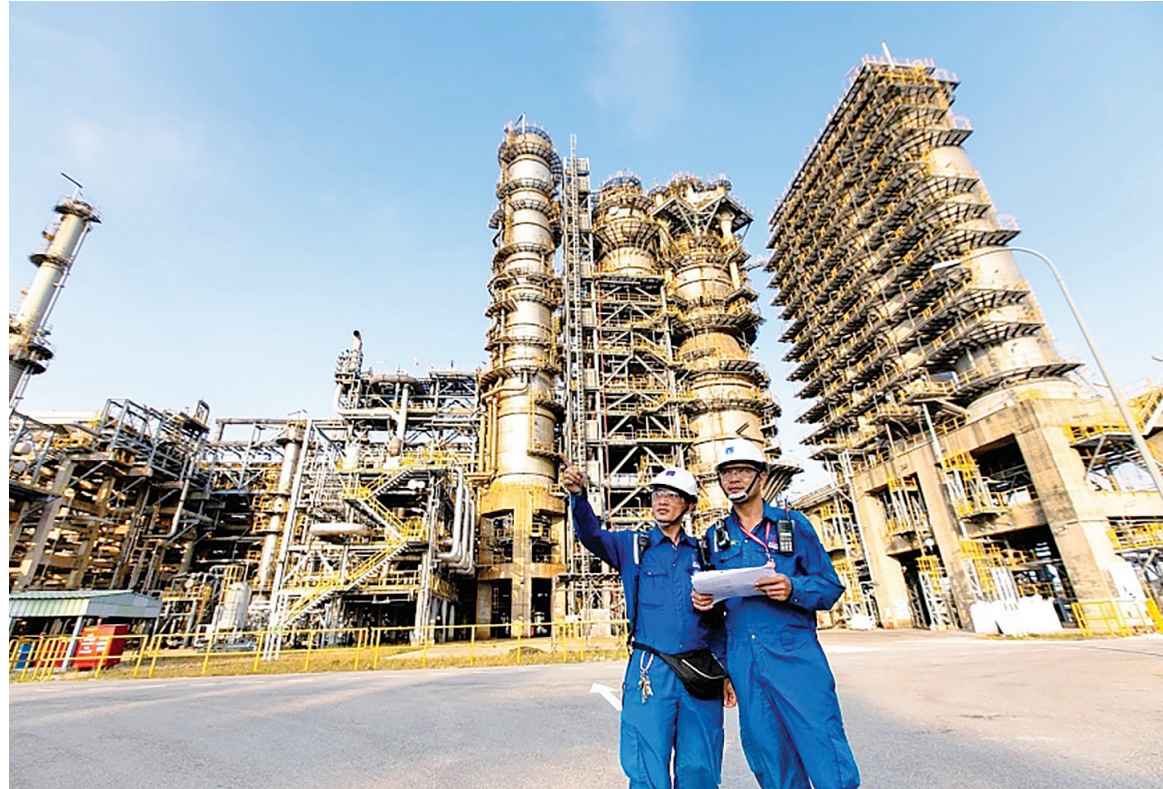
Người lao động Nhà máy Lọc dầu Dung Quất

dấu ấn rõ nét của một doanh nghiệp quốc gia có quy mô lớn, năng lực tài chính vững mạnh và ảnh hưởng sâu rộng đến kinh tế vĩ mô.