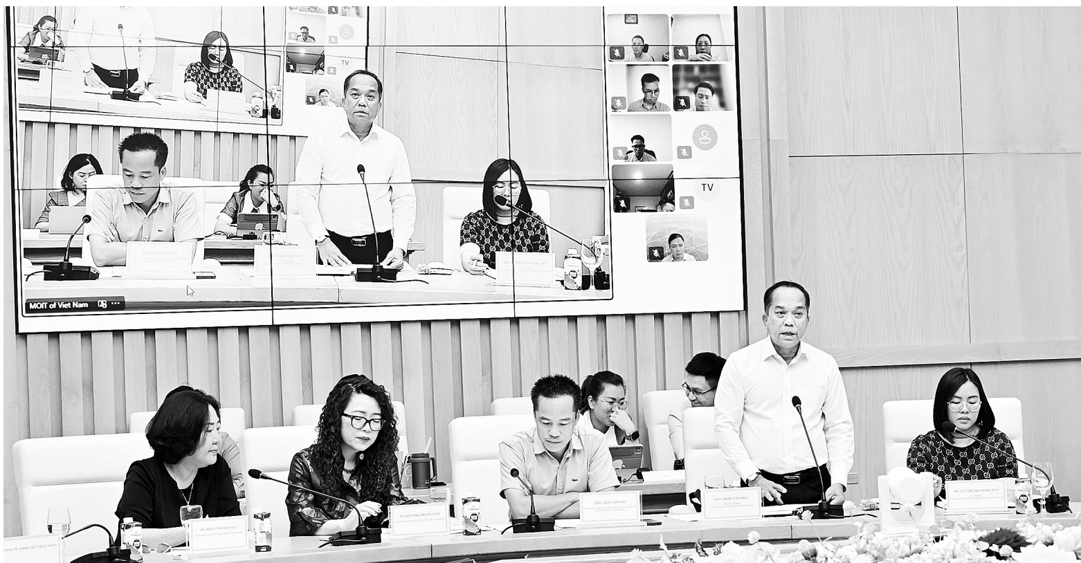
Doanh nghiệp kiến nghị các giải pháp tháo gỡ khó khăn cho xuất khẩu gạo

Thứ năm , đối với các doanh nghiệp xuất khẩu gạo: Cần chú trọng duy trì chất lượng sản phẩm hàng hóa, tiếp tục nghiên cứu thị trường và đáp ứng tối đa các tiêu chuẩn mà nước nhập khẩu đưa ra. Đồng thời, coi trọng việc xây dựng, củng cố và quảng bá thương hiệu gạo Việt Nam trong các thị trường xuất khẩu. ■