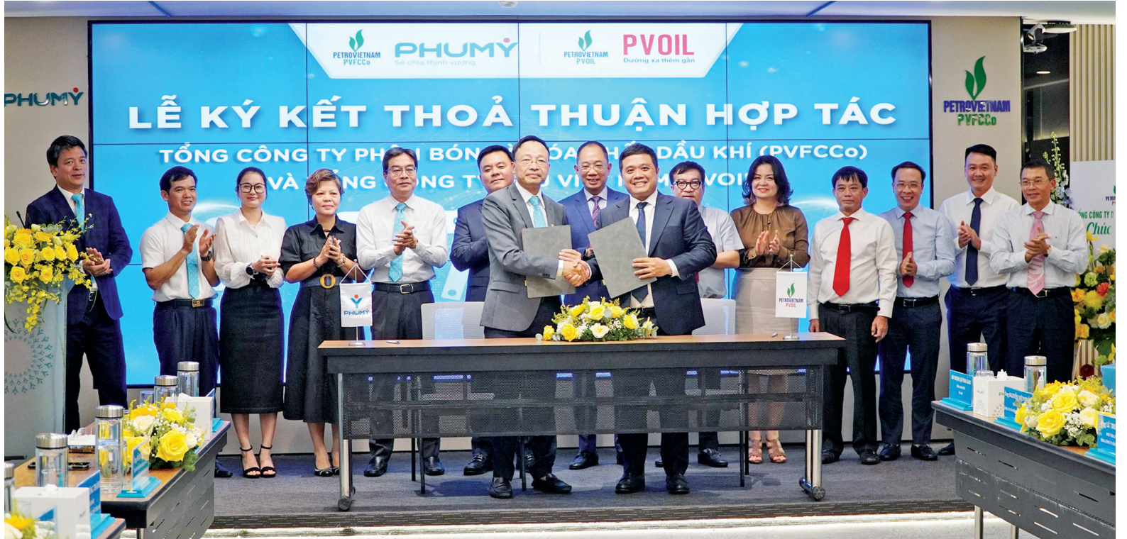
PVFCCo - Phú Mỹ và PVOIL ký kết thỏa thuận hợp tác trong lĩnh vực dịch vụ, thương mại và hóa chất