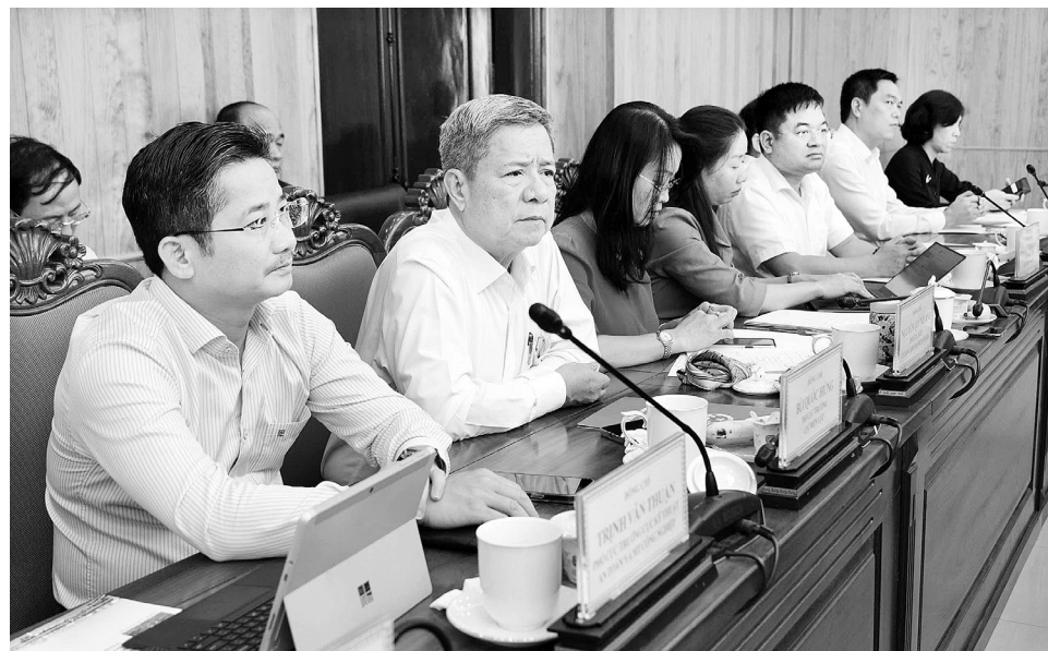
Đại diện các đơn vị thuộc Bộ Công Thương tham dự buổi làm việc

Đoàn công tác của Bộ Công Thương về địa phương đã thể hiện sự quan tâm, chỉ đạo sát sao của đồng chí Bộ trưởng và là minh chứng cho tinh thần trách nhiệm, sự hỗ trợ thiết thực trong việc tháo gỡ khó khăn, vướng mắc, góp phần thúc đẩy phát triển kinh tế - xã hội của Bộ Công Thương.