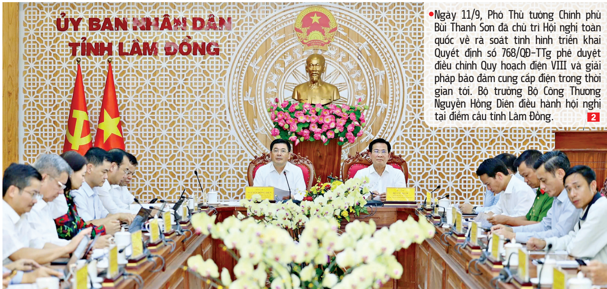
Bộ trưởng Nguyễn Hồng Diên điều hành hội nghị tại điểm cầu tỉnh Lâm Đồng