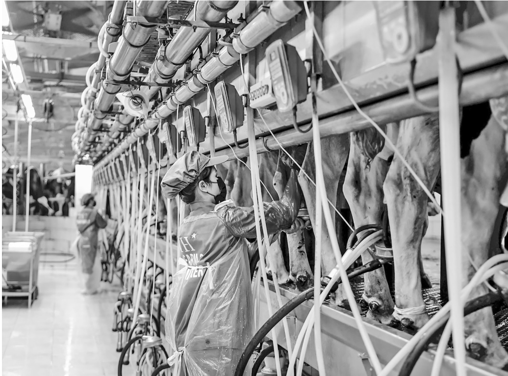
Hệ thống máy móc hiện đại phục vụ công đoạn vắt sữa bò tại trang trại của Công ty Cổ phần Chuỗi Thực phẩm TH

Còn tại Công ty Cổ phần Chuỗi thực phẩm TH, doanh nghiệp này đã triển khai hệ thống truy xuất nguồn gốc từ trang trại đến bàn ăn bằng cách sử dụng công nghệ mã vạch và QR code trên tất cả các sản phẩm. Khi đó, người tiêu dùng dễ dàng truy cập thông tin về nguồn gốc sữa, quy trình sản xuất và chất lượng sản phẩm.