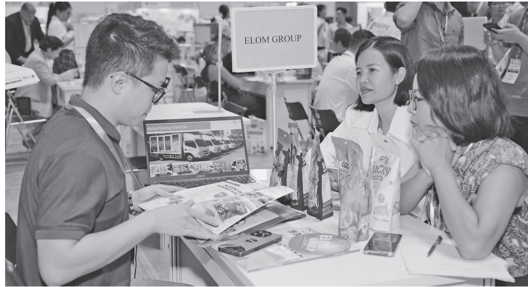
Các cuộc gặp gỡ B2B giữa các doanh nghiệp luôn diễn ra sôi nổi