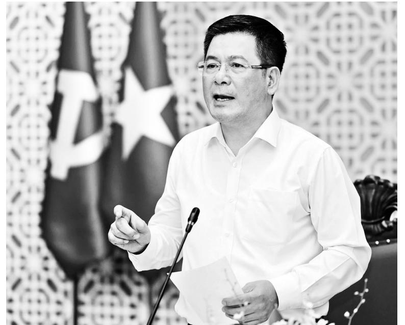
Bộ trưởng Bộ Công Thương Nguyễn Hồng Diên phát biểu tại hội nghị

Thứ hai, khẩn trương lựa chọn, hỗ trợ nhà đầu tư, kịp thời tháo gỡ vướng mắc tại địa phương hoặc báo cáo bộ, ngành liên quan để xử lý. Bộ Công Thương sẵn sàng phối hợp, cử chuyên gia hỗ trợ các dự án trọng điểm.