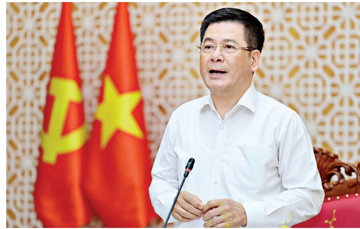
Bộ trưởng Bộ Công Thương Nguyễn Hồng Diên phát biểu tại buổi làm việc