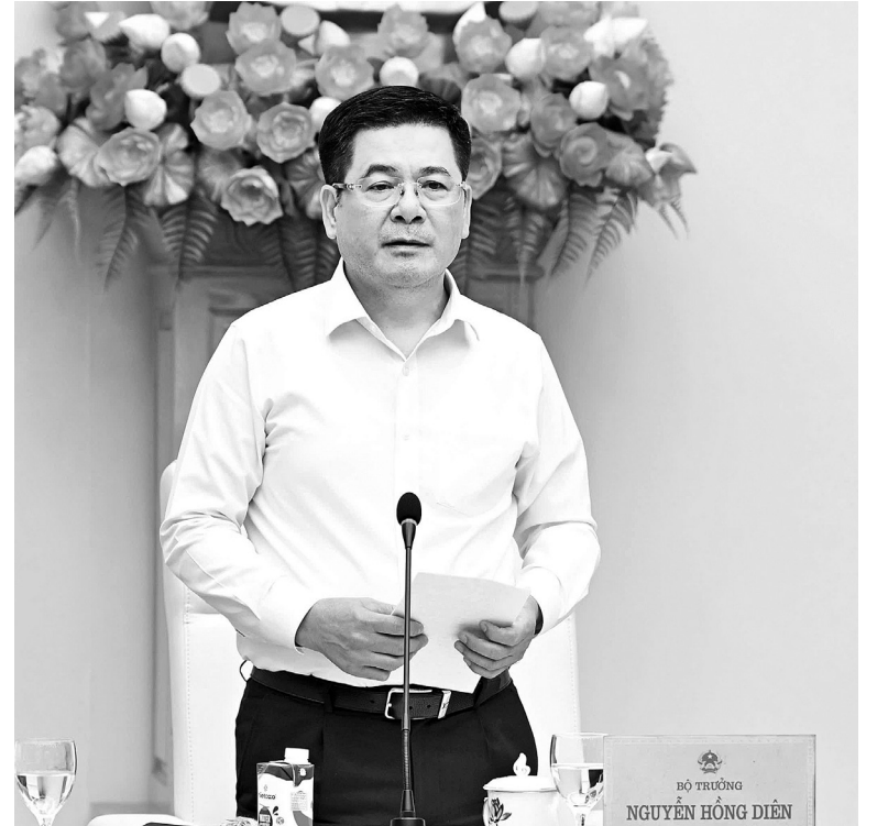
Bộ trưởng Bộ Công Thương Nguyễn Hồng Diên chủ trì hội nghị.

Thống nhất với các ý kiến phát biểu tại hội nghị, Bộ trưởng Nguyễn Hồng Diên đánh giá, trong 8 tháng đầu năm 2025, nhờ sự chỉ đạo quyết liệt của Chính phủ, sự vào cuộc đồng bộ của các bộ, ngành, địa phương và nỗ lực của doanh nghiệp, ngành lúa gạo Việt Nam đã đạt kết quả rất tích cực.