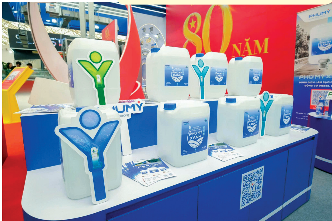
Sản phẩm Phú Mỹ Xanh trưng bày tại gian hàng của Phú Mỹ ở triển lãm A80

PVFCCo - Phú Mỹ cam kết đưa DEF - Phú Mỹ Xanh trở thành sản phẩm hóa chất tiêu chuẩn quốc tế, phục vụ cộng đồng và bảo vệ môi trường - đúng với định vị dòng sản phẩm hóa chất Phú Mỹ: "Chuỗi sản phẩm hóa chất tiêu chuẩn quốc tế, vì sự phát triển của con người và môi trường".