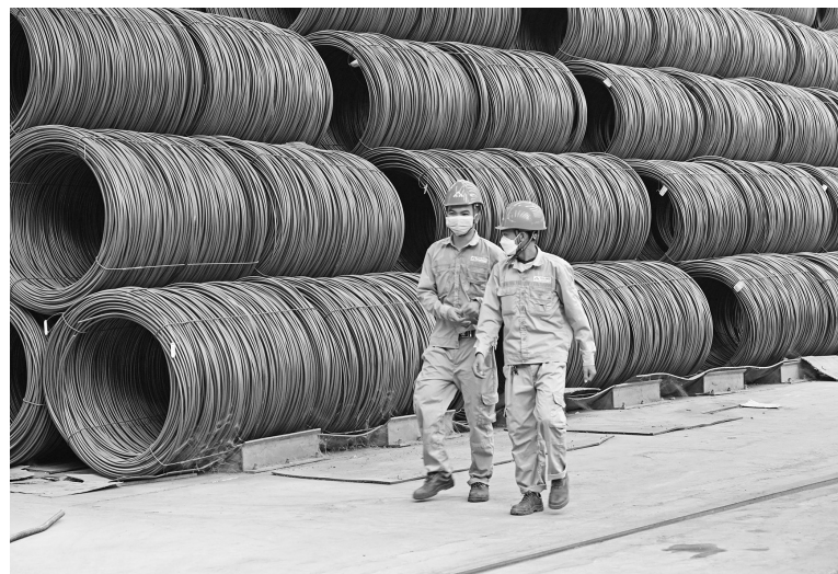
Hệ thống cảnh báo sớm góp phần duy trì ổn định xuất khẩu hàng hóa trước xu thế gia tăng điều tra phòng vệ thương mại

Các kết quả trên đồng thời thể hiện sự nỗ lực không ngừng của các cơ quan quản lý, cộng đồng doanh nghiệp, hiệp hội trong việc phối hợp ứng phó với các