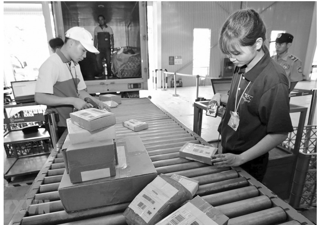
Thương mại điện tử thúc đẩy dịch vụ logistics phát triển