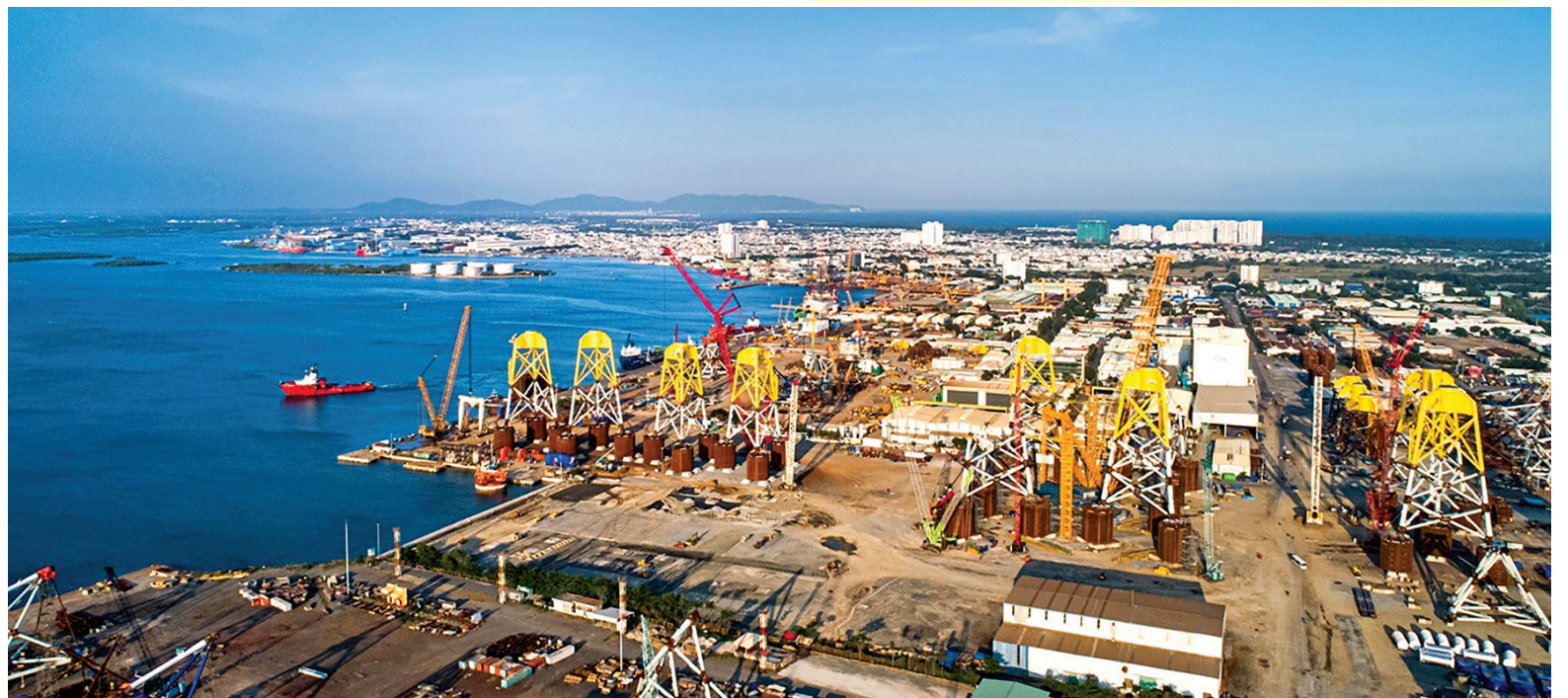
Petrovietnam với tầm nhìn chiến lược kiến tạo tương lai năng lượng xanh, bền vững, đồng hành cùng sự phát triển của đất nước

Chặng đường phía trước còn nhiều thử thách, nhưng với ý chí bền bỉ và khát vọng cháy bỏng, tinh thần đoàn kết và sáng tạo, Petrovietnam chắc chắn sẽ tiếp tục viết nên những trang sử mới, góp phần vào khát vọng dựng xây đất nước phồn vinh, hùng cường.