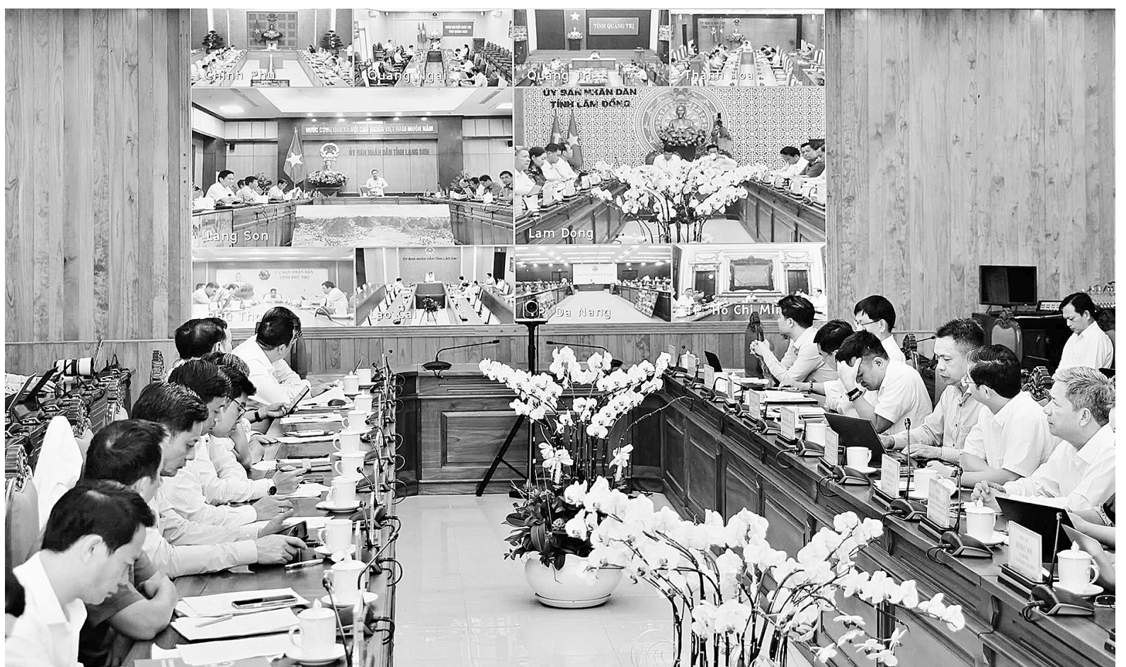
Hội nghị được tổ chức theo hình thức trực tuyến kết hợp trực tiếp

Do đó, để triển khai, thứ nhất, đề nghị các địa phương tập trung chủ động rà soát, tích hợp quy hoạch điện và các quy hoạch ngành vào quy hoạch tỉnh, đồng thời điều chỉnh kế hoạch sử dụng đất để có cơ sở pháp lý cho dự án.