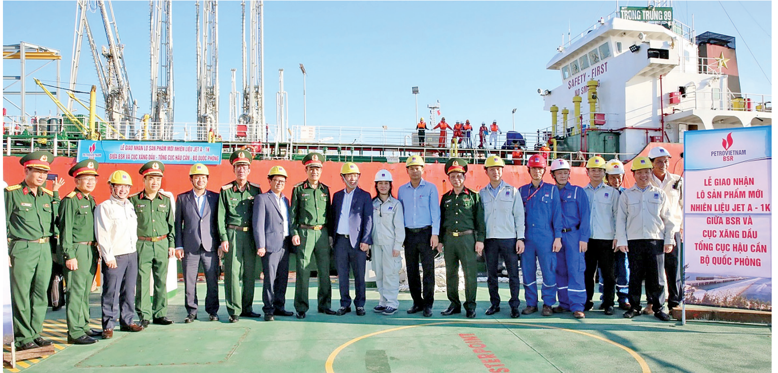
BSR bàn giao lò nhiên liệu đặc chủng đầu tiên cho Tổng cục Hậu cần (Bộ Quốc phòng)

Trong hành trình 80 năm đầy tự hào của dân tộc Việt Nam, Công ty Cổ phần Lọc hóa dầu Bình Sơn (BSR), đơn vị thành viên của Tập đoàn Công nghiệp - Năng lượng Quốc gia Việt Nam (Petrovietnam) luôn tự hào khi giữ vai trò trụ cột trong bảo đảm an ninh năng lượng quốc gia. Đồng thời, gánh vác sứ mệnh đặc biệt khi sản xuất thành công nhiên liệu đặc chủng phục vụ quốc phòng - an ninh, góp phần trực tiếp vào sự nghiệp bảo vệ Tổ quốc.