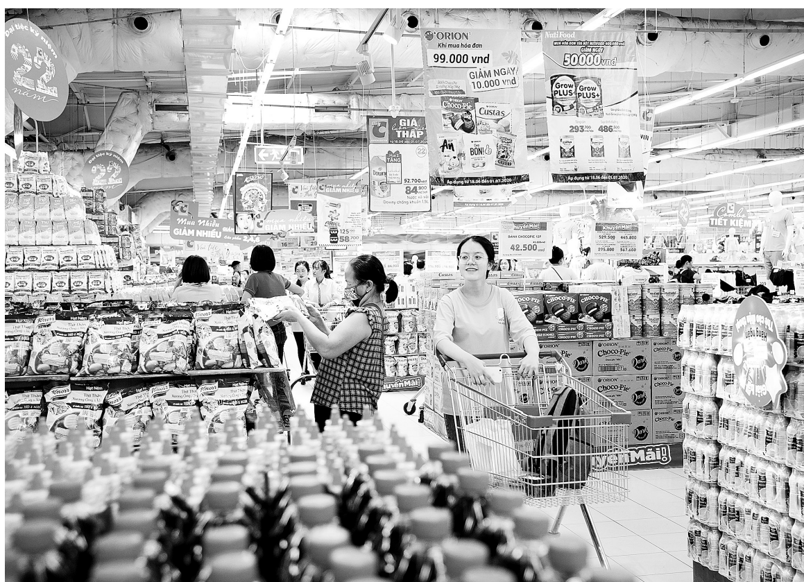
Doanh thu bán lẻ hàng hóa 8 tháng năm 2025 ước đạt 3.495,8 nghìn tỷ đồng, chiếm 76,3% tổng mức và tăng 8,1% so với cùng kỳ năm trước

Mục tiêu tăng trưởng nhanh nhưng bền vững là thách thức lớn, song với sự điều hành quyết liệt, sự phối hợp đồng bộ và tinh thần dám nghĩ, dám làm từ Trung ương đến địa phương, niềm tin vào thành công vẫn trọn vẹn.