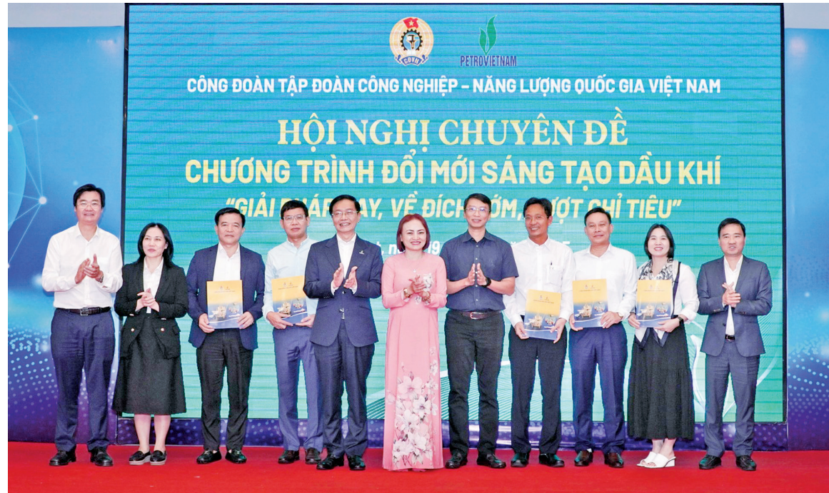
Công đoàn Petrovietnam khen thưởng 6 đơn vị tiêu biểu thực hiện Chương trình thi đua "Đổi mới sáng tạo dầu khí" trong 6 tháng đầu năm 2025

Chỉ riêng 6 tháng đầu năm 2025, toàn tập đoàn đã ghi nhận 4.713 sản phẩm sáng tạo, trong đó có 1.062 sản phẩm đăng ký trong chương trình "1 triệu sáng kiến", đạt 131% kế hoạch, đưa Petrovietnam đứng trong Top 3 toàn quốc về phong trào thi đua sáng kiến. Các sản phẩm trải rộng từ công nghệ, kỹ thuật, nghiên cứu khoa học đến các giải pháp quản trị, quản lý sản xuất, kinh doanh.