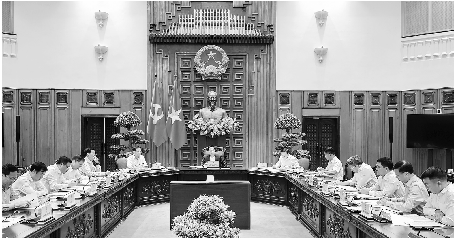
Thủ tướng Phạm Minh Chính chủ trì cuộc họp của Thường trực Chính phủ về một số nội dung quan trọng sáng ngày 15/9

Một điểm nổi bật trong chỉ đạo là yêu cầu phối hợp giữa chính sách tài khóa và chính sách tiền tệ, trong đó khai thác tốt hơn dư địa của tài khóa để hỗ trợ tiền tệ, nghĩa là chi tiêu công, đầu tư công, các gói hỗ trợ từ ngân sách phải được tính toán tối ưu để giảm bớt áp lực cho lãi suất, tỷ giá, qua đó vừa hỗ trợ tăng trưởng, vừa kiềm chế lạm phát. Điều hành tiền tệ được nhấn mạnh theo hướng ưu tiên kiểm soát rủi ro, giám sát dòng vốn đi đúng hướng, tập trung vào sản xuất, kinh doanh, các lĩnh vực ưu tiên. Thông điệp này rõ ràng: Dòng tiền không thể tiếp tục “chảy” vào những lĩnh vực đầu cơ rủi ro mà phải được