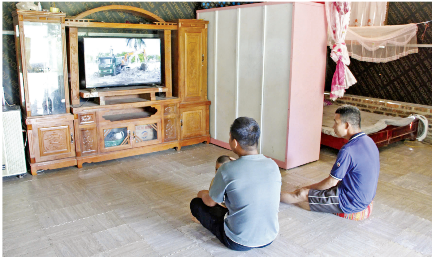
Đời sống vật chất và tinh thần của bà con dân tộc thiểu số ở Sơn La thay đổi rõ rệt