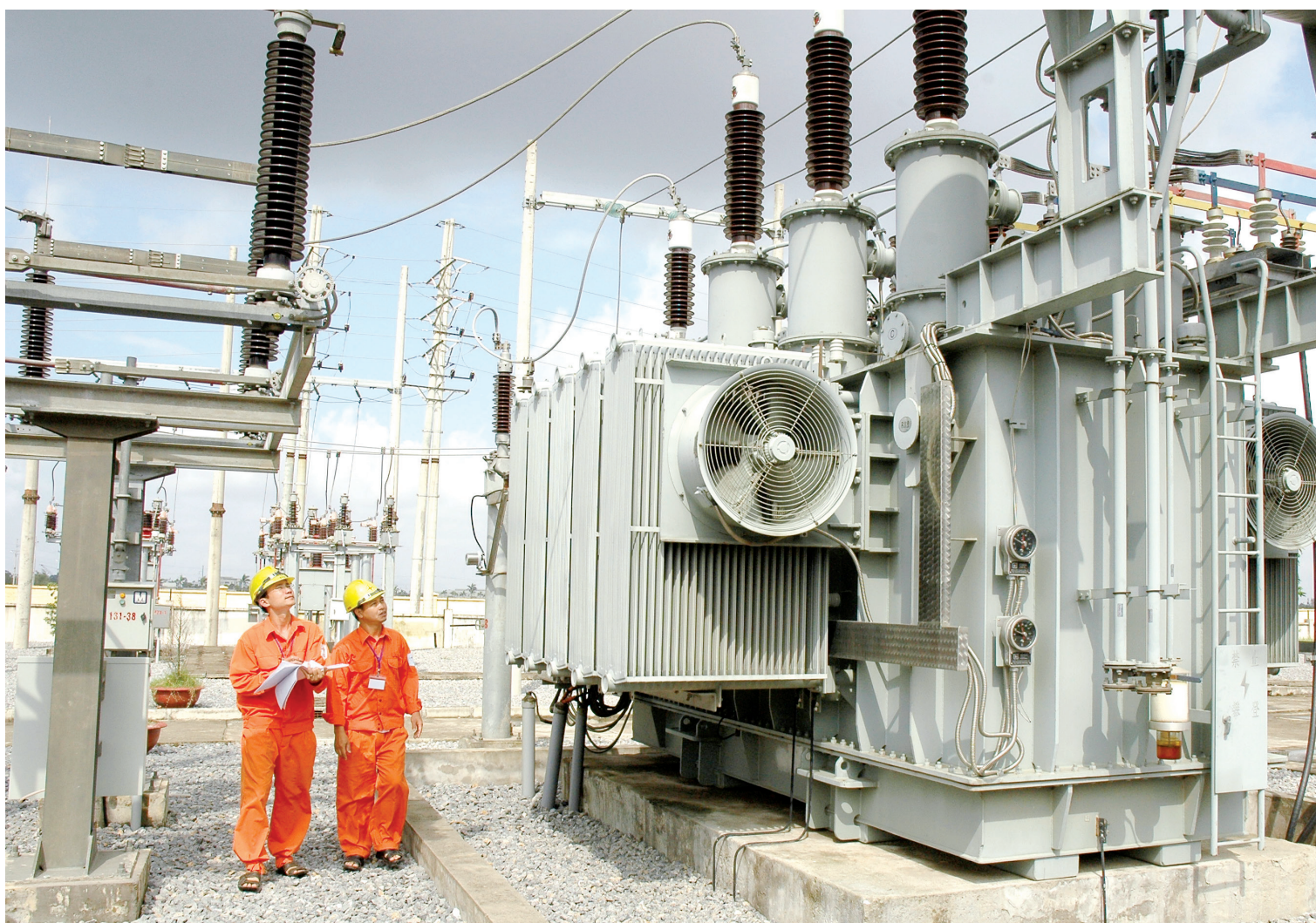
Xóa bỏ cơ chế bù chéo giá điện còn khuyến khích thu hút đầu tư, đặc biệt từ khu vực tư nhân