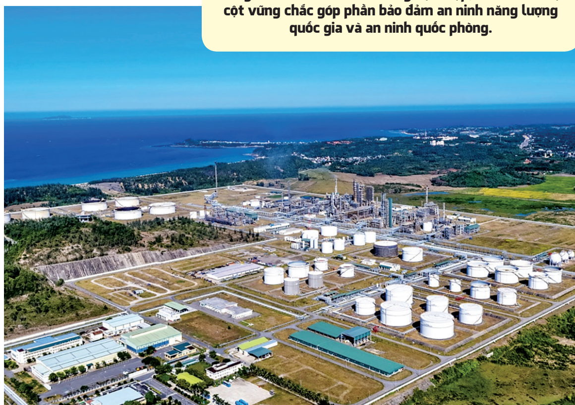
Nhà máy Lọc dầu Dung Quất được coi là mảnh ghép hoàn thiện khâu sau của ngành công nghiệp dầu khí Việt Nam

NMLD Dung Quất không chỉ hiện thực hóa giấc mơ lọc hóa dầu của người Việt, mà còn cung cấp nhiên liệu đặc chủng phục vụ quân đội, khẳng định bản lĩnh tự lực, tự cường của dân tộc. Với khát vọng vươn xa và chiến lược phát triển bền vững, BSR sẽ tiếp tục đồng hành cùng đất nước trên con đường hội nhập, trở thành trụ cột vững chắc góp phần bảo đảm an ninh năng lượng quốc gia và an ninh quốc phòng.