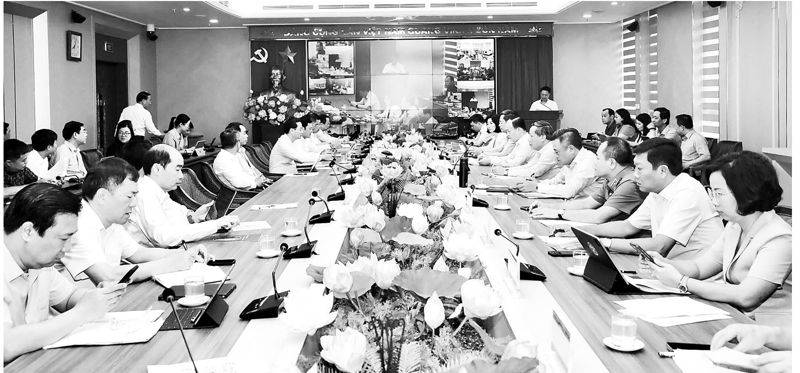
Quang cảnh hội nghị tại điểm cầu Thành ủy Hà Nội