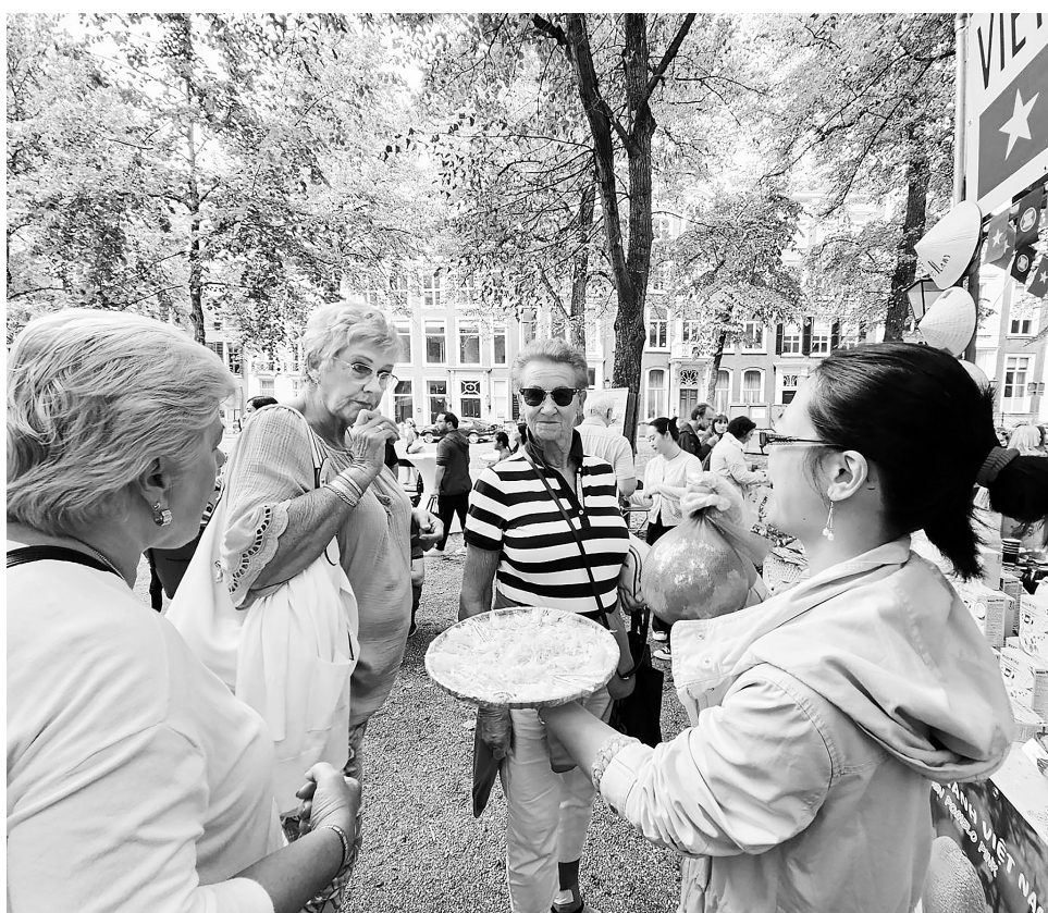
Quảng bá ẩm thực Việt đến người tiêu dùng Hà Lan

đơn giản hơn, giúp cà phê, hạt điều, dệt may và giày dép Việt Nam tăng lợi thế cạnh tranh tại Hà Lan. Đồng thời, nhu cầu tiêu dùng tại EU phục hồi, làm phát được kiểm soát, tạo điều kiện thuận lợi cho hàng Việt thâm nhập sâu hơn nữa vào thị trường Hà Lan.