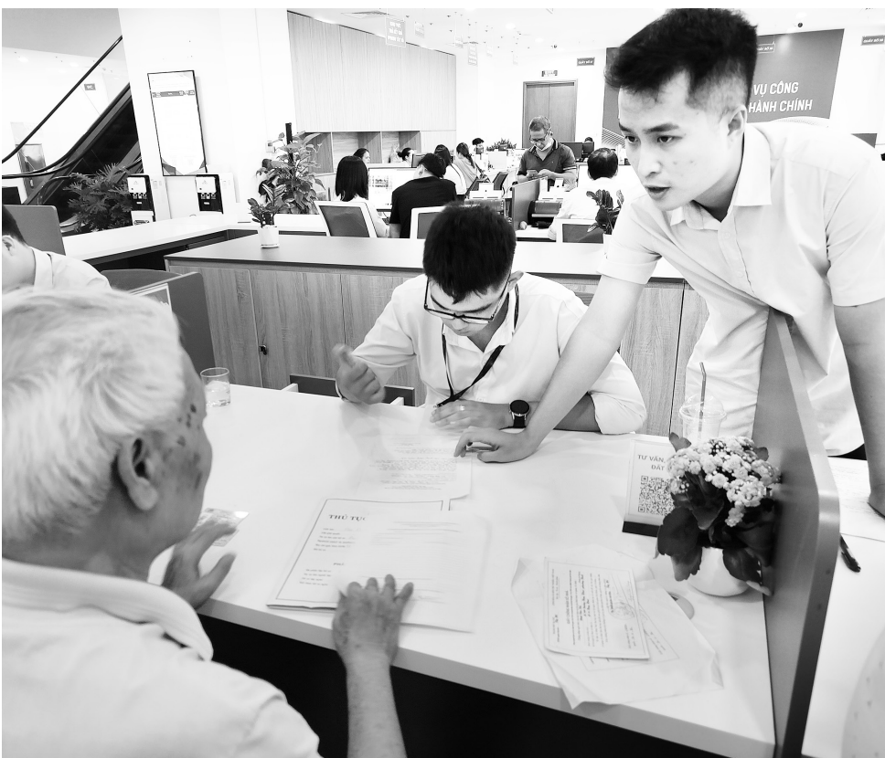
Cán bộ Trung tâm Phục vụ hành chính công TP. Hà Nội hướng dẫn người dân thực hiện thủ tục hành chính