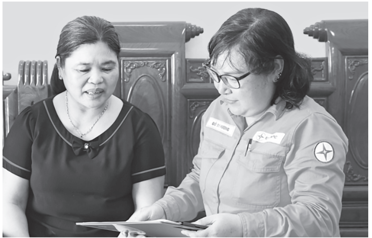
Hướng dẫn người dân sử dụng điện tiết kiệm, hiệu quả

Theo nhiều chuyên gia, áp dụng cơ chế bù chéo như hiện nay đã tạo ra sự bất cập. Thứ nhất, giá điện không phản ánh đúng chi phí thực. Điều này làm méo mó thị trường điện, ảnh hưởng tới không chỉ ngành điện mà còn