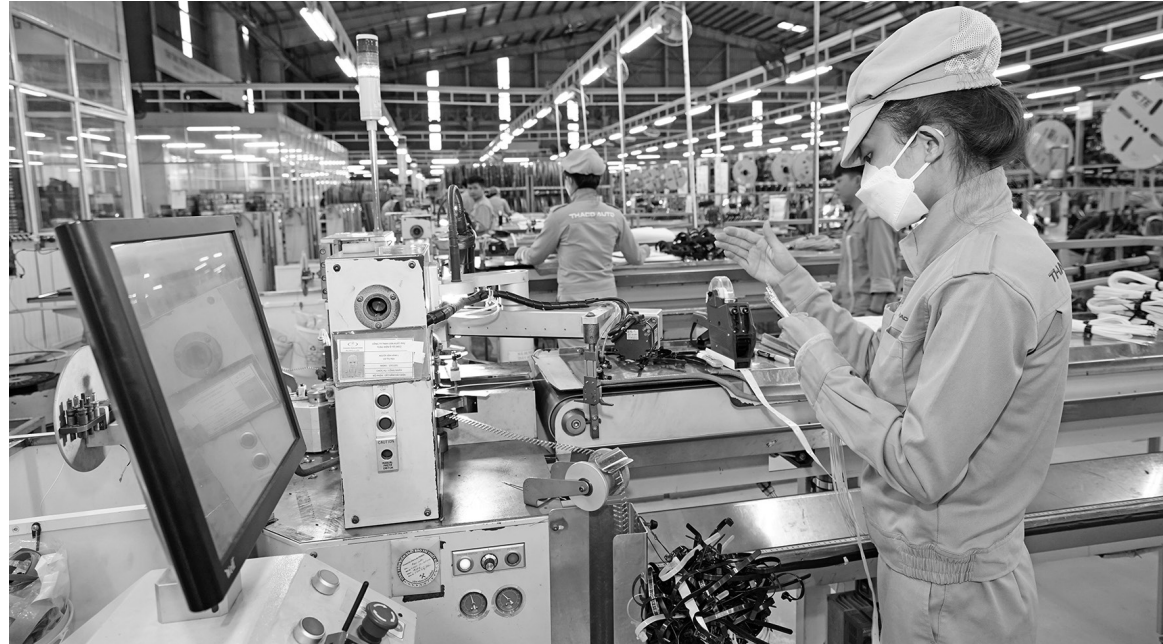
Ngành Công Thương tập trung nghiên cứu, triển khai các công nghệ chiến lược