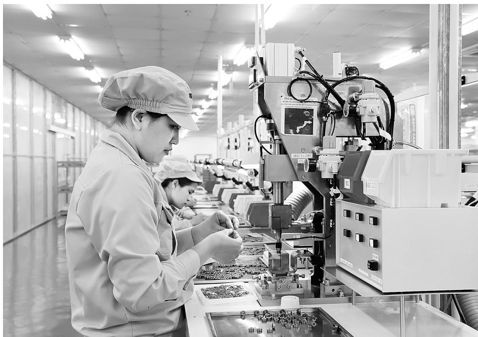
Nhiều doanh nghiệp châu Âu đã đầu tư thành công tại Việt Nam