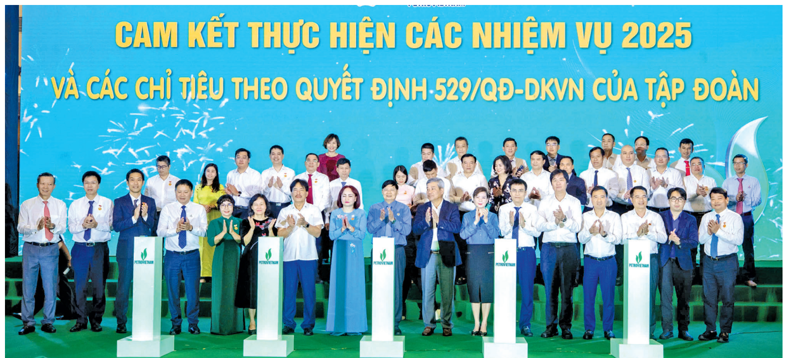
Lễ ký cam kết hoàn thành chỉ tiêu chương trình "Đổi mới sáng tạo dầu khí" năm 2025

Chặng đường phía trước còn nhiều thử thách, nhưng với nền tảng truyền thống thi đua yêu nước, tinh thần đổi mới sáng tạo đã trở thành văn hóa, Petrovietnam sẽ tiếp tục vững bước, góp phần xây dựng một Việt Nam hùng cường, hiện đại, đúng như mong ước của Chủ tịch Hồ Chí Minh năm xưa.