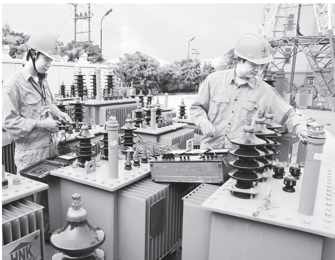
Hiện nay, biểu giá bán lẻ điện đang áp dụng cho nhiều nhóm khách hàng khác nhau

Bên cạnh đó, cấu thành giá điện cần được tính toán, cập nhật chính xác thường xuyên và phải công khai minh bạch. Tiếp tục đầu tư nâng cấp hệ thống điện, giảm tổn thất điện năng để giảm chi phí. Hạ tầng thị trường bán lẻ điện cạnh tranh cần phải hoàn thiện. ■