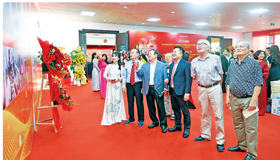
Nguyễn lãnh đạo Báo Công Thương qua các thời kỳ tham quan không gian trưng bày những dấu mốc phát triển của Báo Công Thương