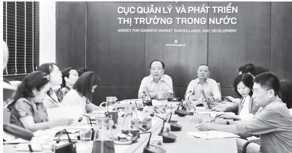
Hội nghị tập huấn quy mô lớn đã diễn ra theo hình thức trực tiếp kết hợp trực tuyến

kinh doanh khí, thuốc lá, rượu, xăng dầu, phát triển hệ thống chợ và các nghiệp vụ quản lý thị trường. Việc vận hành hệ thống INS, phối hợp liên ngành hay ứng dụng công nghệ giám sát cũng được đưa vào hướng dẫn, nhằm tạo tính minh bạch và kịp thời.