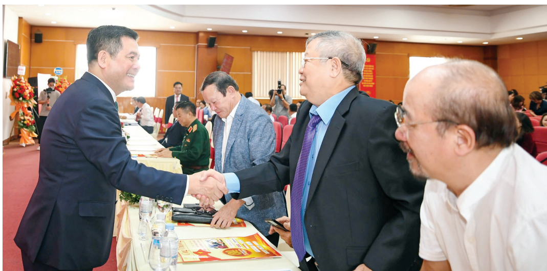
Bộ trưởng Nguyễn Hồng Diên và nguyên lãnh đạo Báo Công Thương qua các thời kỳ tham dự Lễ kỷ niệm