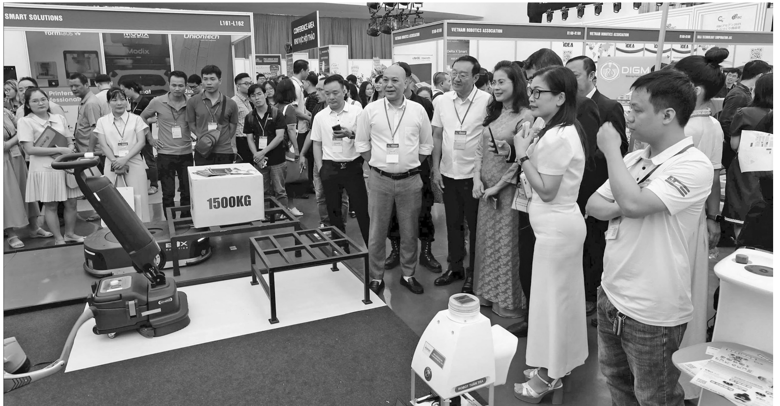
Các đại biểu tham quan tại Hội chợ triển lãm công nghiệp hỗ trợ Hà Nội năm 2025

Tuy vậy, so với nhu cầu thực tế của các doanh nghiệp FDI, số lượng doanh nghiệp CNHT đáp ứng đủ tiêu chuẩn về chất lượng, công nghệ và quản trị vẫn còn hạn chế. Theo khảo sát, tỷ lệ nội địa hóa trong lĩnh vực