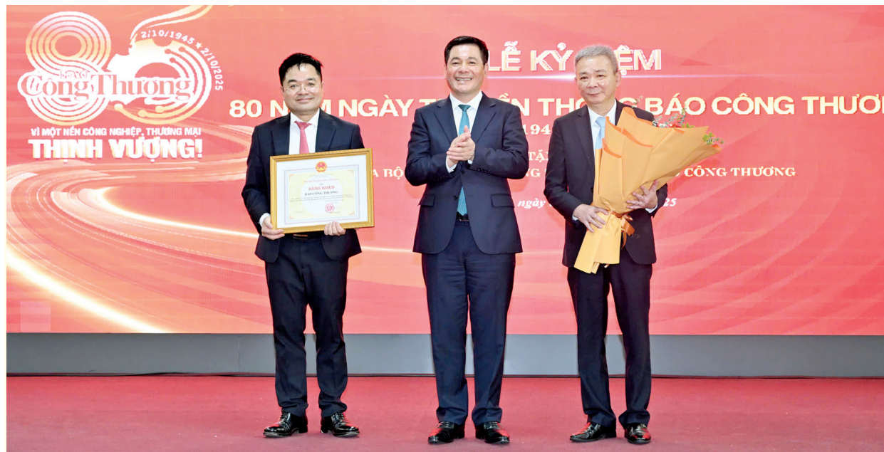
Bộ trưởng Nguyễn Hồng Diên trao tặng bằng khen của Bộ Công Thương cho Báo Công Thương

• Ngày 2/10, tại trụ sở Bộ Công Thương, Báo Công Thương long trọng tổ chức Lễ kỷ niệm 80 năm Ngày truyền thống (2/10/1945 - 2/10/2025) và trao giải Cuộc thi tìm hiểu truyền thống ngành Công Thương. Đồng chí Nguyễn Hồng Diên, Bí thư Đảng ủy, Bộ trưởng Bộ Công Thương dự và chỉ đạo hội nghị.