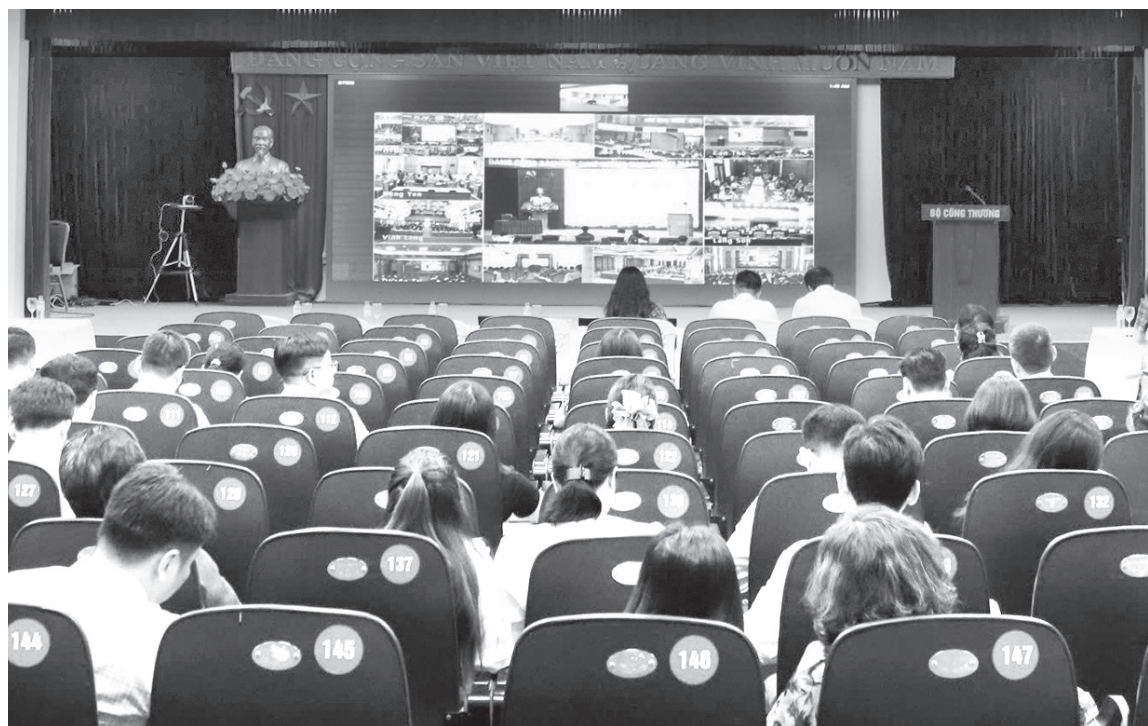
Việc trang bị cho cán bộ khả năng làm chủ công nghệ AI có ý nghĩa quan trọng

Đối với ngành Công Thương, lĩnh vực gắn liền với quản lý thị trường, hội nhập kinh tế quốc tế, điều tiết năng lượng và phát triển công nghiệp, việc trang bị cho cán