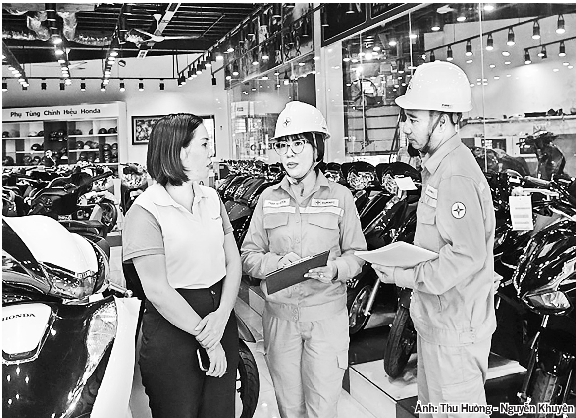
Công nhân điện lực Quảng Ninh tuyên truyền doanh nghiệp sử dụng điện an toàn, tiết kiệm và hiệu quả.

Ngày 20/8/2028, Bộ Chính trị ban hành Nghị quyết số 70-NQ/TW về bảo đảm an ninh năng lượng quốc gia đến năm 2030, tầm nhìn 2045. Nghị quyết mang ý nghĩa chiến lược, trong đó nhấn mạnh sử dụng năng lượng tiết kiệm, hiệu quả và giảm phát thải khí nhà kính là nhiệm vụ then chốt.