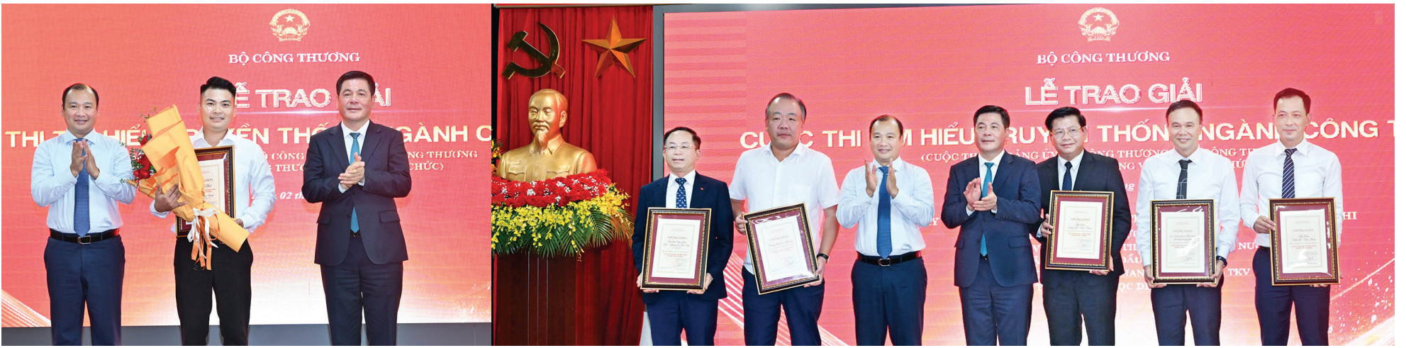
Bộ trưởng Bộ Công Thương Nguyễn Hồng Diên và Thứ trưởng Thường trực Bộ Văn hóa, Thể thao và Du lịch Lê Hải Bình trao giải Cuộc thi tìm hiểu truyền thống ngành Công Thương