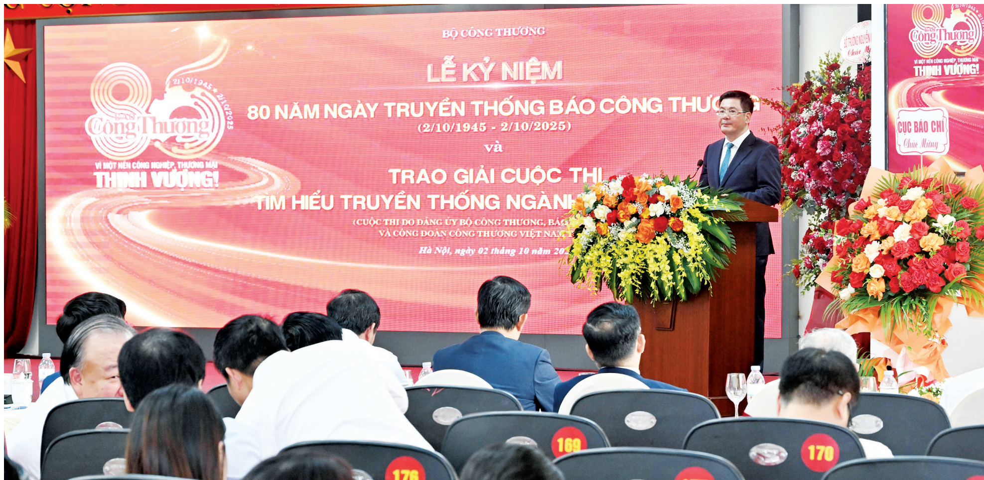
Bộ trưởng Nguyễn Hồng Diên phát biểu tại Lễ kỷ niệm