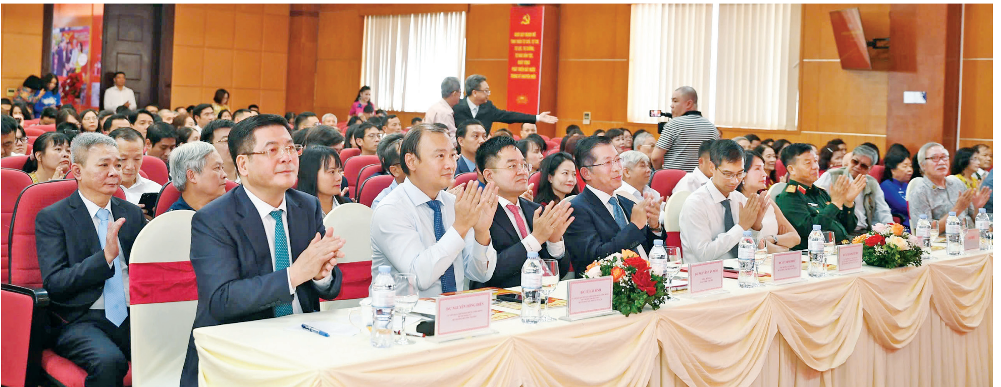
Dự Lễ kỷ niệm còn có các chuyên gia, lãnh đạo cơ quan báo chí cùng đông đảo doanh nghiệp đã gắn bó và đồng hành với Báo Công Thương trong suốt chặng đường phát triển