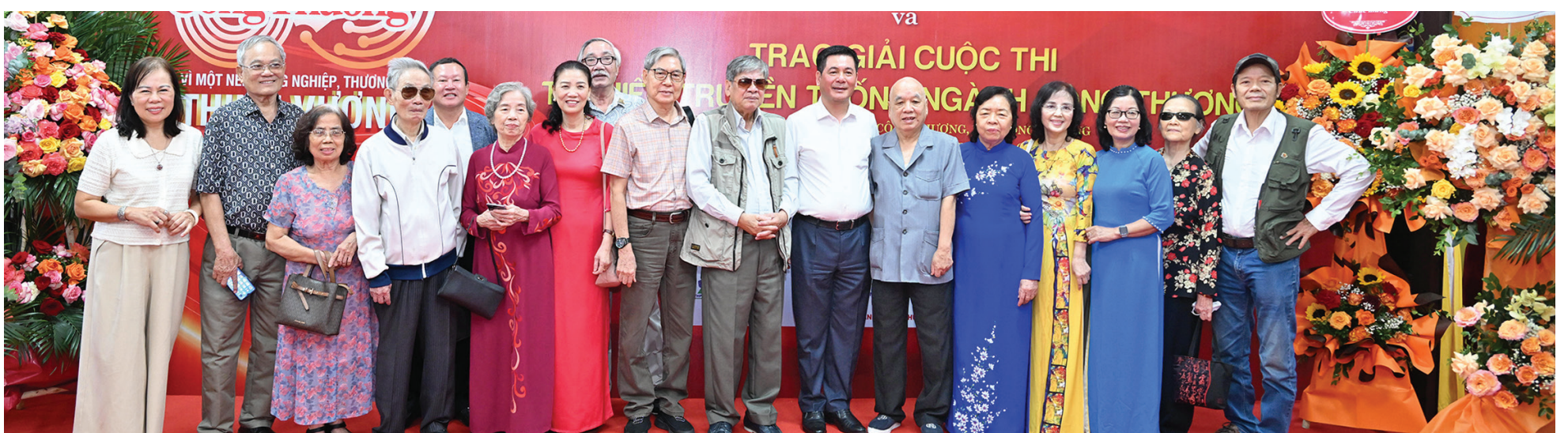
Bộ trưởng Nguyễn Hồng Diên chụp ảnh lưu niệm cùng các nguyên lãnh đạo, nguyên cán bộ Báo Công Thương qua các thời kỳ