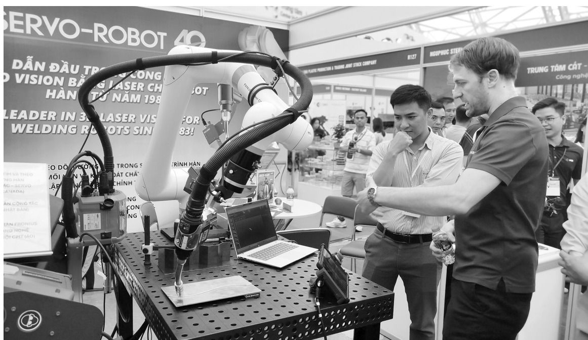
Hà Nội ban hành nhiều chính sách thúc đẩy công nghiệp hỗ trợ phát triển

CNHT phải gắn với xu thế chuyển đổi xanh và chuyển đổi số. Những sản phẩm CNHT đáp ứng tiêu chí tiết kiệm năng lượng, thân thiện môi trường, ứng dụng công nghệ số trong sản xuất, quản lý sẽ có lợi thế lớn trong việc tham gia chuỗi cung ứng toàn cầu.