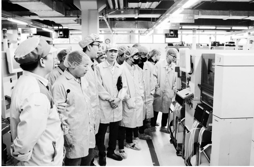
Ngành công nghiệp hỗ trợ trong nước năm nay được nhận định là ổn định, với nhu cầu tiêu thụ tăng

Chỉ số nhà quản trị mua hàng (PMI) tháng 9 đạt 50,4 điểm, phản ánh xu hướng tăng trưởng nhẹ của sản xuất công nghiệp. Các doanh nghiệp trong nước duy trì sản xuất ổn định, tập trung đáp ứng nhu cầu nội địa và điều chỉnh lao động phù hợp với thực tế đơn hàng.