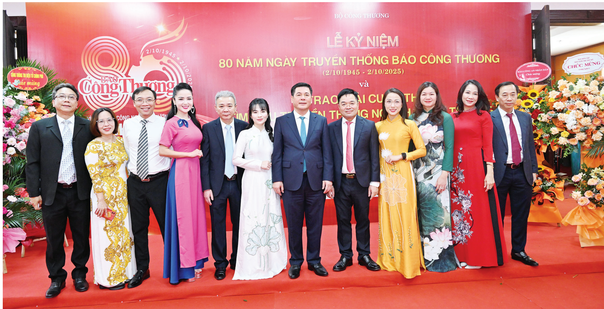
Bộ trưởng Nguyễn Hồng Diên chụp ảnh cùng lãnh đạo và phóng viên Báo Công Thương