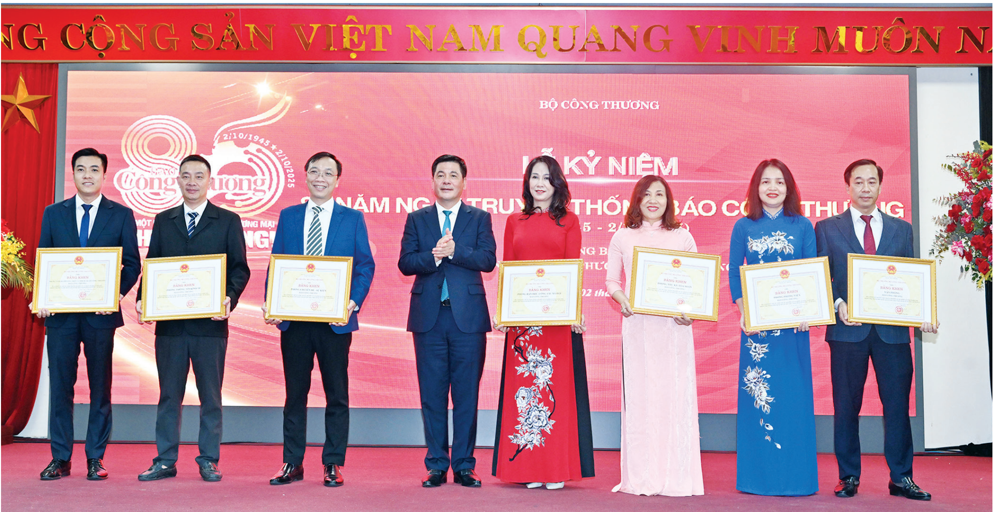
Bộ trưởng Nguyễn Hồng Diên trao tặng bằng khen của Bộ Công Thương cho các tập thể của Báo Công Thương