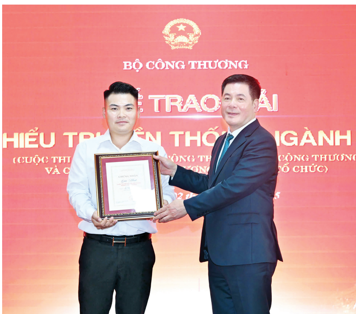
Bộ trưởng Bộ Công Thương Nguyễn Hồng Diên trao giải Cuộc thi tìm hiểu truyền thống ngành Công Thương

sắc các quan điểm, chủ trương của Đảng, chính sách pháp luật của Nhà nước... Đặc biệt là phải thực hiện đúng tôn chỉ mục đích, bám sát định hướng thông tin tuyên truyền; phối hợp chặt chẽ, hiệu quả với các đơn vị trong Bộ và các cơ quan báo chí, truyền thông ngoài ngành để tuyên truyền đúng - trúng - sâu, tạo đồng thuận cao trong xã hội.