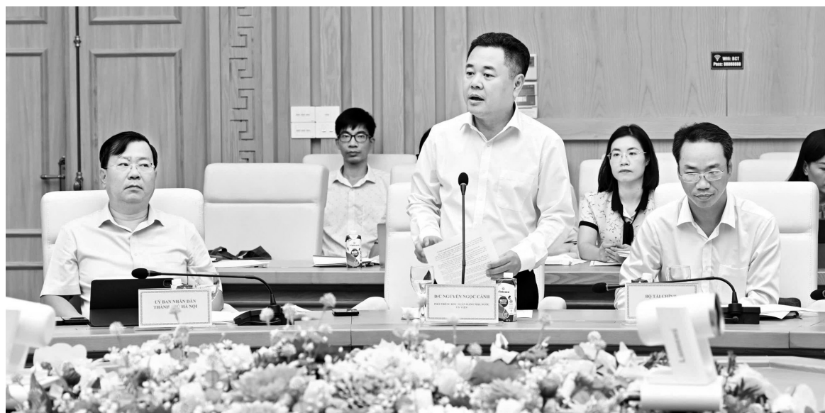
Các đại biểu phát biểu tại phiên họp

Thứ nhất, tổ chức triển khai đồng bộ, bảo đảm tiến độ, chất lượng các nhiệm vụ được giao tại Nghị quyết số 153/NQ-CP ban hành Chương trình hành động của Chính phủ thực hiện Nghị quyết 59-NQ/TW của Bộ Chính trị về hội nhập quốc tế trong tình hình mới.