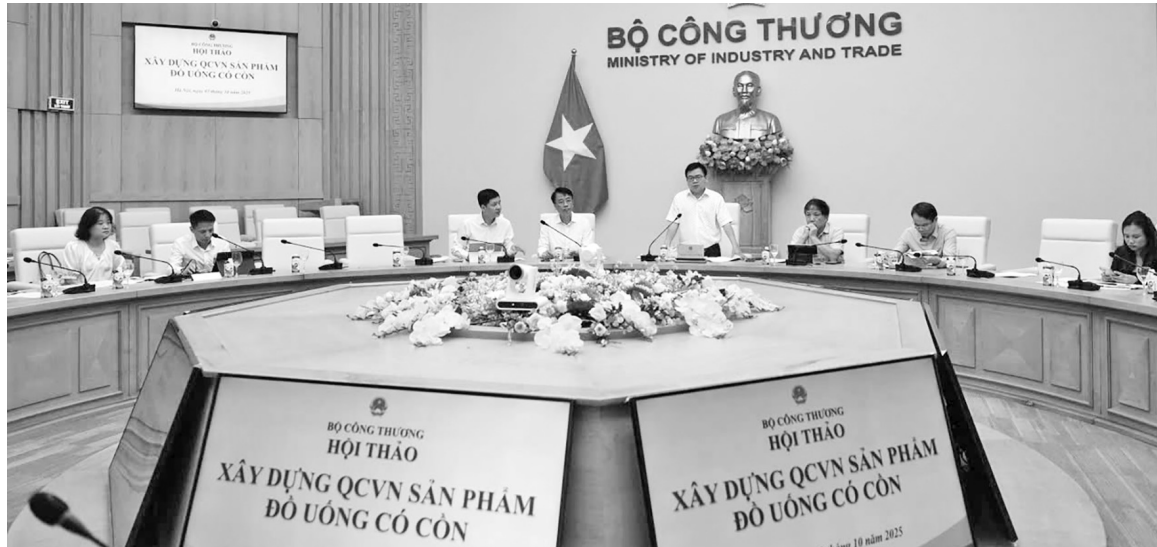
Toàn cảnh Hội thảo xây dựng quy chuẩn kỹ thuật quốc gia đối với sản phẩm đồ uống có cồn

Hiện nay, các quy định pháp luật của Việt Nam để quản lý chất lượng hàng hóa (các tiêu chuẩn, quy chuẩn, quy định về an toàn thực phẩm...) và các quy định pháp luật liên quan khác đã có nhiều thay đổi, cập nhật. Vì vậy, dựa trên chức năng, nhiệm vụ, Bộ Công Thương sẽ xây dựng, cập nhật, bổ sung các quy định để hướng tới việc ban hành mới Quy chuẩn kỹ thuật quốc gia về sản phẩm đồ uống có cồn.