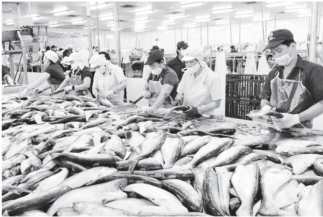
Xuất khẩu thủy sản năm 2025 dự kiến thu về 10 tỷ USD

Với mức tăng 15,5% sau 9 tháng, ngành thủy sản lạc quan hướng đến mục tiêu 10 tỷ USD năm 2025. Bộ Công Thương tiếp tục đóng vai trò quan trọng, hỗ trợ doanh nghiệp vượt rào cản, củng cố vị thế tại thị trường quốc tế.