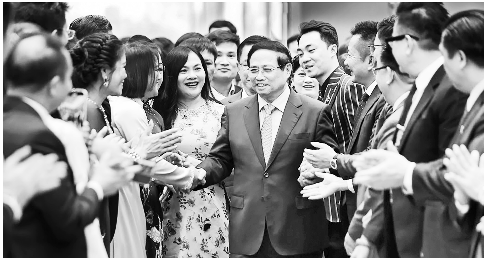
Thủ tướng Phạm Minh Chính với các doanh nhân tại hội nghị