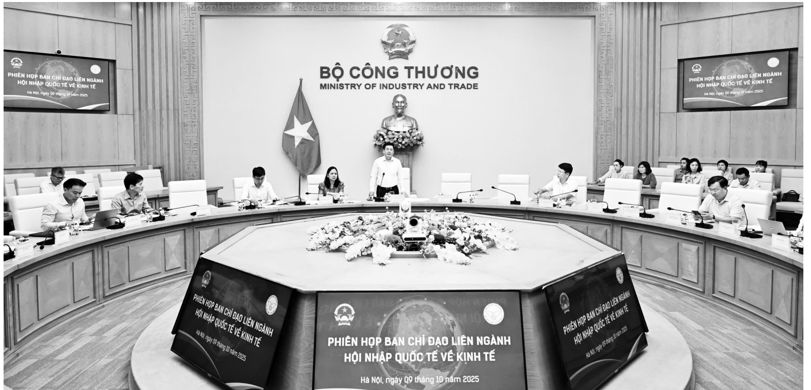
Toàn cảnh phiên họp