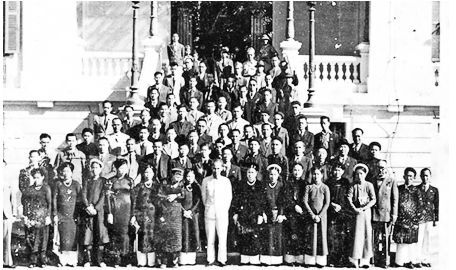
Chủ tịch Hồ Chí Minh gặp gỡ giới Công Thương Hà Nội tại Bắc Bộ phủ năm 1945

Trong công cuộc đổi mới, hội nhập quốc tế, doanh nghiệp Việt Nam đã trở thành lực lượng chủ lực trong sản xuất, xuất khẩu,