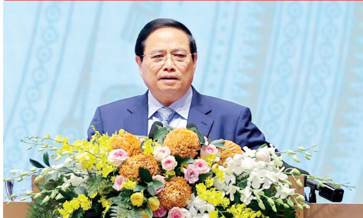
Thủ tướng Phạm Minh Chính phát biểu tại hội nghị