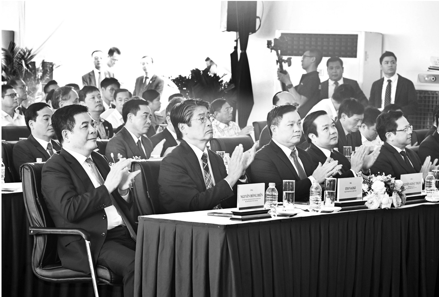
Bộ trưởng Bộ Công Thương Nguyễn Hồng Diên và lãnh đạo một số địa phương, đơn vị dự Lễ khởi công dự án Nhà máy Nhiệt điện LNG Thái Bình