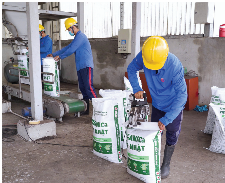
Phân bón hữu cơ Organica Việt Nhật sở hữu nhiều đặc tính vượt trội, giàu chất dinh dưỡng bổ sung cho cây trồng và cải tạo đất tơi xốp

Trong bối cảnh nông nghiệp Việt Nam đang đứng trước nhiều thách thức về chất lượng đất, an toàn thực phẩm