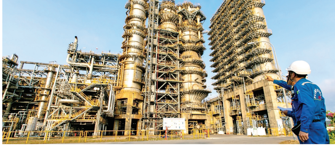
Từ định hướng của Ban lãnh đạo, người lao động BSR luôn quan tâm đến việc áp dụng khoa học - công nghệ vào thực tế công việc