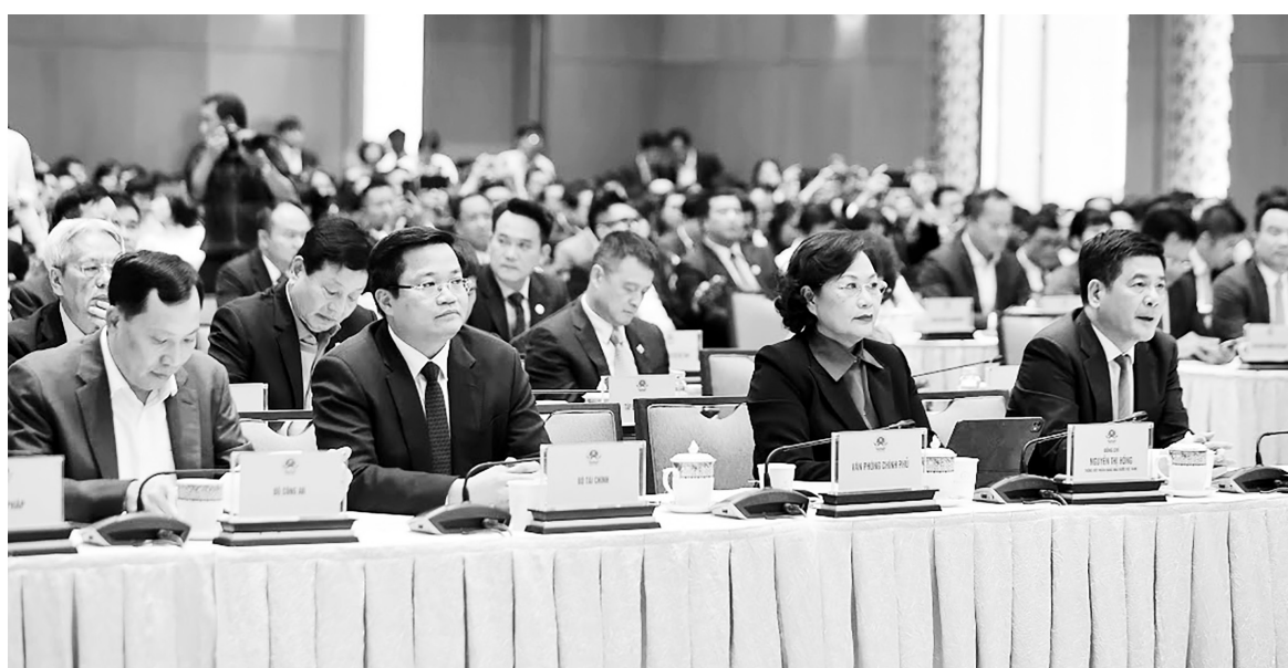
Đại diện lãnh đạo các bộ, ngành tham dự hội nghị

Tại hội nghị, Thủ tướng Chính phủ Phạm Minh Chính cùng các Phó Thủ tướng Chính phủ trao phần thưởng cao quý của Đảng, Nhà nước, Chính phủ, Thủ tướng Chính phủ tặng doanh nhân, doanh nghiệp tiêu biểu, có thành tích xuất sắc.