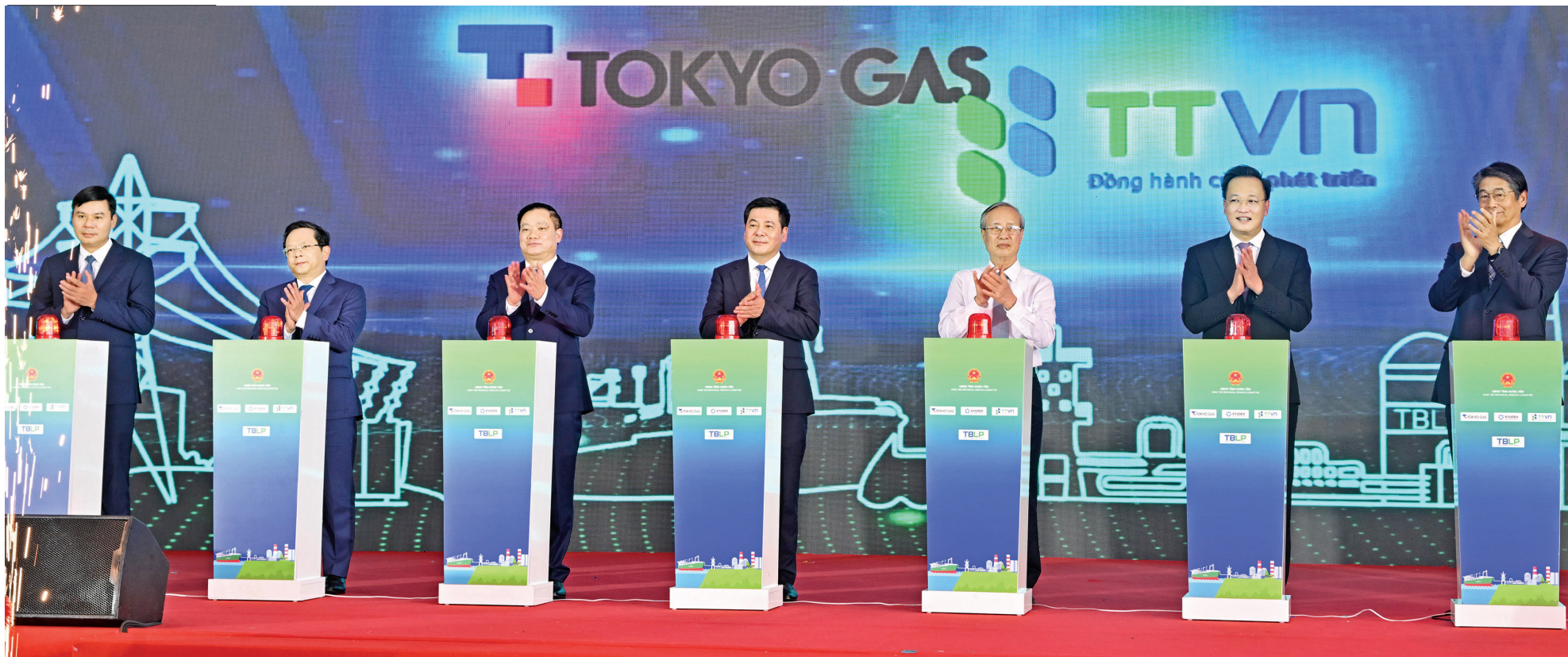
Các đại biểu nhấn nút chính thức khởi công dự án Nhà máy nhiệt điện LNG Thái Bình