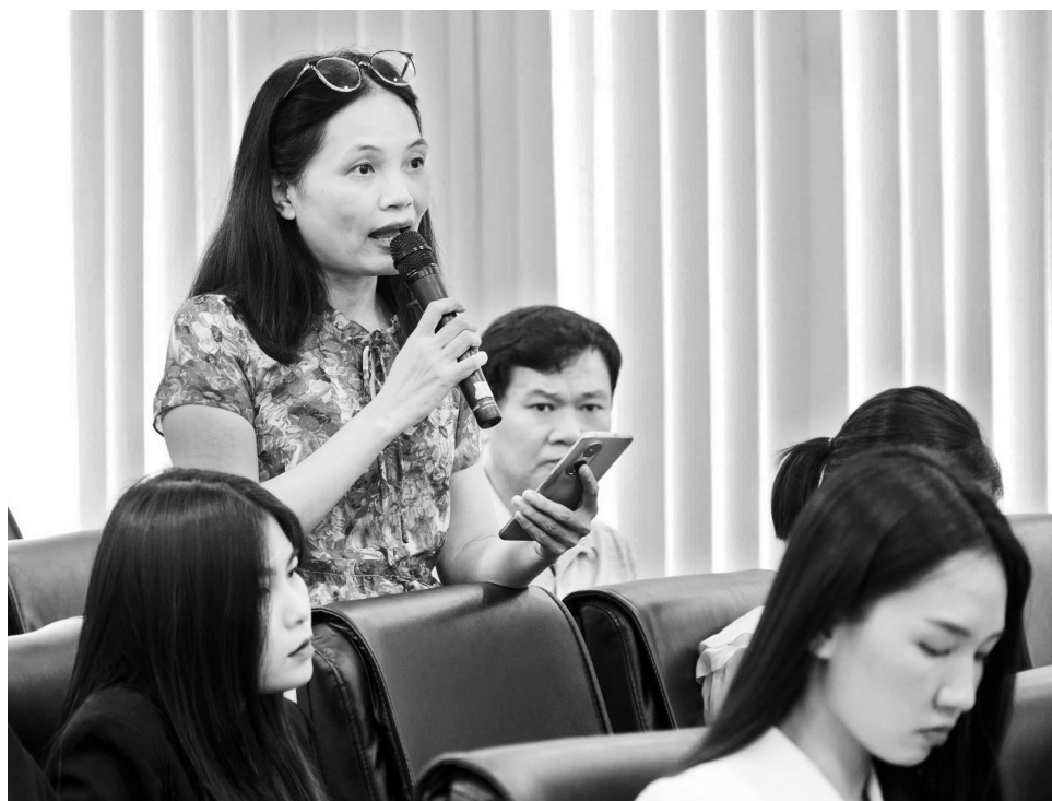
Phóng viên các cơ quan báo chí đặt câu hỏi

nền kinh tế. Với tình hình hiện nay, nếu không có biến động bất thường, ngành Công Thương đang đi đúng hướng để đạt các mục tiêu đề ra trong năm 2025 và dự kiến tổng kim ngạch xuất nhập khẩu hàng hóa của cả năm có thể đạt mốc mới khoảng 900 tỷ USD.