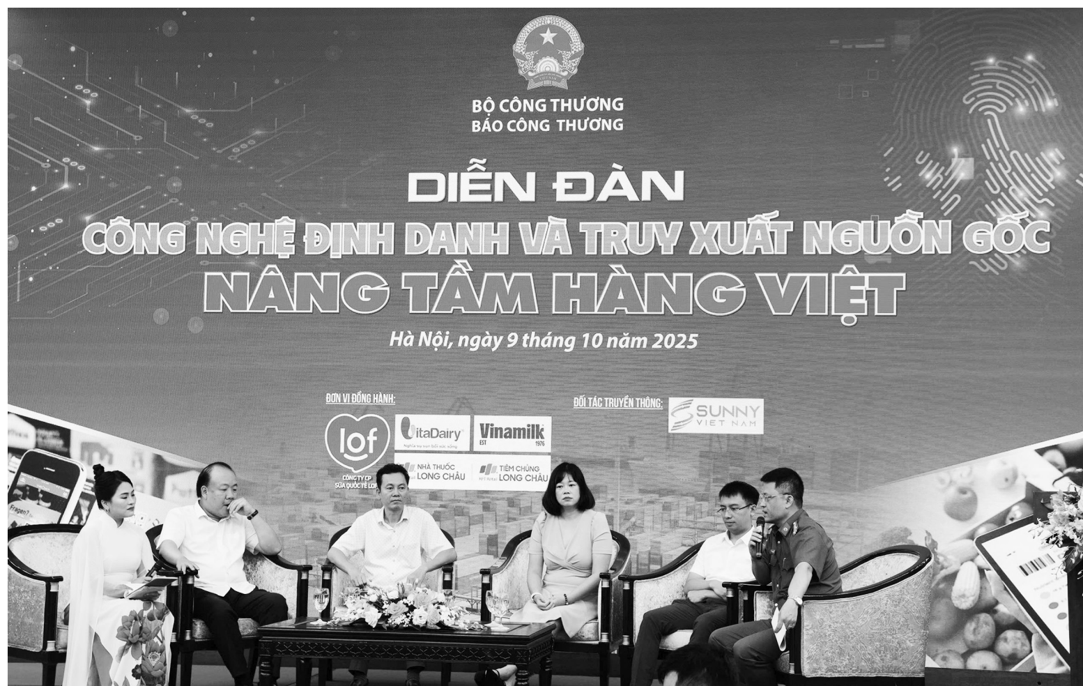
Các diễn giả tham gia phiên tọa đàm trong khuôn khổ diễn đàn

Để đảm bảo truy xuất nguồn gốc trong bối cảnh minh bạch hóa thị trường là tất yếu, doanh nghiệp cần kê khai minh bạch, chính xác, sẵn sàng cho việc xác minh hồ sơ và kiểm tra thực tế.