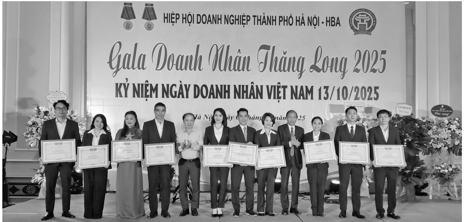
Lãnh đạo TP. Hà Nội đánh giá cao những thành tích khởi nghiệp trên địa bàn đạt được thời gian qua

Ngay sau khi các nghị quyết mới ban hành, HBA đã nhanh chóng triển khai phổ biến tới doanh nghiệp hội viên thông qua chương trình “Bữa sáng doanh nhân” diễn ra vào sáng