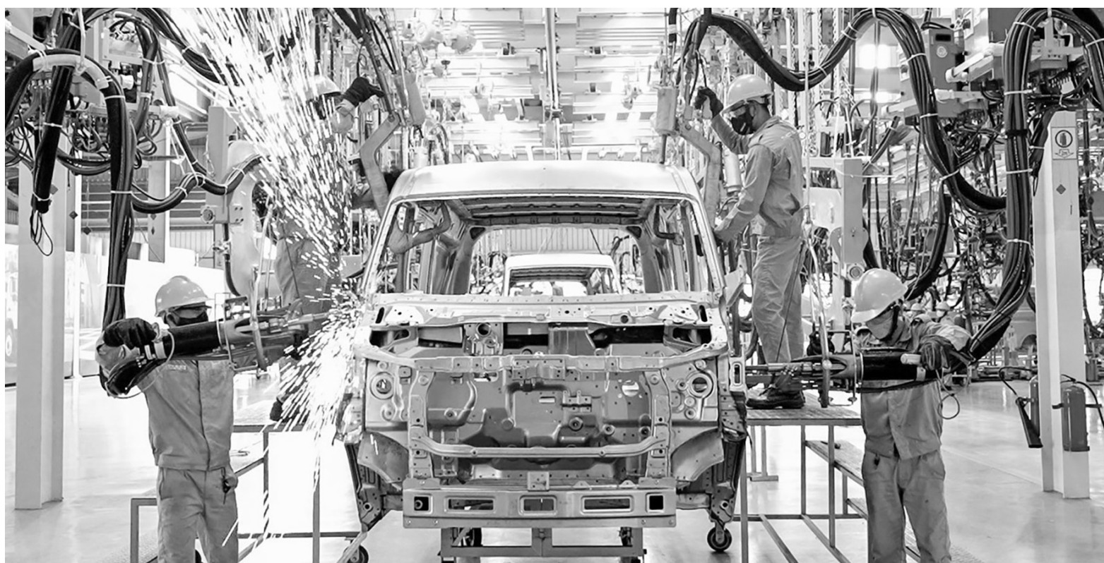
Phát triển công nghiệp hỗ trợ - con đường tự cường của sản xuất Việt Nam