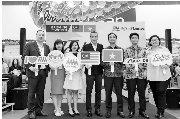
Malaysia hoạt động xúc tiến thương mại tại Việt Nam

Đặc biệt, RCEP được xem là "chìa khóa" mở ra cơ hội tăng trưởng mới cho thương mại Việt Nam - Malaysia, khi FTA này giúp hài hòa quy tắc xuất xứ, đơn giản hóa thủ tục và giảm đáng kể các hàng rào kỹ thuật. Các ngành hàng xuất khẩu thế mạnh của Việt Nam như nông sản, thực phẩm chế biến, điện tử, sắt, thép và cao su đều đang có nhiều dư địa phát triển tại thị trường Malaysia.