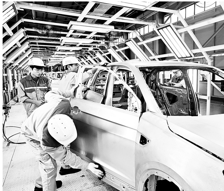
Sản xuất công nghiệp 10 tháng giữ nhịp tăng trưởng, tạo nền tảng cho phục hồi kinh tế và tăng trưởng trong những tháng cuối năm 2025

số chuyên gia kinh tế cho rằng, từ đầu quý IV và đặc biệt là trong tháng 10/2025, sản xuất công nghiệp cả nước tiếp tục cho thấy sự phục hồi tích cực.