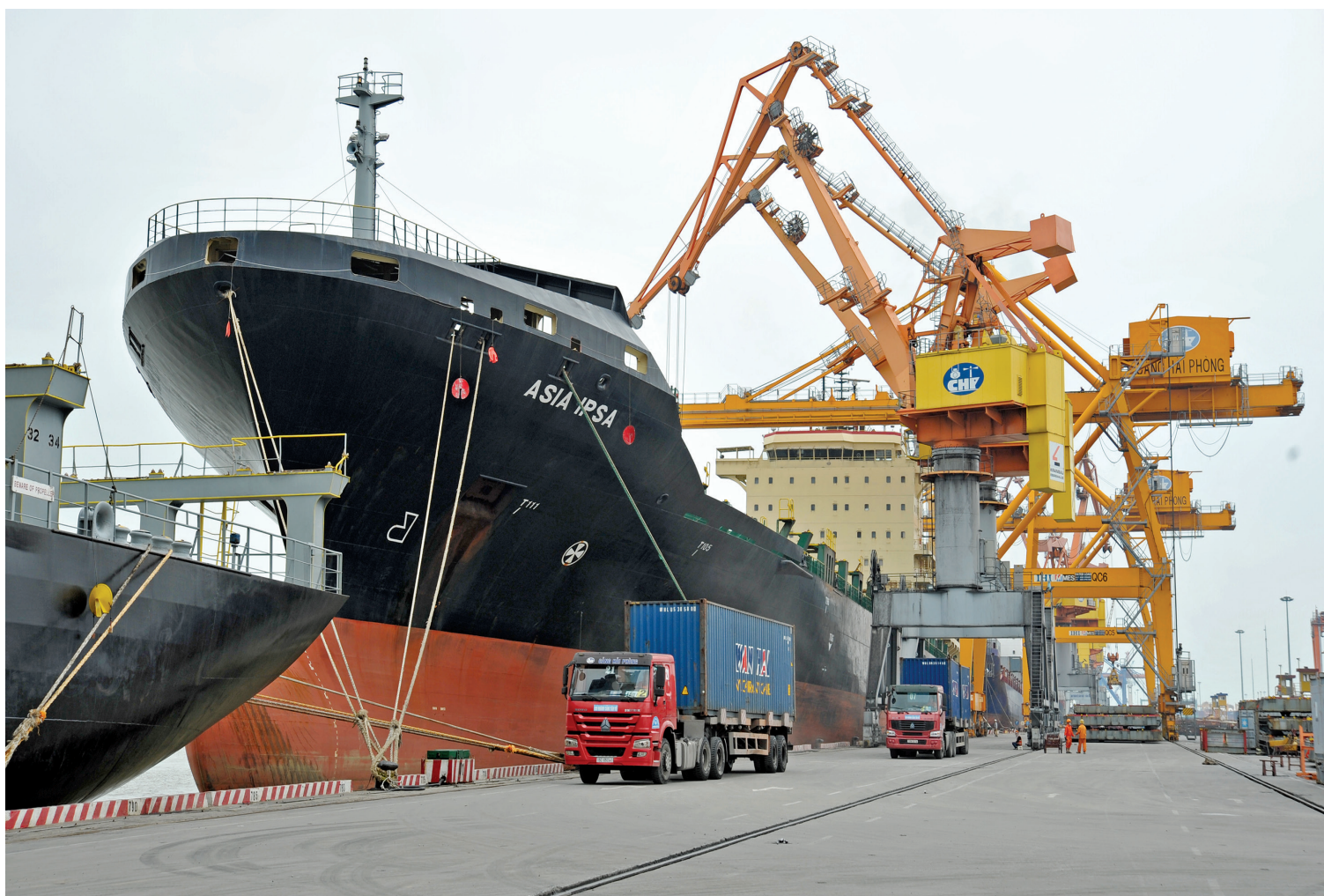
Xuất nhập khẩu tiếp tục là điểm sáng trong bức tranh kinh tế 10 tháng năm 2025

Từ hàng điện tử, dệt may đến nông sản, Việt Nam đang khẳng định vị thế trong chuỗi cung ứng toàn cầu. 10 tháng đầu năm 2025, kim ngạch xuất nhập khẩu tăng hơn 17%, mở ra kỳ vọng tăng trưởng bứt phá và cán mốc kỷ lục mới trong năm nay. Trang 3