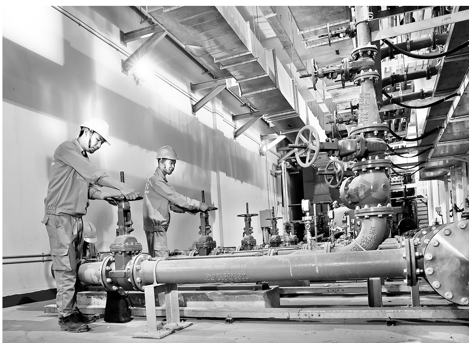
Việt Nam cần tiếp tục xây dựng, hoàn thiện hệ thống chính sách hỗ trợ phát triển công nghiệp môi trường Ảnh minh họa

Hai là , thúc đẩy phát triển kinh tế tuần hoàn và tái chế tài nguyên. Thủ tướng Chính phủ đã ký Quyết định số 687/QĐ-TTg ngày 7/6/2022 phê duyệt Đề án phát triển kinh tế tuần hoàn, trong đó ngành công nghiệp