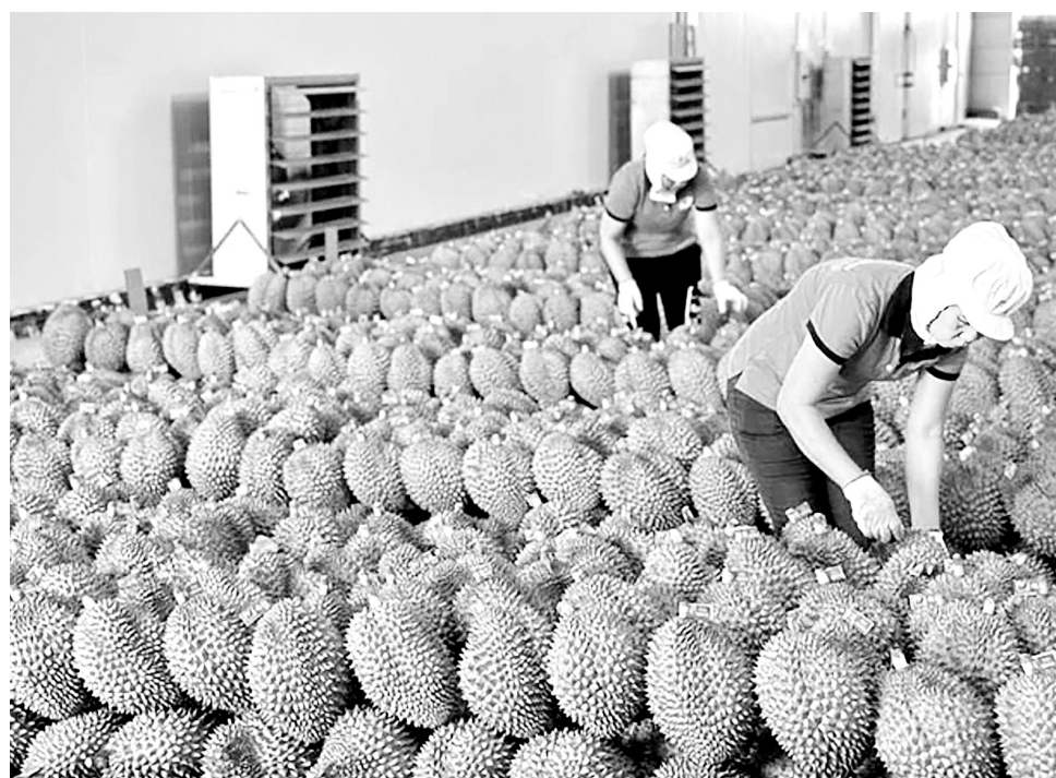
Giá trị xuất khẩu rau quả tháng 10/2025 ước đạt 961 triệu USD