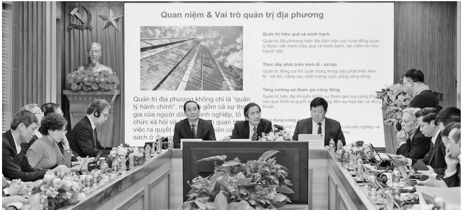
Toàn cảnh diễn đàn