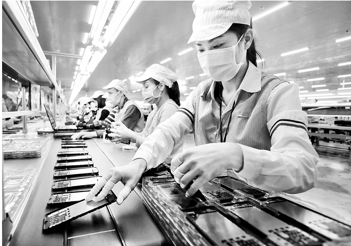
Xuất khẩu điện tử là điểm sáng trong bức tranh kinh tế 10 tháng qua

Để giúp hàng hóa Việt Nam được hưởng ưu đãi thuế quan