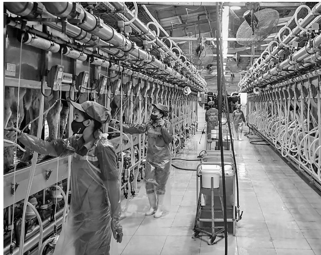
Ứng dụng công nghệ tiên tiến giúp doanh nghiệp đáp ứng các tiêu chuẩn quốc tế, mở rộng thị trường