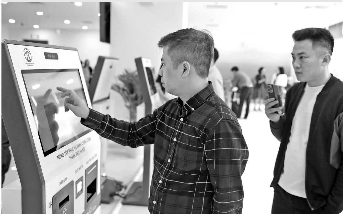
Hà Nội đẩy mạnh ứng dụng công nghệ trong vận hành mô hình chính quyền địa phương 2 cấp

Các chuyên gia nhận định, xây dựng mô hình chính quyền địa phương 2 cấp ở Hà Nội không chỉ là cải cách hành chính, mà là cuộc đổi mới tư duy toàn diện. Hà Nội cần tiên phong thử nghiệm các mô hình quản trị thông minh, lấy người dân làm trung tâm, thúc đẩy sự tham gia của cộng đồng vào hoạt động quản lý đô thị.