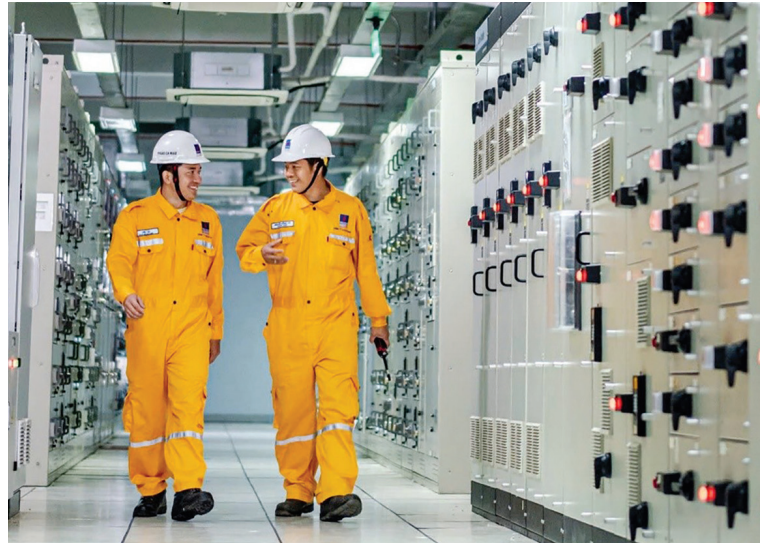
PV GAS đang chuyển dịch thành công, giảm phụ thuộc vào các động lực tăng trưởng truyền thống

Trong lĩnh vực chuyển đổi số và tự động hóa, PV GAS đang triển khai giai đoạn 1 Dự án Nhà máy thông minh tại Nhà máy Xử lý khí Cà Mau (GPP Cà Mau), đồng thời mở rộng mô hình quản trị thông minh sang cụm kho cảng Thị Vải, hướng đến tiêu chuẩn quản lý, vận hành, logistics theo chuẩn