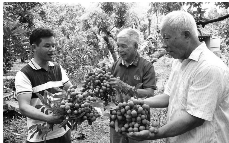
Nông dân thu hoạch nhân tại Hợp tác xã nhân lồng Nê Châu, tỉnh Hưng Yên

Các thị trường nhập khẩu khác trong khối RCEP như Nhật Bản, Hàn Quốc và Australia cũng áp dụng cơ chế tương tự. Doanh nghiệp xuất khẩu bắt buộc cung cấp thông tin truy xuất nguồn gốc rõ ràng, đảm bảo các tiêu chuẩn an toàn dịch bệnh và chứng nhận sản xuất sạch.