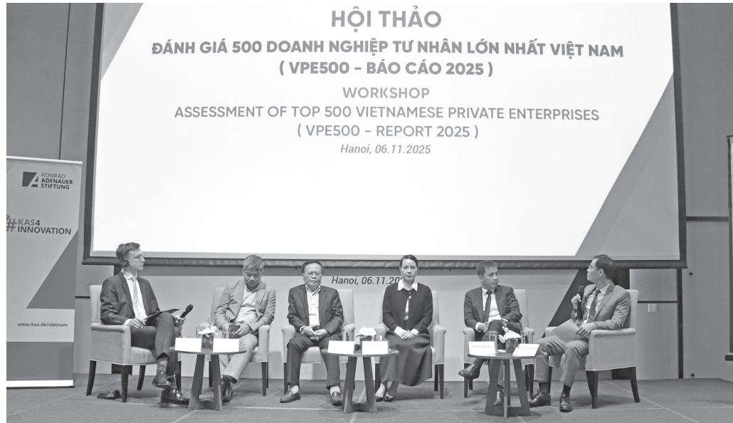
Hội thảo "Đánh giá 500 doanh nghiệp tư nhân lớn nhất Việt Nam" do Bộ Tài chính tổ chức.