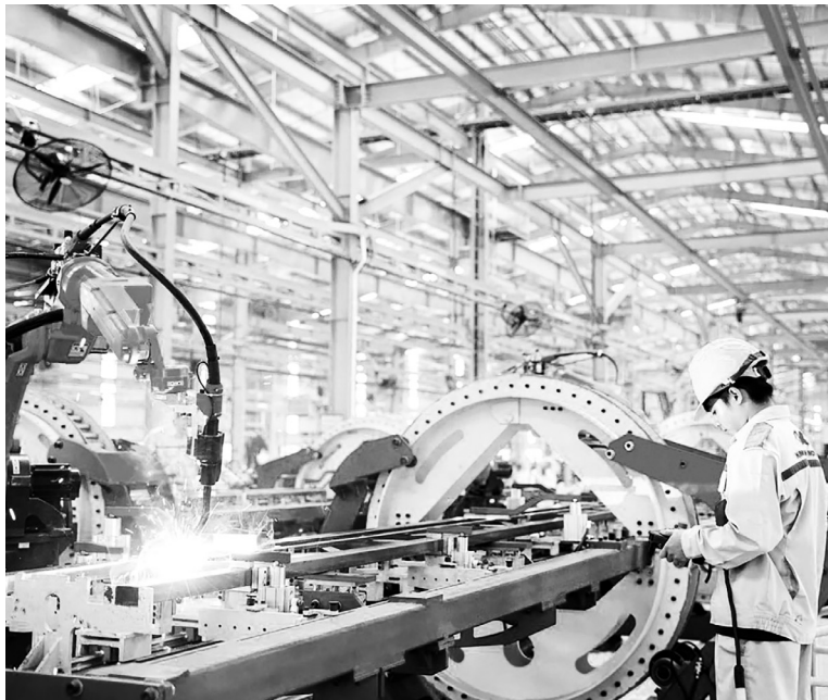
Chiến lược công nghiệp trong dự thảo báo cáo chính trị lần này thể hiện tầm nhìn đúng đắn về xu thế và yêu cầu chuyển đổi mô hình tăng trưởng

Bảy là, về xây dựng Đảng, nhiều ý kiến nhấn mạnh cần tập trung hơn nữa vào công tác cán bộ; phát huy vai trò nêu gương của đảng viên, nhất là người đứng