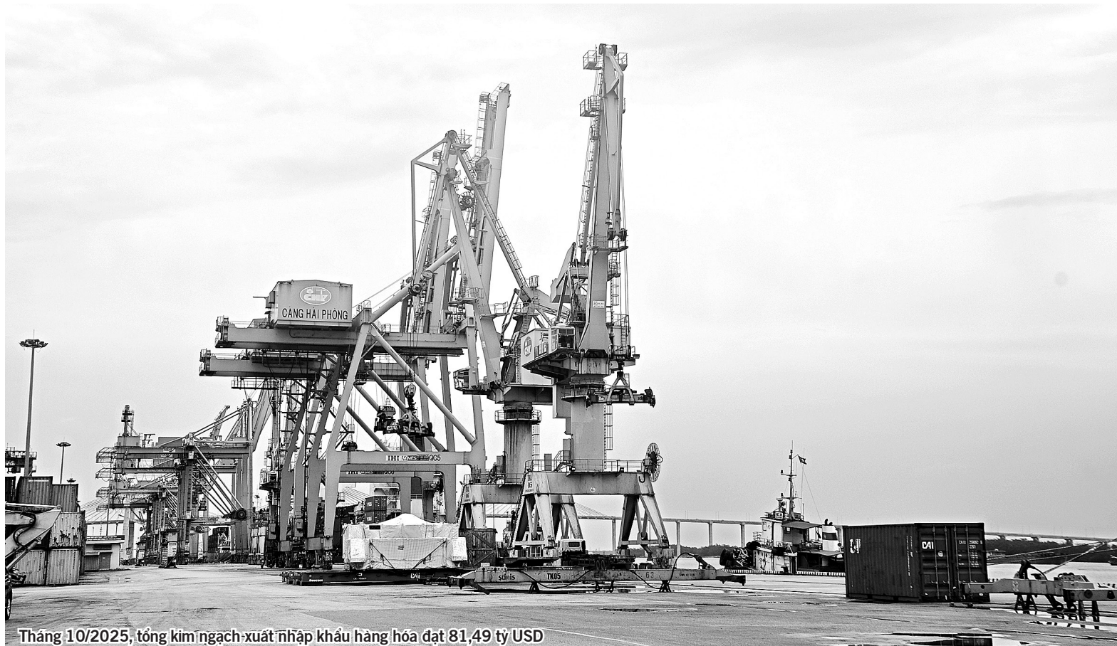
Tháng 10/2025, tổng kim ngạch xuất nhập khẩu hàng hóa đạt 81,49 tỷ USD