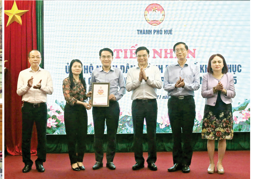
Petrovietnam trao biểu trưng hỗ trợ 5 tỷ đồng tại TP. Huế