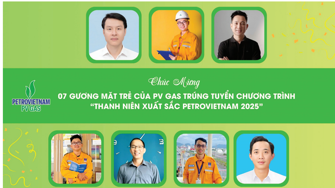
7 gương mặt trẻ của PV GAS trúng tuyển chương trình PV-Youth 2025 của Petrovietnam

tiễn tại các dự án trọng điểm của Tập đoàn. Với mô hình đào tạo hiện đại 70:20:10, chương trình PV-Youth 2025 giúp học viên phát triển năng lực vượt trội thông qua học tập chính quy, cố vấn trực tiếp từ các lãnh đạo giàu kinh nghiệm, cùng trải nghiệm thực tế tại các công trình, dự án dầu khí trọng điểm quốc gia.