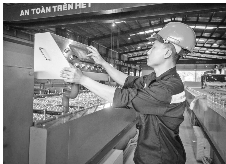
Nhiều doanh nghiệp công nghiệp nông thôn trên địa bàn tỉnh Tây Ninh được hỗ trợ từ nguồn vốn khuyến công Ảnh minh họa

Tuy nhiên, theo đại diện Trung tâm, triển khai công tác khuyến công trong bối cảnh mô hình chính quyền 2 cấp bước đầu thực thi cũng gặp không ít thử thách. Hai địa bàn cũ có tốc độ phát triển công nghiệp khác nhau, khiến việc phân bổ nguồn lực và lựa chọn mô hình hỗ trợ phù hợp gặp khó khăn. Nhiều cơ sở CNNT ở vùng sâu, vùng xa còn hạn chế về tài chính, kỹ năng tiếp cận thông tin; đội ngũ