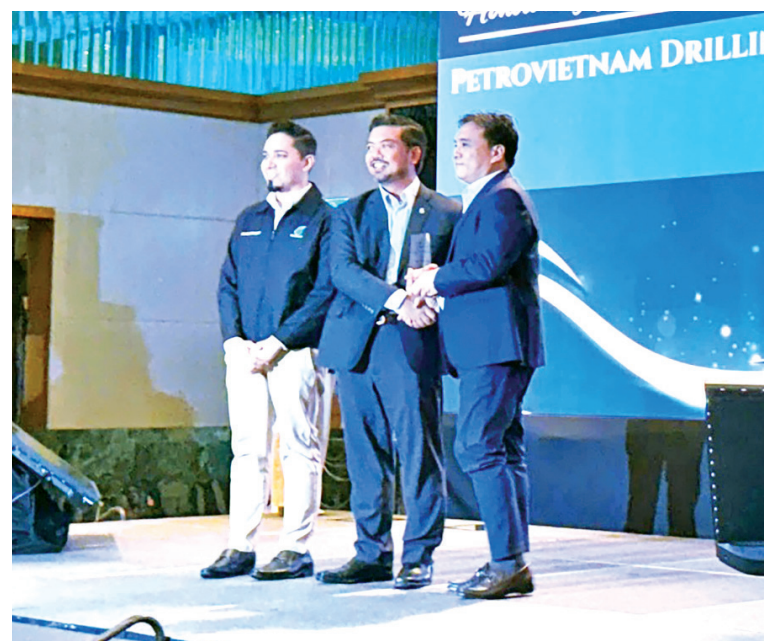
Đại diện PV Drilling vinh dự nhận giải thưởng

Tại hội nghị, để ghi nhận những đóng góp vượt trội của PV Drilling cho thành công chung của PCSB (Petronas Carigali Sdn Bhd) trong năm 2025, Petronas đã trao tặng PV Drilling Giải thưởng “Mission: Zero Possible” cho giàn khoan