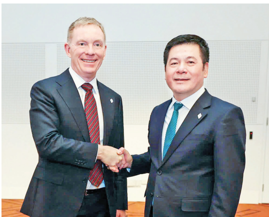
Bộ trưởng Bộ Công Thương Việt Nam Nguyễn Hồng Diên và ông Chris Bryant, Quốc vụ khanh phụ trách thương mại Vương quốc Anh