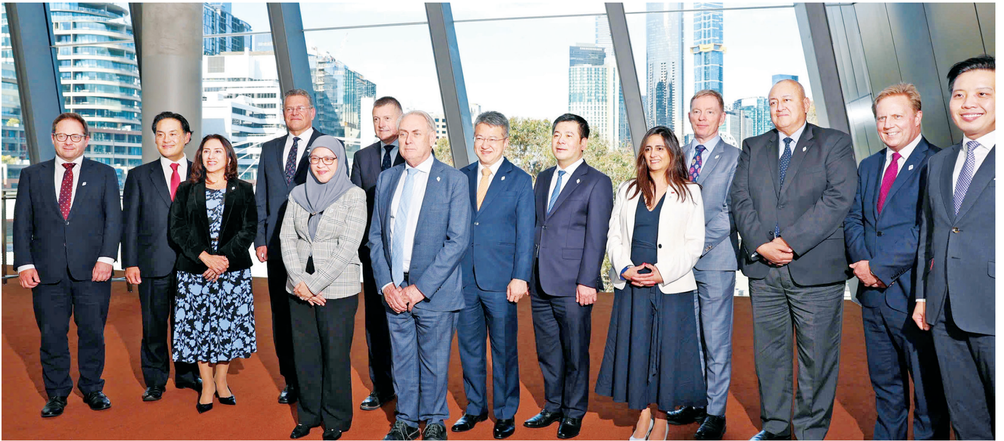
Bộ trưởng Nguyễn Hồng Diên và các Bộ trưởng dự Hội nghị Đối thoại thương mại và đầu tư CPTPP - EU