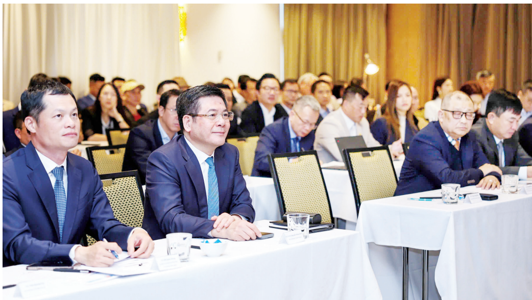
Bộ trưởng Nguyễn Hồng Diên dự Diễn đàn doanh nghiệp Việt Nam - Australia