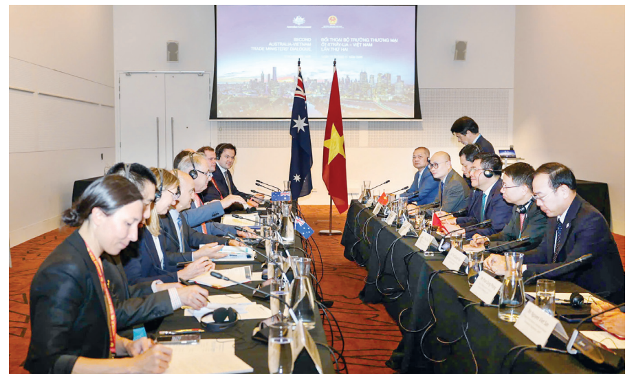
Bộ trưởng Bộ Công Thương Việt Nam Nguyễn Hồng Diên và Bộ trưởng Thương mại và Du lịch Australia - Thượng nghị sĩ Hon Don Farrell đồng chủ trì Kỳ họp lần thứ 2 đối thoại Bộ trưởng Thương mại