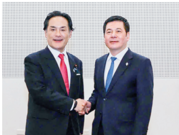
Bộ trưởng Bộ Công Thương Việt Nam Nguyễn Hồng Diên và ông Kazuchika Iwata, Quốc vụ khanh Văn phòng Nội các Nhật Bản