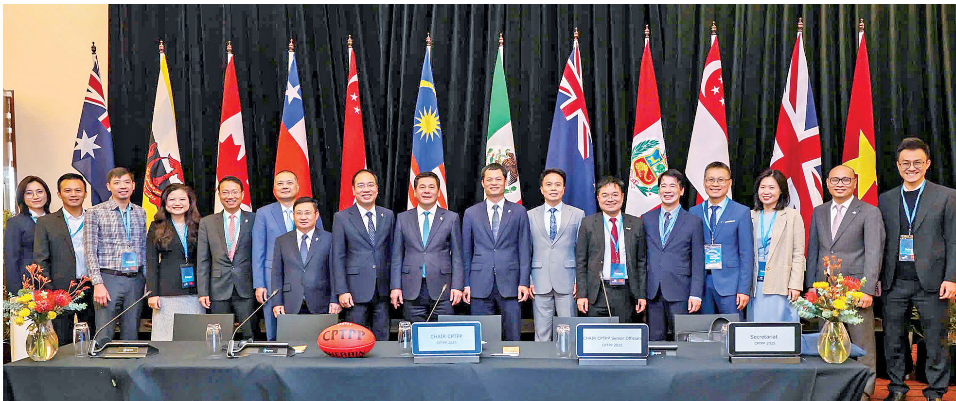
Đoàn công tác Bộ Công Thương tham dự phiên họp