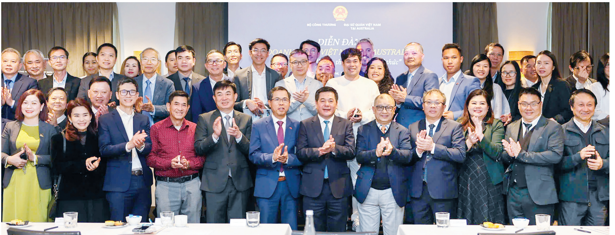
Các đại biểu dự Diễn đàn doanh nghiệp Việt Nam - Australia