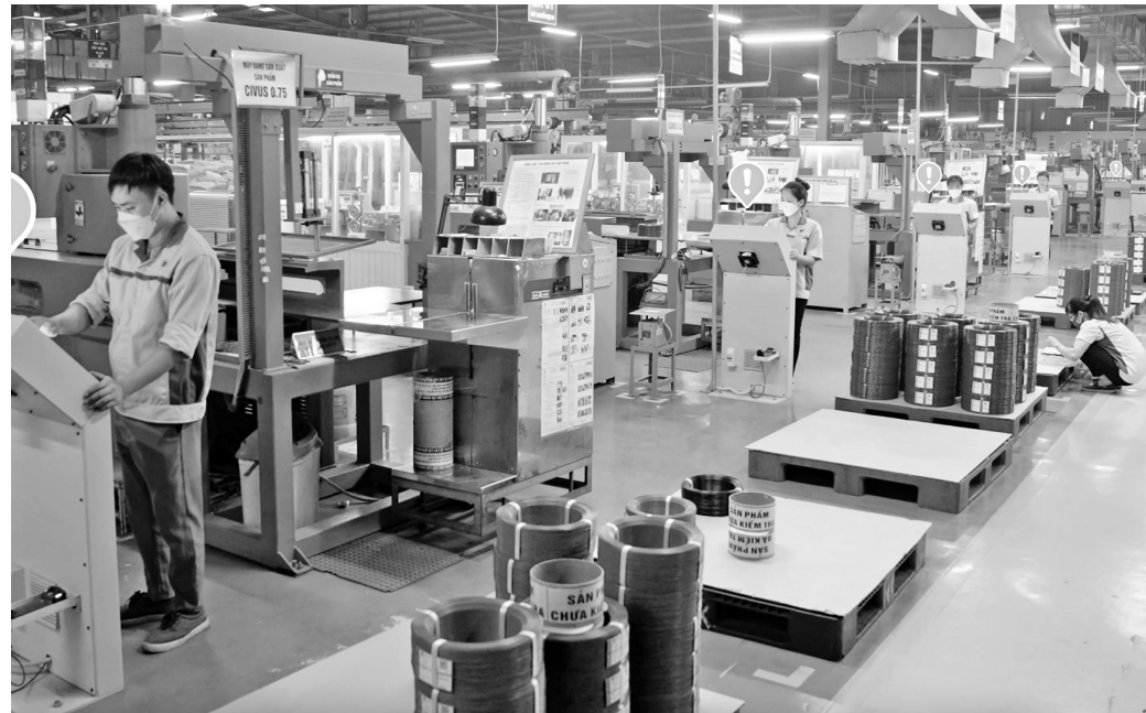
Hoạt động ứng dụng khoa học và công nghệ trong doanh nghiệp