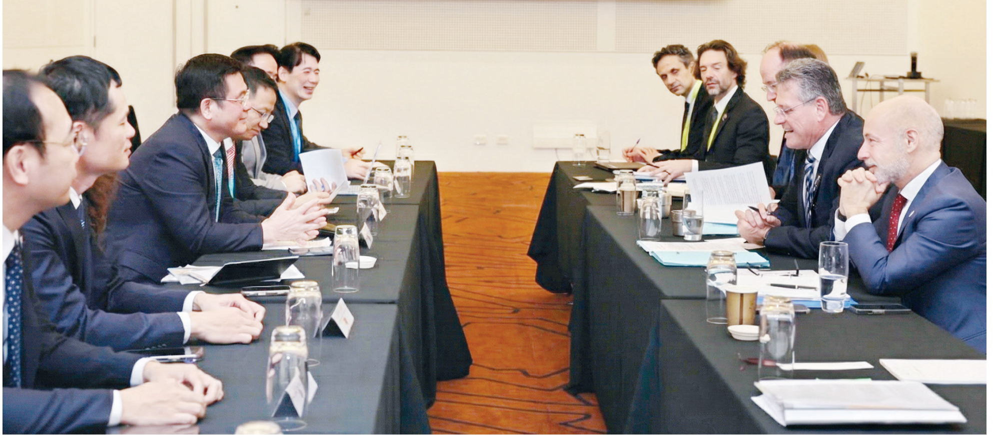
Buổi làm việc giữa Bộ trưởng Bộ Công Thương Nguyễn Hồng Diên và ông Maros Sefcovic, Cao ủy Thương mại Liên minh châu Âu (EU)