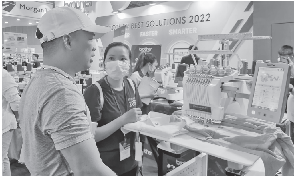
Doanh nghiệp dệt may Việt Nam đang nỗ lực đổi mới công nghệ, chuyển đổi số nhằm tăng năng suất

hội và yêu cầu minh bạch chuỗi cung ứng từ các thị trường lớn buộc ngành dệt may Việt Nam phải thay đổi.