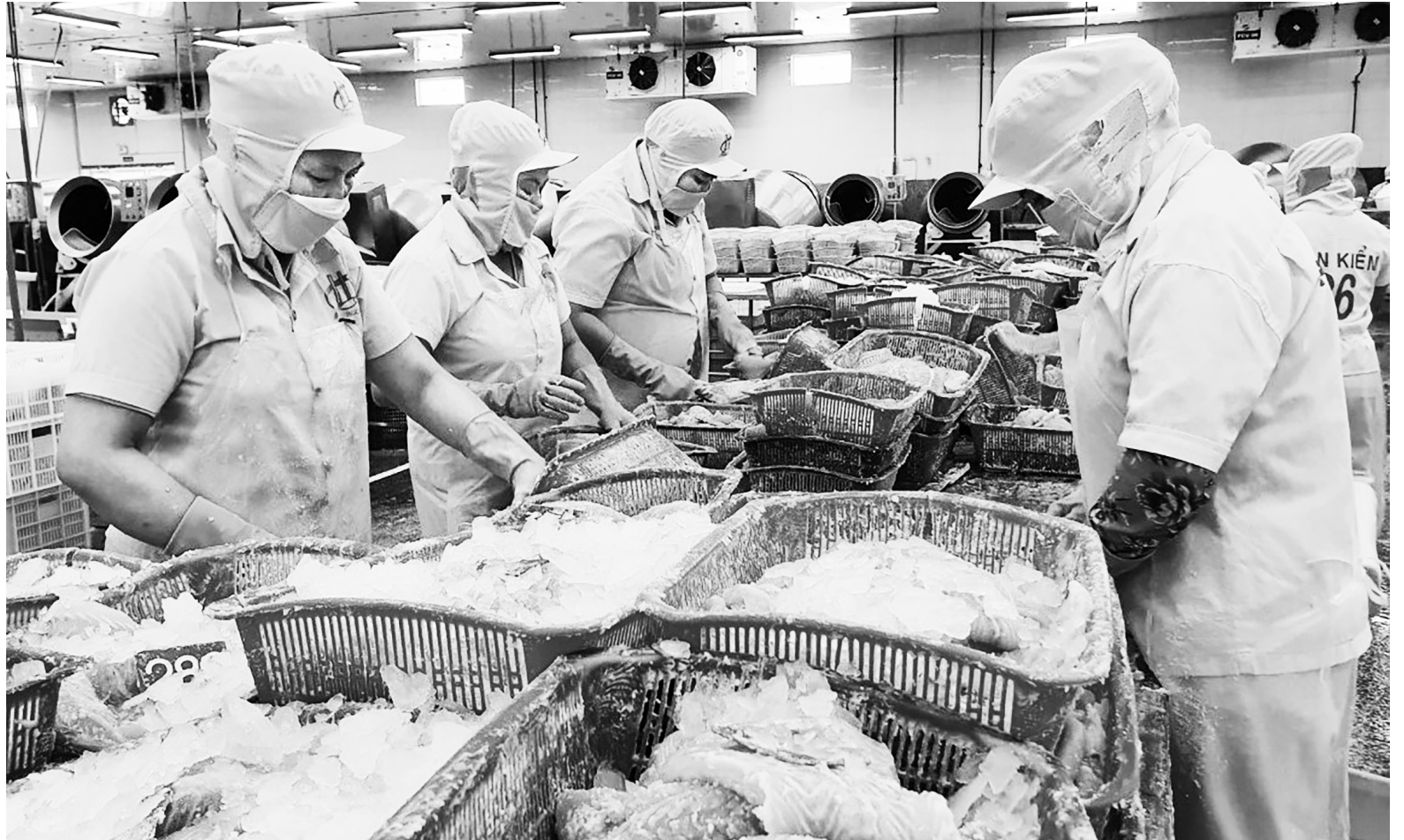
Tăng giá trị hàng hóa và đa dạng thị trường xuất khẩu từ các FTA