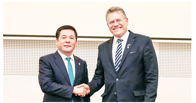
Bộ trưởng Nguyễn Hồng Diên và ông Maros Sefcovic, Cao ủy Thương mại Liên minh châu Âu (EU)