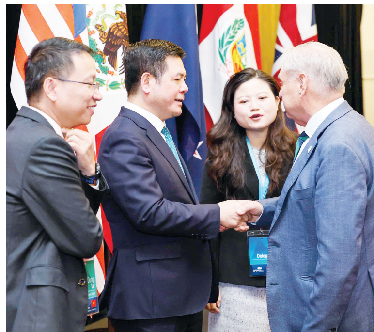
Bộ trưởng Nguyễn Hồng Diên gặp Bộ trưởng Thương mại và Du lịch Australia - Thương nghị sĩ Hon Don Farrell bên lề phiên họp

chia sẻ thực chất của tất cả các thành viên, đặc biệt là Australia và Peru với vai trò là Phó Chủ tịch CPTPP 2026. Việt Nam cam kết tôn trọng các chính kiến và hợp tác toàn diện, thúc đẩy tinh thần xây dựng để hoàn thành chương trình nghị sự được tất cả các thành viên thống nhất.