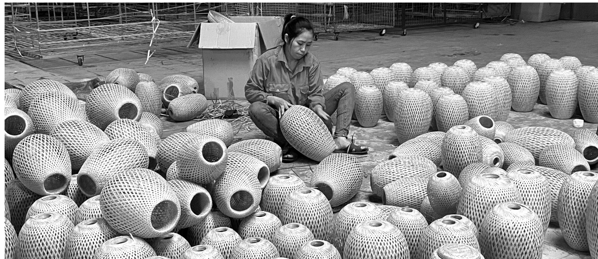
Sản xuất tại Công ty TNHH Đức Phong - doanh nghiệp có nhiều sản phẩm CNNT tiêu biểu của Nghệ An

tích cực, song công tác bình chọn sản phẩm CNNT tiêu biểu tại Nghệ An vẫn còn những hạn chế. Một số địa phương trong tỉnh chưa tổ chức thường xuyên bình chọn cấp xã, dẫn đến số lượng sản phẩm tham gia cấp tỉnh còn chưa phong phú. Công tác tuyên truyền, hướng dẫn quy trình tham gia chưa chú trọng khiến nhiều cơ sở sản xuất không kịp thời nắm bắt thông tin.