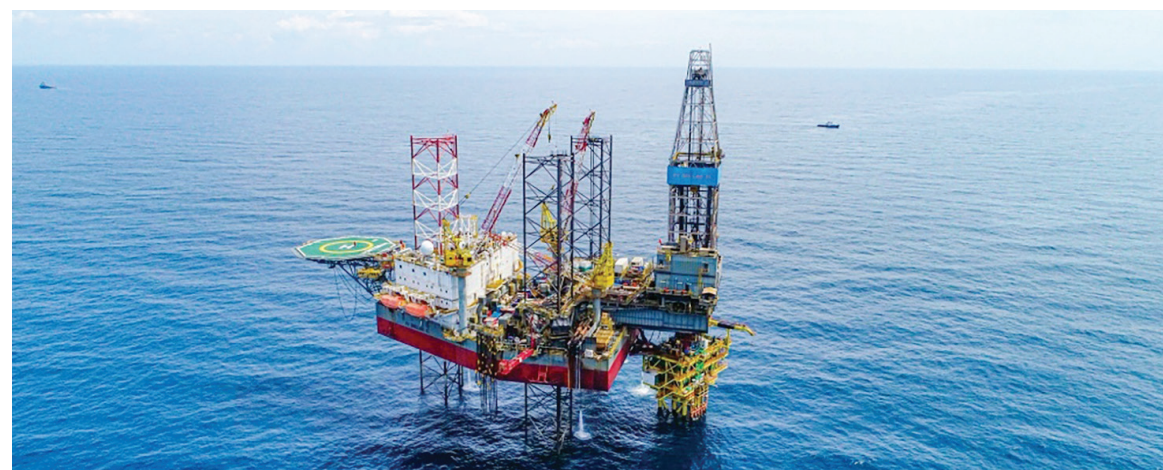
Giàn khoan tự nâng PV DRILLING VI

PV DRILLING I. Giải thưởng danh giá này là sự công nhận cho nỗ lực liên tục của PV Drilling trong việc thực hiện dự án với hiệu quả cao nhất, đi kèm với an toàn tuyệt đối, một trong những tiêu chí hàng đầu của ngành khoan dầu khí.