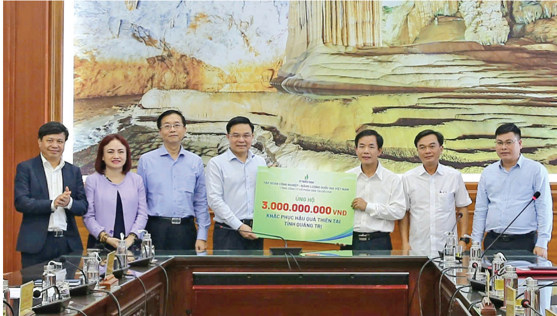
Petrovietnam trao biểu trưng hỗ trợ 3 tỷ đồng tại tỉnh Quảng Trị