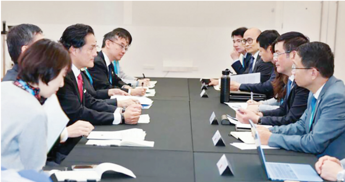
Bộ trưởng Bộ Công Thương Việt Nam Nguyễn Hồng Diên và ông Kazuchika Iwata, Quốc vụ khanh Văn phòng Nội các Nhật Bản