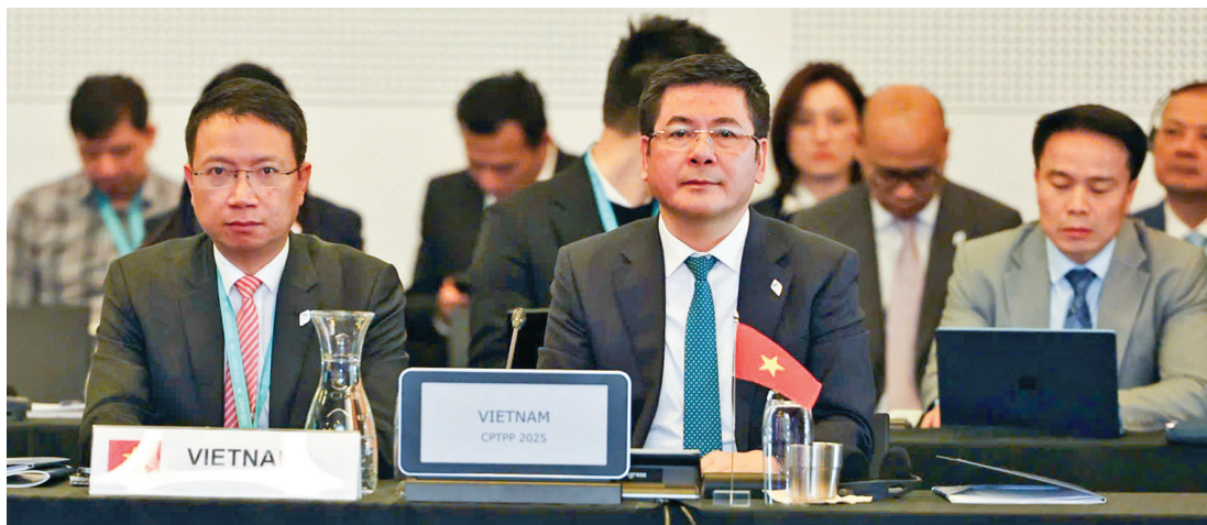
Bộ trưởng Nguyễn Hồng Diên dự phiên họp Hội đồng CPTPP cấp Bộ trưởng lần thứ 9