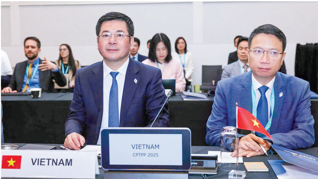
Bộ trưởng Bộ Công Thương Việt Nam Nguyễn Hồng Diên tham dự Hội nghị Đối thoại thương mại và đầu tư CPTPP - EU