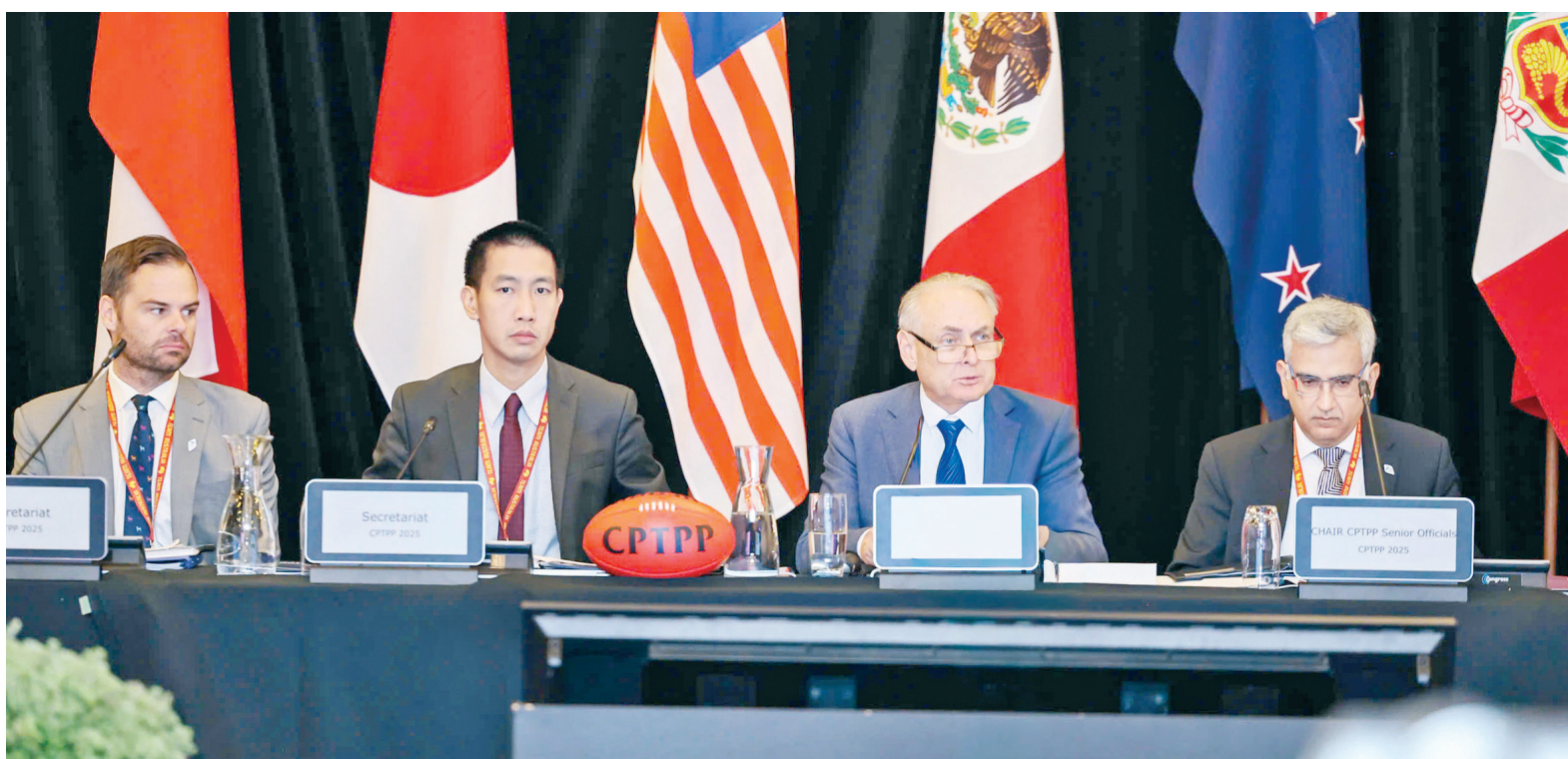
Ban điều hành Phiên họp Hội đồng Hiệp định Đối tác Toàn diện và Tiến bộ xuyên Thái Bình Dương (CPTPP) lần thứ 9

Tất cả những ưu tiên đó chỉ có thể đạt kết quả như mong muốn nếu có sự ủng hộ, đồng hành và