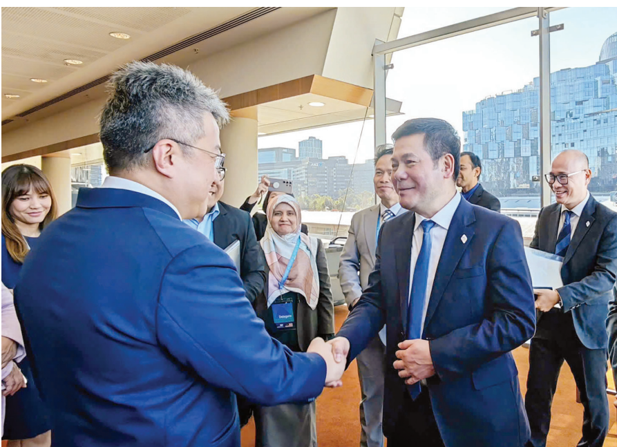
Bộ trưởng Nguyễn Hồng Diên gặp Thủ trưởng Bộ Đầu tư, Thương mại và Công nghiệp Malaysia Liew Chin Tong