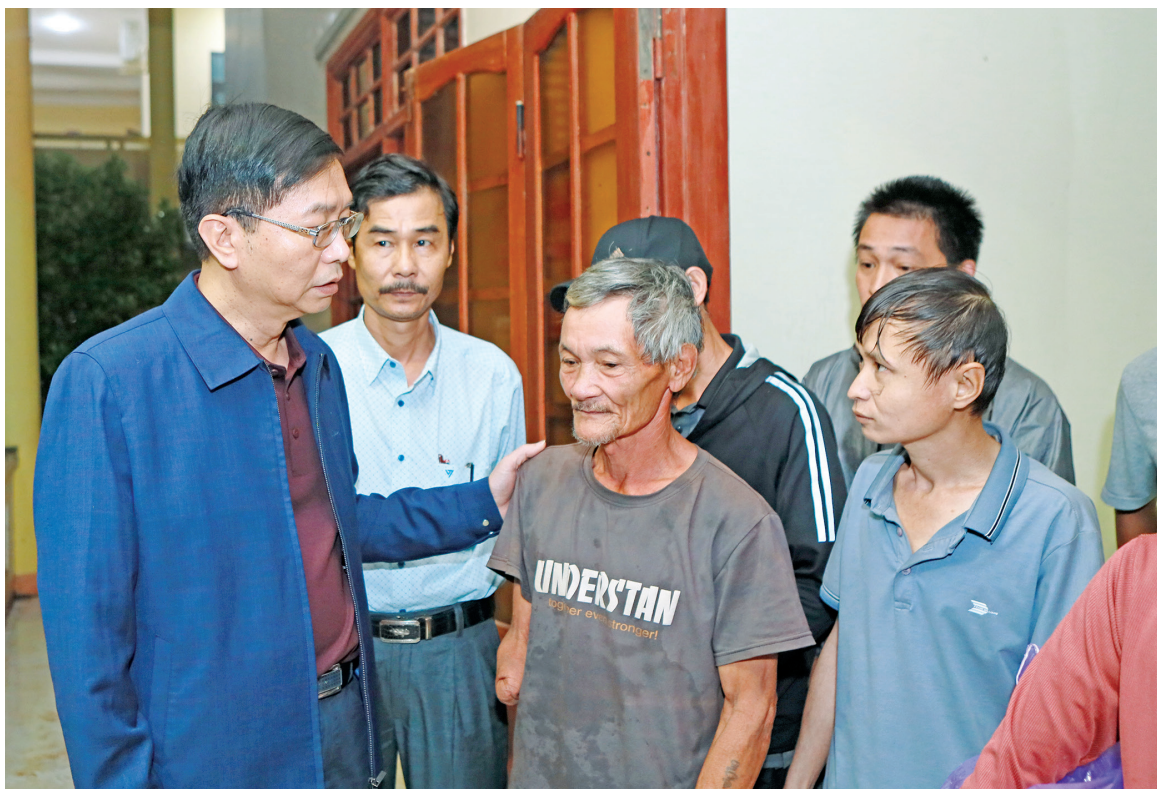
Lãnh đạo Petrovietnam chia sẻ với người dân bị ảnh hưởng bởi thiên tai tại miền Trung

Từ trước đến nay, tính riêng tại tỉnh Quảng Trị, Petrovietnam đã đóng góp 217,2 tỷ đồng cho hoạt động an sinh xã hội trên địa bàn; con số này với TP. Huế là 40 tỷ đồng. Thấu hiểu với những khó khăn do thiên tai gây ra tại địa bàn miền Trung, Petrovietnam hy vọng với các khoản hỗ trợ sẽ góp phần giúp chính quyền, nhân dân tỉnh Quảng Trị và TP. Huế sớm vượt qua khó khăn, ổn định cuộc sống. ■