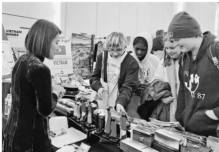
Quảng bá hàng Việt tại Hoa Kỳ