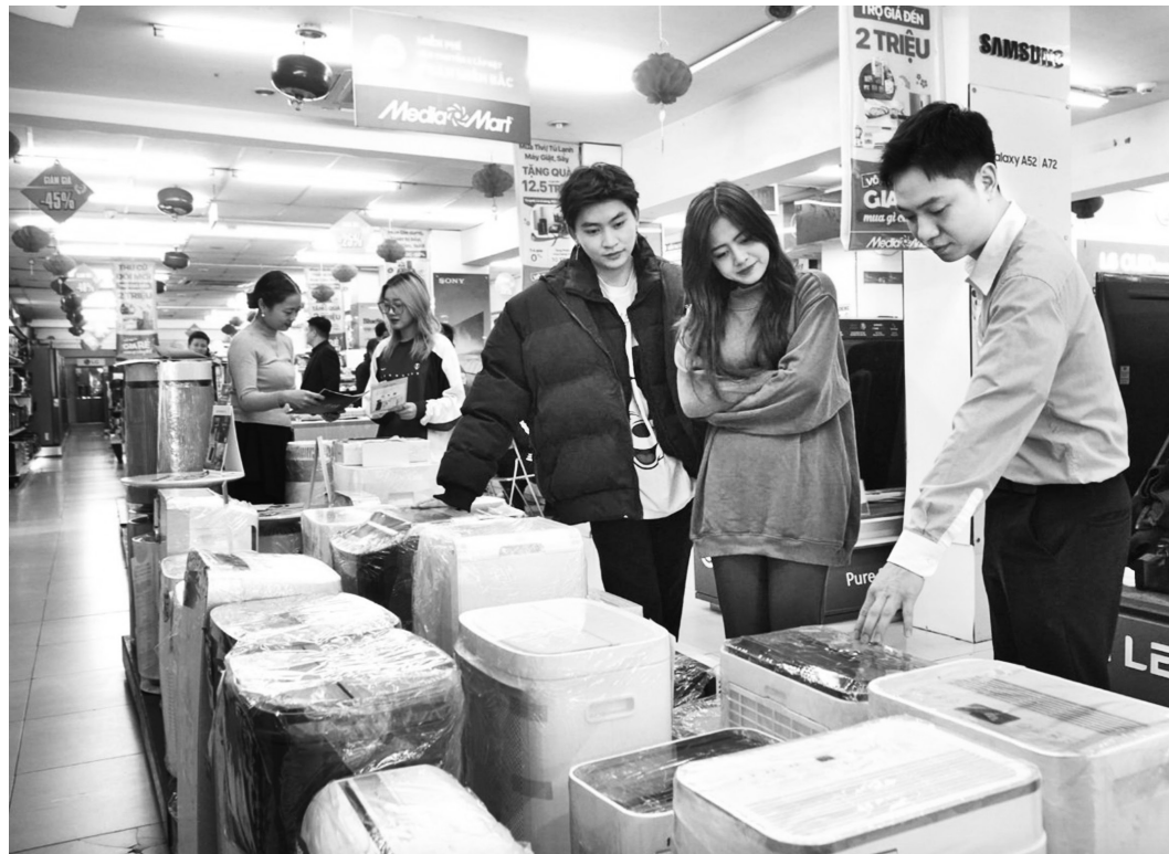
Người dân mua máy hút ẩm tại siêu thị điện máy