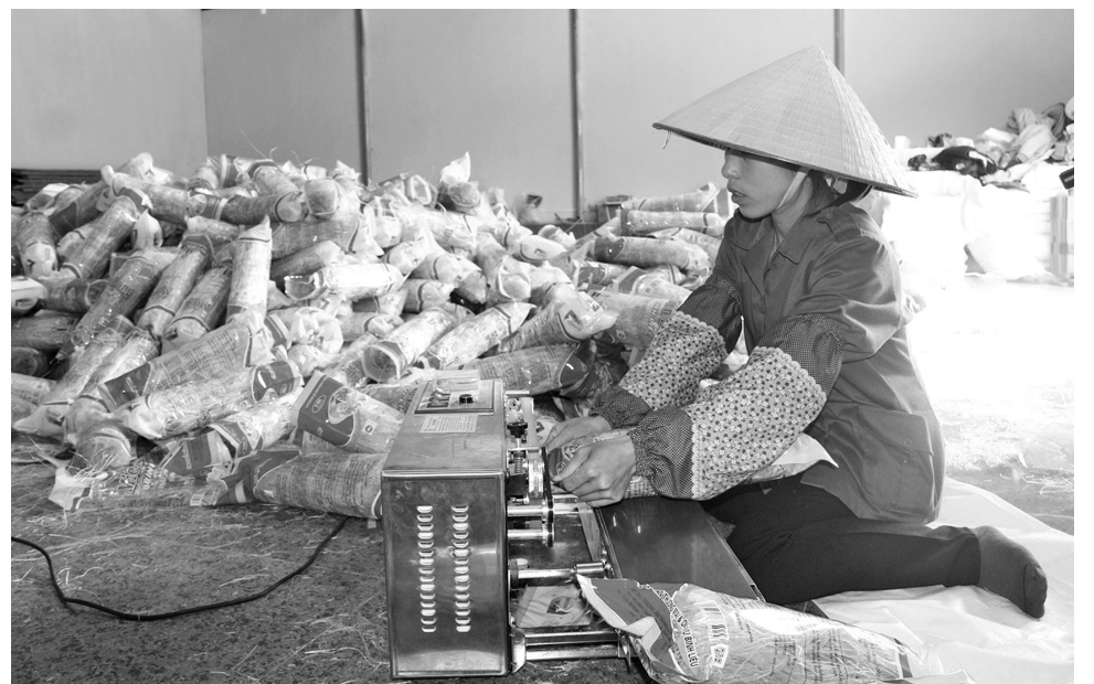
Ảnh: Nguyễn Quý