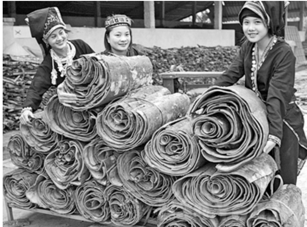
Sản phẩm quế vò của huyện Văn Yên chuẩn bị đưa đi tiêu thụ trên thị trường