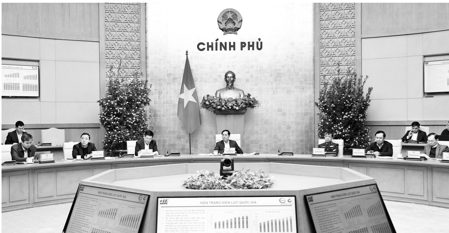
Phó Thủ tướng Bùi Thanh Sơn chủ trì họp Hội đồng thẩm định điều chỉnh Quy hoạch điện VIII

Về tiếp thu giải trình ý kiến các thành viên Hội đồng thẩm định, Bộ trưởng Nguyễn Hồng Diên cho biết: Trên cơ sở ý kiến tham gia góp ý của 3 ủy viên phản biện và các thành viên Hội đồng thẩm định đối với hồ sơ điều chỉnh Quy hoạch