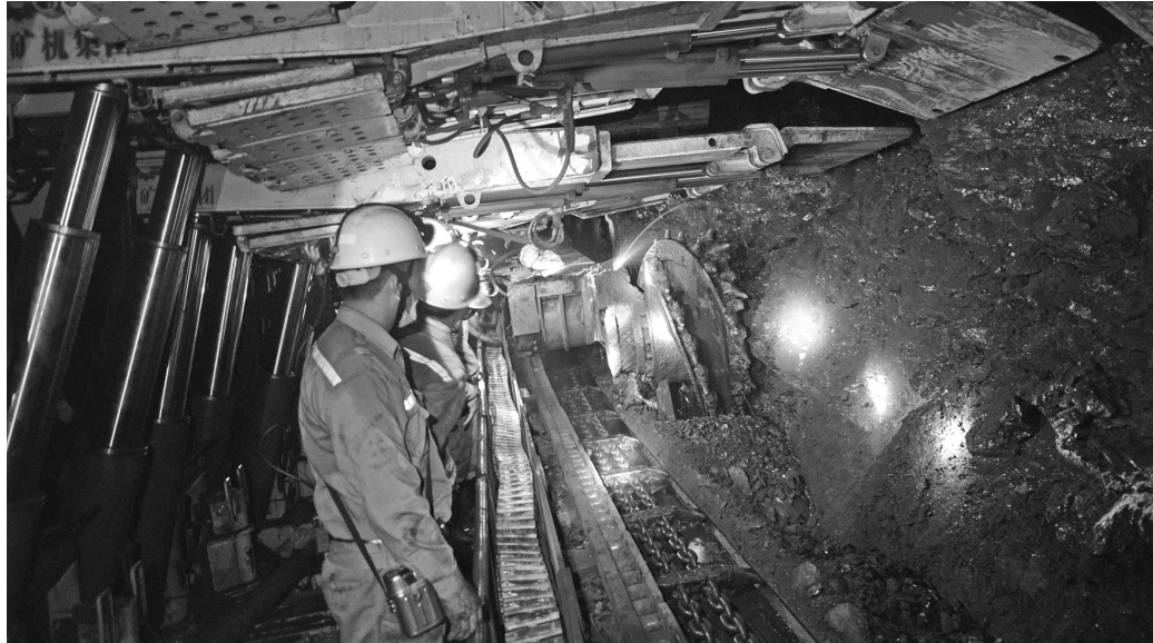
Tỷ lệ khai thác than hầm lò bằng cơ giới hóa tăng