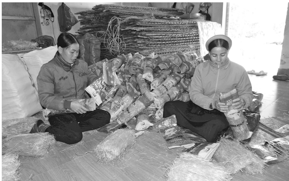
Bà con đóng gói miến dong Bình Liêu

Miến dong Bình Liêu đã được Bộ Công Thương công nhận sản phẩm công nghiệp nông thôn tiêu biểu khu vực phía Bắc năm 2024. Đây là cơ hội, "đòn bẩy" để công ty nâng cao sức cạnh tranh, quảng bá rộng rãi thương hiệu và kết nối mở rộng thị trường.