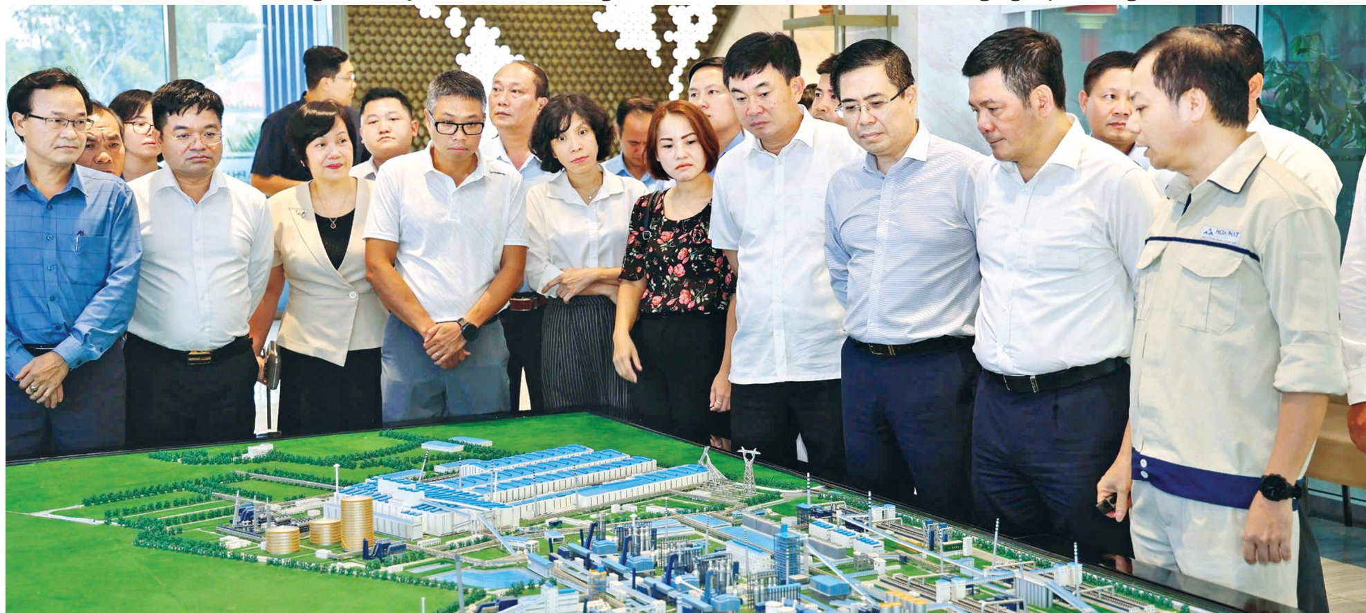
Bộ trưởng Nguyễn Hồng Diên dẫn đầu đoàn công tác của Bộ Công Thương thăm, thị sát Khu liên hợp sản xuất gang thép Hòa Phát Dung Quất (tháng 8/2024)