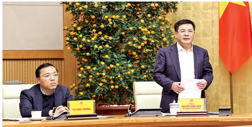
Bộ trưởng Nguyễn Hồng Diên phát biểu tại cuộc họp