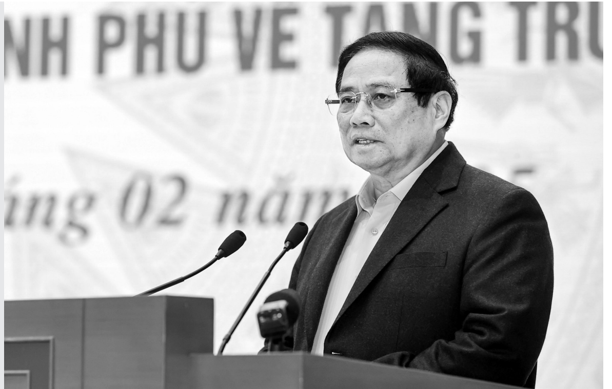
Thủ tướng Phạm Minh Chính chỉ rõ 10 nhiệm vụ, giải pháp trọng tâm trong thời gian tới