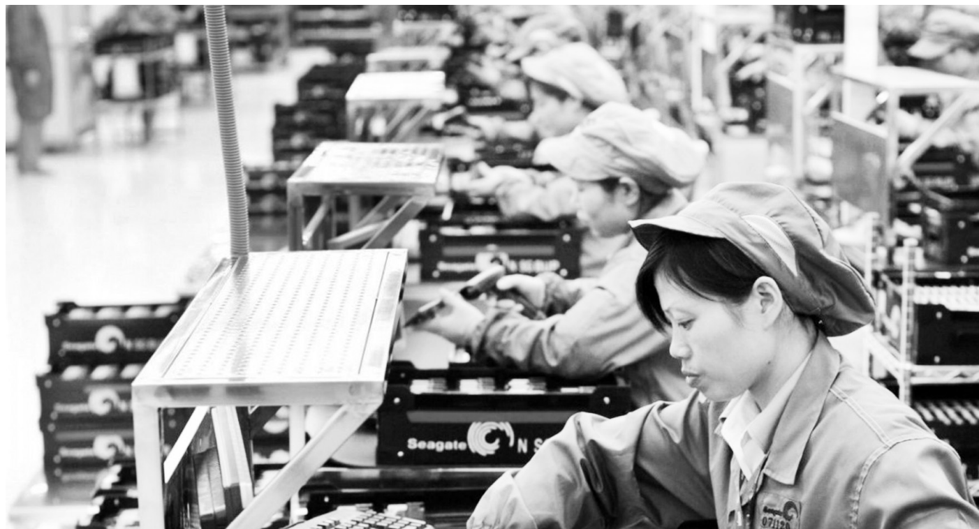
Nguồn vốn FDI là yếu tố rất quan trọng, có tác động tích cực đến sản xuất công nghiệp