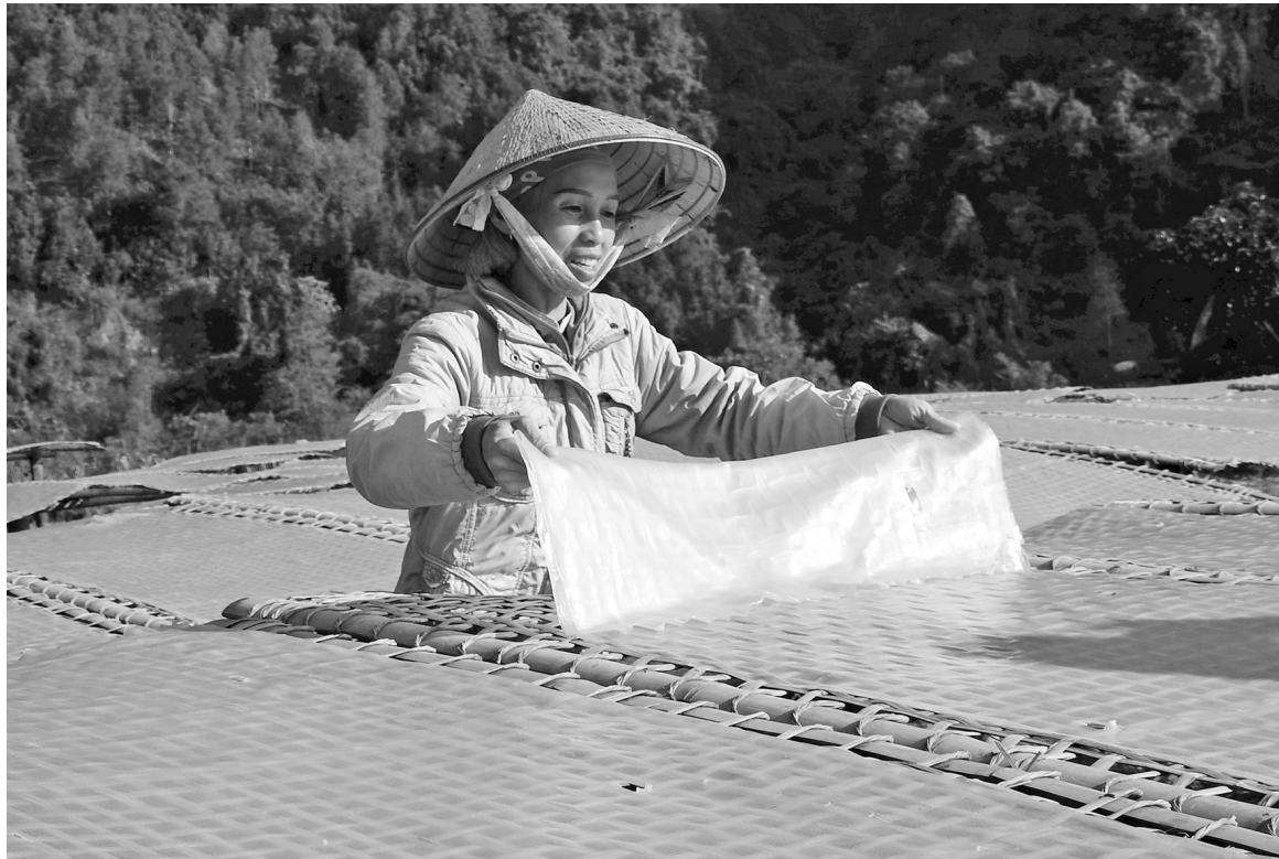
Các hộ sản xuất miến dong Bình Liêu

Tại Bình Liêu, Công ty CP Thương mại và Dịch vụ Bình Liêu được biết tới là một doanh nghiệp đi đầu trong xây dựng, phát triển thương hiệu và đưa miến dong Bình Liêu vươn xa ra thị trường ngoài tỉnh. Theo đó, năm 2006, công ty này đã đầu tư xây dựng nhà xưởng chế biến miến dong tại xã Đồng Tâm với máy móc, trang thiết bị hiện đại, kết hợp với phương pháp sản xuất truyền thống. Đặc biệt, với phương châm đem lại sản phẩm sạch, an toàn, ngon miệng, Công ty CP Thương mại và Dịch vụ Bình Liêu đã không ngừng đầu tư, cải thiện máy móc, trang thiết bị và quy trình sản xuất, tích cực nghiên cứu, đồng thời không ngừng cải tiến, nâng cao chất lượng sản phẩm, mẫu mã, bao bì.