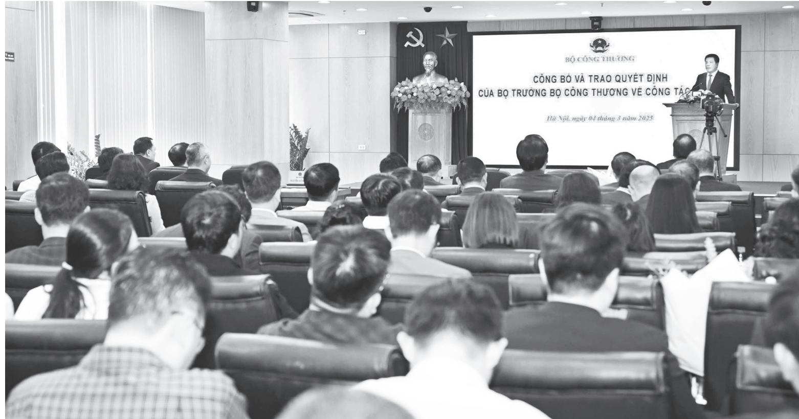
Hội nghị công bố và trao các quyết định của Bộ trưởng Bộ Công Thương về công tác cán bộ

Đối với doanh nghiệp và người dân, cải thiện chất lượng dịch vụ công, giảm thủ tục hành chính. Giảm số lượng đầu mối quản lý giúp giảm bớt sự chồng chéo và tạo điều kiện thuận lợi cho doanh nghiệp và người dân khi tiếp cận các dịch vụ công. Đơn giản hóa thủ tục hành chính việc hợp nhất và sắp xếp lại các đơn vị chức năng giúp quy trình xử lý hồ sơ được thực hiện nhanh chóng, giảm bớt các bước trung gian không cần thiết, từ đó rút ngắn thời gian giải quyết thủ tục cho doanh nghiệp và người dân.