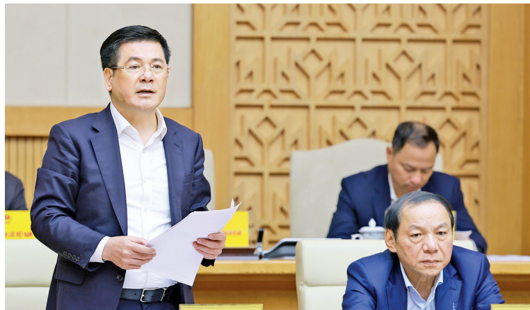
Bộ trưởng Nguyễn Hồng Diên phát biểu tại phiên họp Chính phủ thường kỳ tháng 2.