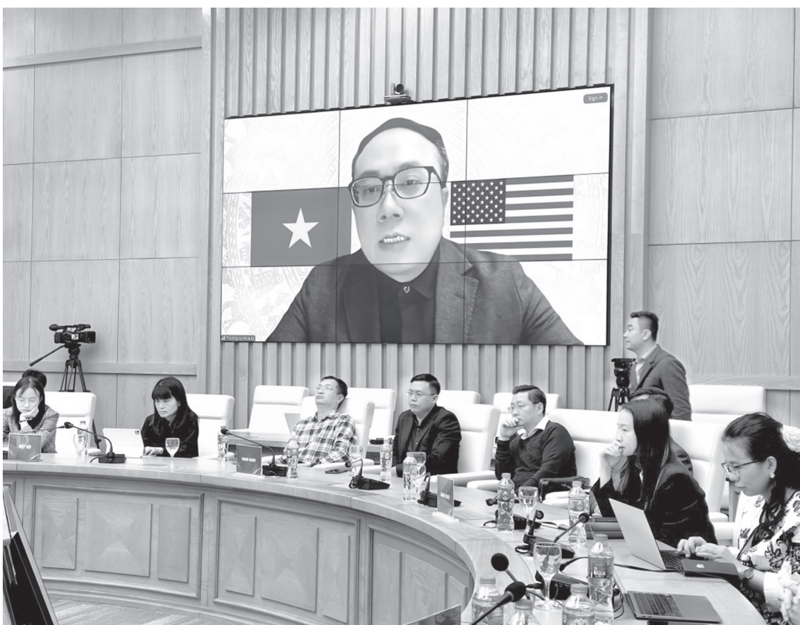
Hội nghị giao ban tháng 2 nhằm phổ biến các văn bản quy phạm pháp luật mới liên quan đến ngành Công Thương