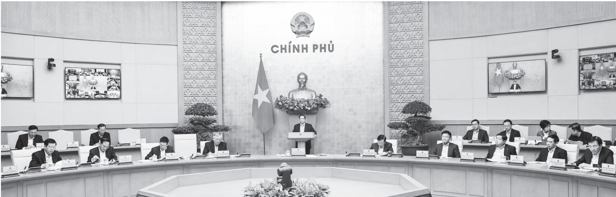
Phiên họp Chính phủ thường kỳ tháng 2/2025