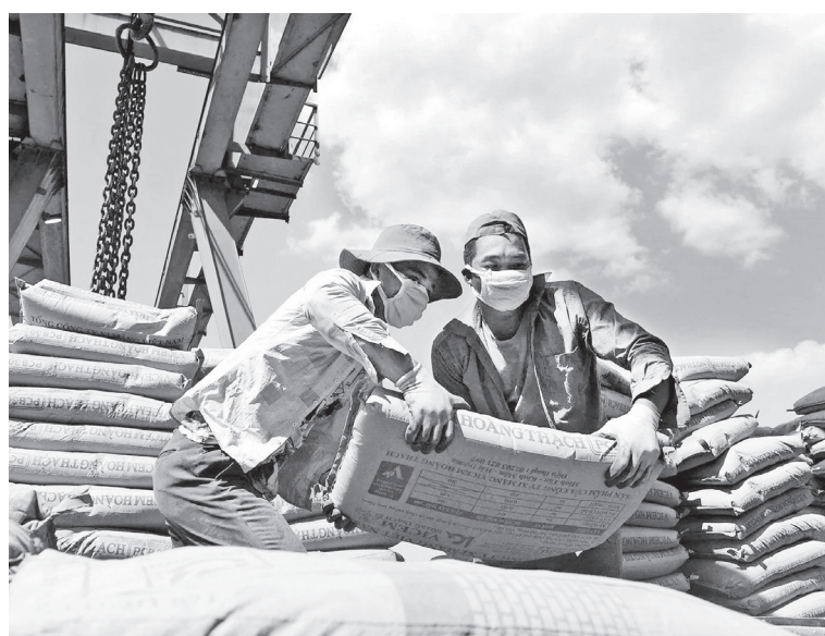
Xuất khẩu xi măng

“Bộ Công Thương Philippines đã gửi bảng câu hỏi, tuy nhiên,