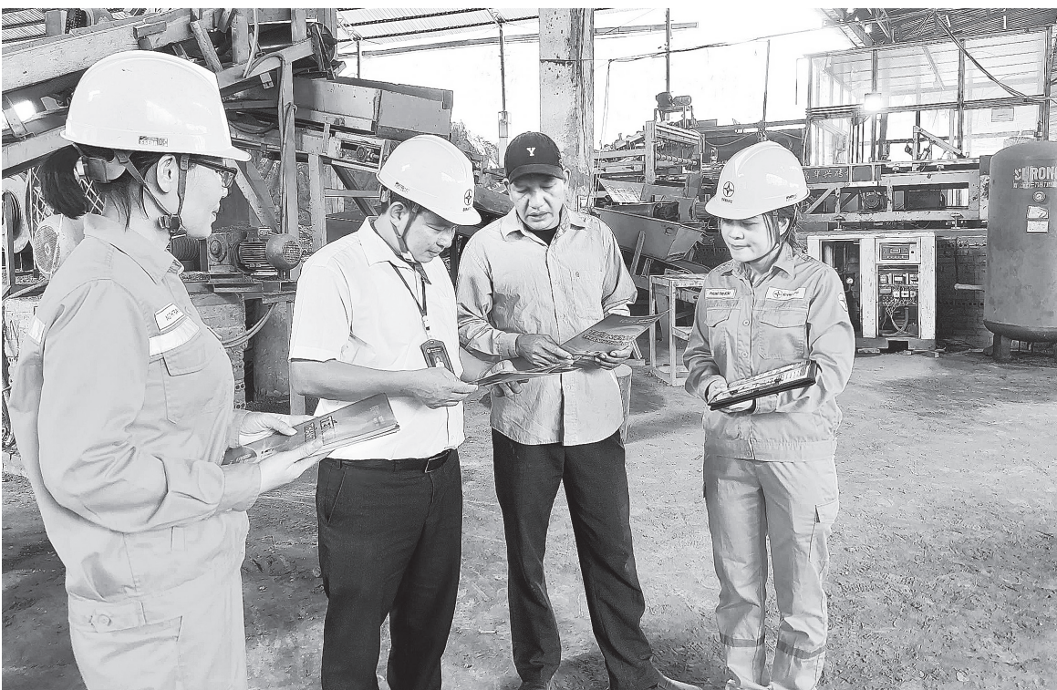
Việc tinh gọn bộ máy giúp Bộ Công Thương hoạt động hiệu lực, hiệu quả hơn, tạo môi trường kinh doanh thuận lợi cho doanh nghiệp

Việc thay đổi cơ cấu tổ chức và phương thức làm việc đòi hỏi sự thích nghi từ cán bộ, công chức. Tuy nhiên, thói quen và quy trình làm việc cũ có thể tạo ra sự kháng cự, dẫn đến trì trệ trong quá trình