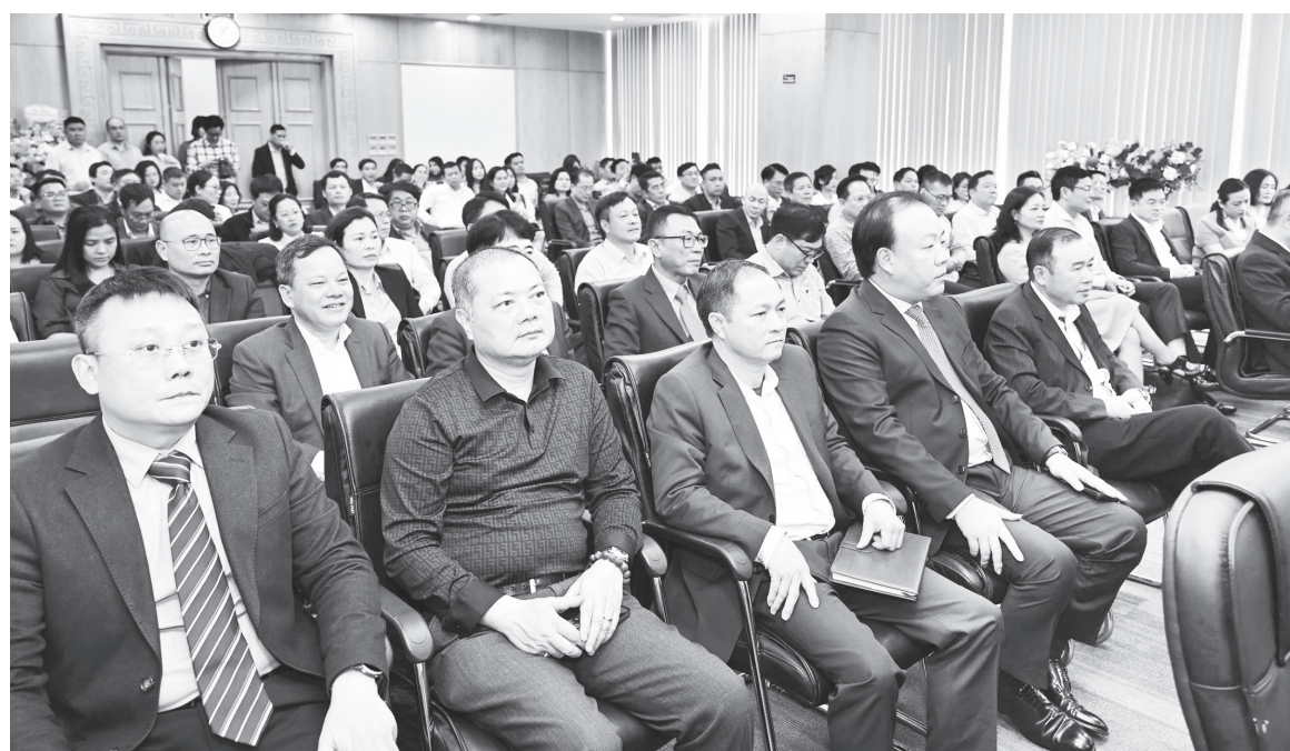
Các đại biểu dự hội nghị