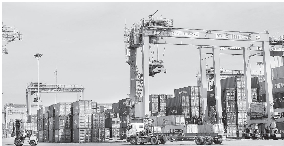
Xuất nhập khẩu là điểm sáng của nền kinh tế trong 2 tháng đầu năm

Tình hình kinh tế - xã hội 2 tháng đạt nhiều kết quả tích cực, tốt hơn tháng trước và cùng kỳ năm trước; người dân, doanh nghiệp, nhà đầu tư trong và ngoài nước, các định chế tài chính, tổ chức xếp hạng tin nhiệm quốc tế... gia tăng niềm tin vào triển vọng của nền kinh tế.