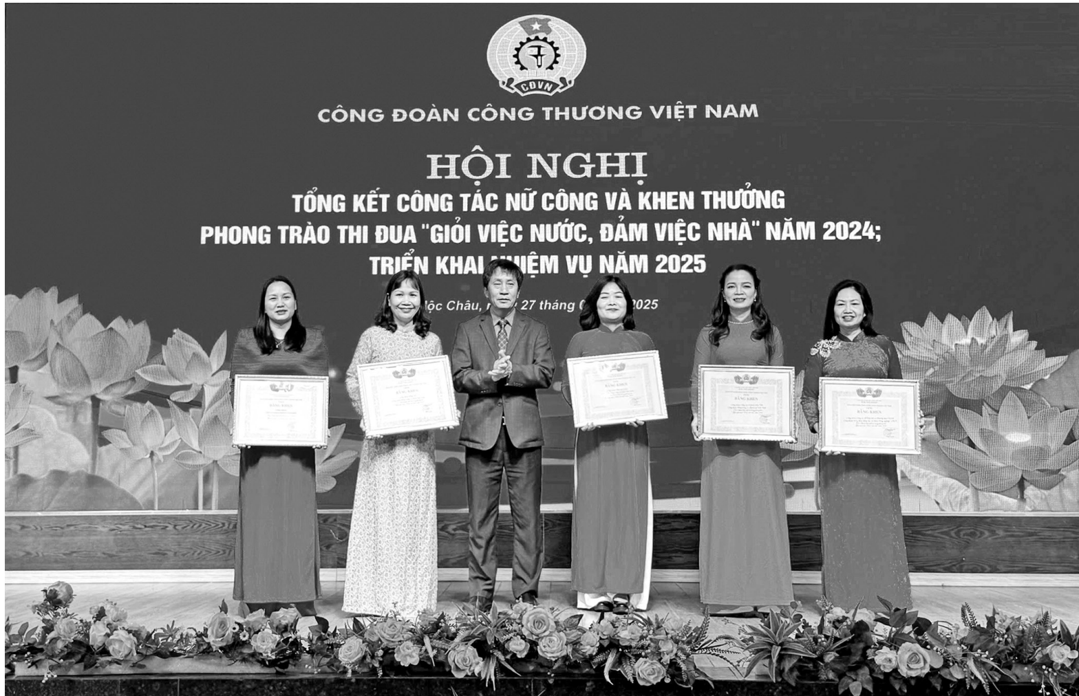
Công đoàn Công Thương Việt Nam tổ chức lễ Tổng kết công tác nữ công và khen thưởng phong trào thi đua "Giỏi việc nước, đảm việc nhà" tại Sơn La ngày 27/2/2025

Công đoàn Công Thương Việt Nam đã tổ chức Phát động "Tuần lễ áo dài" trong nữ đoàn viên, người lao động mặc áo dài trong ngày làm việc phù hợp với điều kiện và đặc thù nghề nghiệp. Tổ chức các hoạt động phong phú, đa dạng thu hút đông đảo nữ đoàn viên, người lao động tham gia nhân dịp kỷ niệm 115 Ngày Quốc tế phụ nữ 8/3.