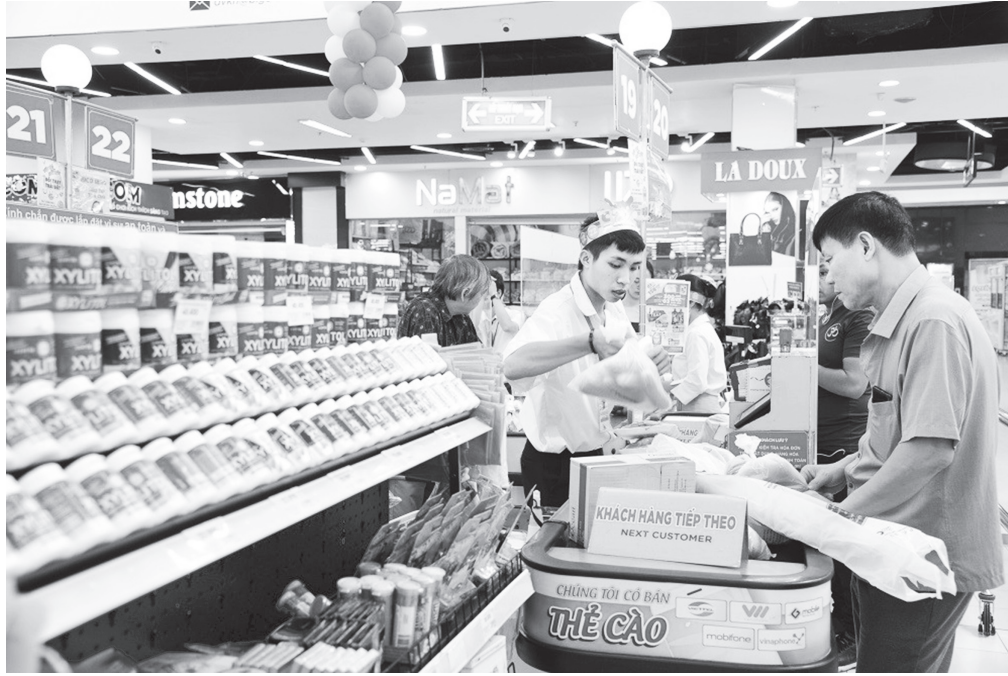
Thị trường bán lẻ Việt Nam liên tục đón nhận các tin vui