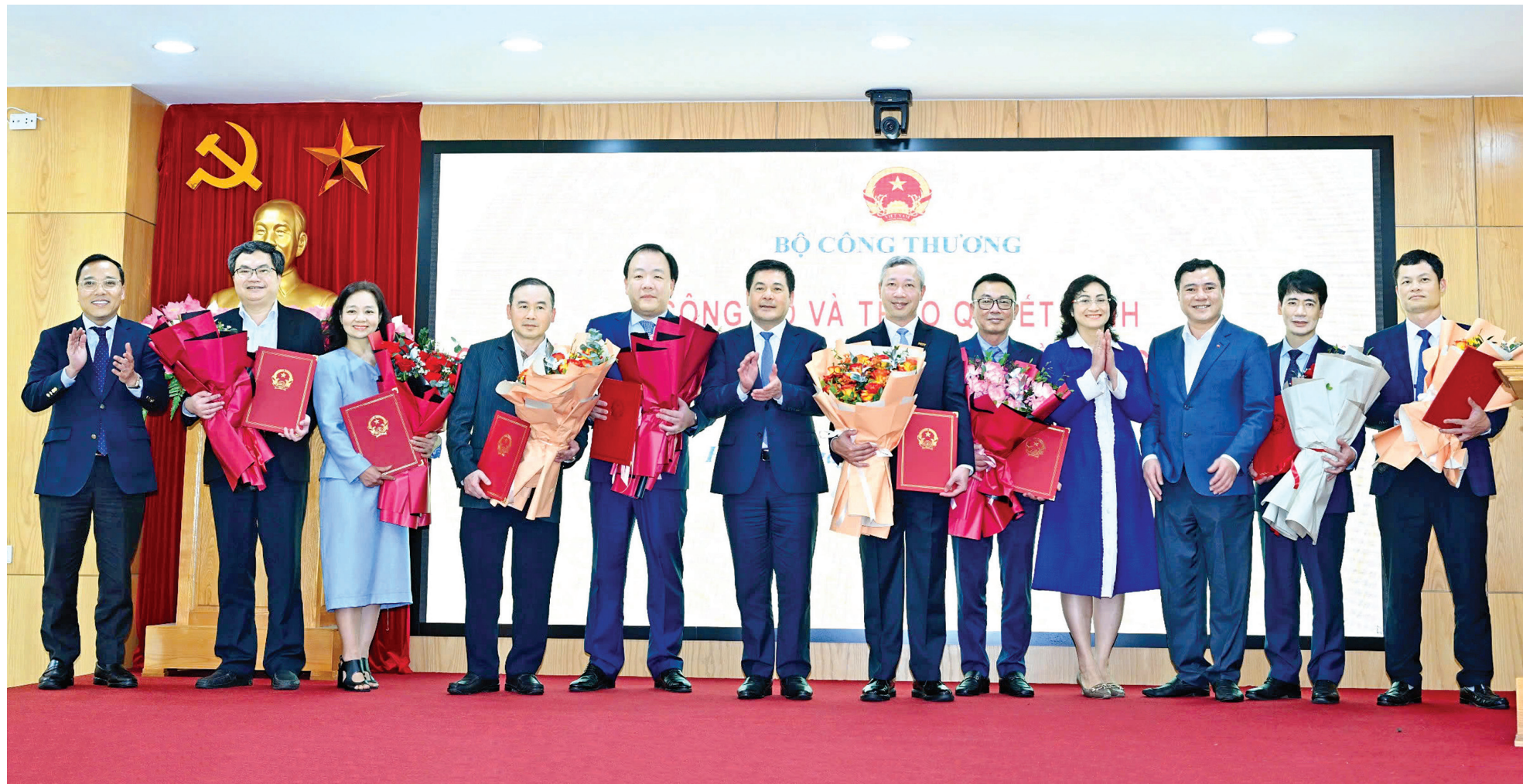
Lãnh đạo Bộ Công Thương trao quyết định và chúc mừng các đồng chí được điều động, bổ nhiệm