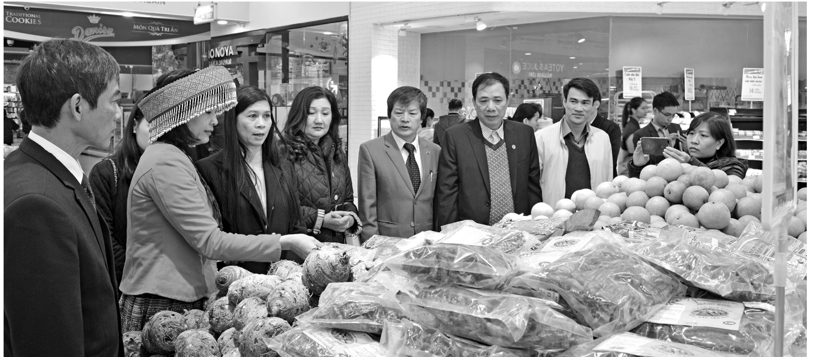
Yên Bái triển khai nhiều giải pháp quảng bá, tiêu thụ sản phẩm cho bà con

Bên cạnh đầu tư hệ thống chợ, thời gian qua, ngành Công Thương Yên Bái cũng triển khai nhiều giải pháp nhằm hỗ trợ