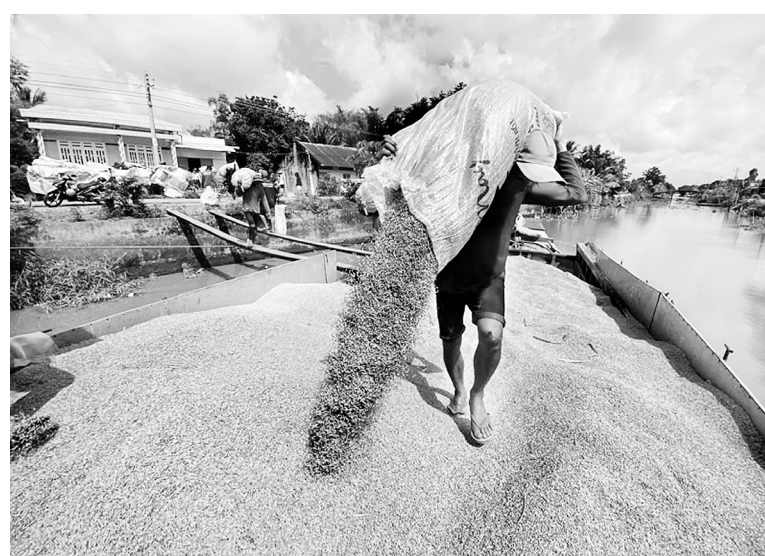
Gạo Việt Nam không cạnh tranh trực tiếp với gạo Ấn Độ

Các chuyên gia trong ngành nhận định, cùng với nguồn cung gạo thế giới tăng, nhu cầu nhập khẩu giảm và chưa có dấu hiệu phục hồi trong thời gian ngắn hạn sẽ tiếp tục tạo áp lực lên thị trường toàn cầu.