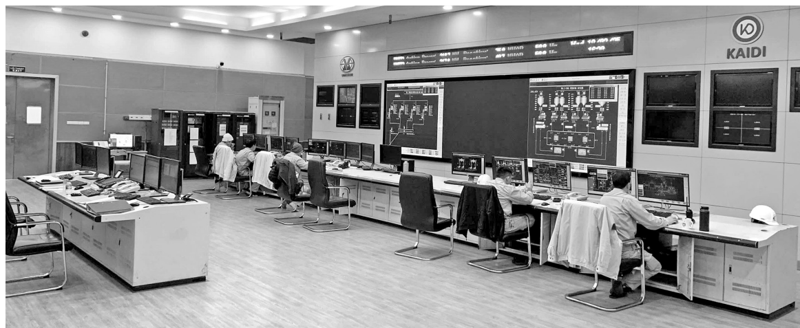
Phòng điều khiển trung tâm Nhà máy Nhiệt điện Mạo Khê

Là đơn vị thuộc Tổng công ty Điện lực - TKV, trong 13 năm vận hành, Nhà máy Nhiệt điện Mạo Khê, Công ty Nhiệt điện Đông Triều quản lý vận hành luôn thực hiện tốt công tác kiểm soát nguồn thải, xây dựng môi trường xanh, sạch trong sản xuất.