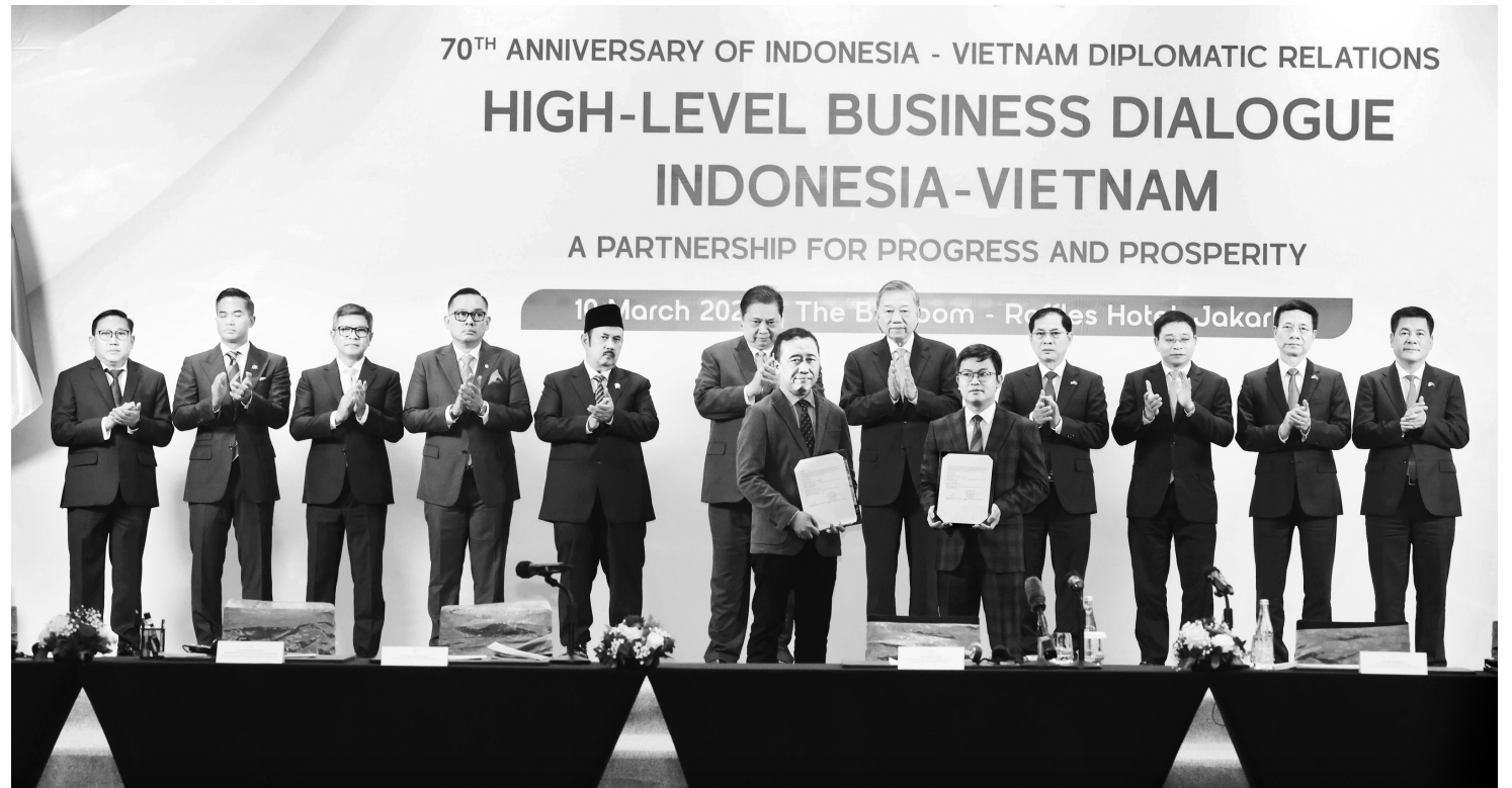
Tổng Bí thư Tô Lâm chứng kiến trao các thỏa thuận hợp tác giữa doanh nghiệp Việt Nam - Indonesia