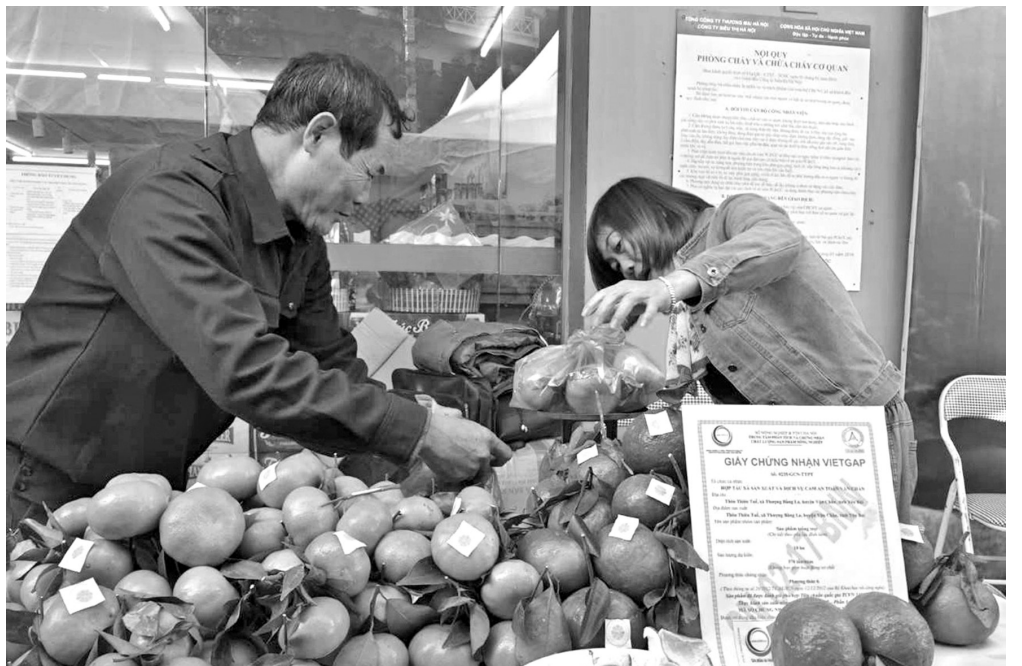
Yên Bái có thể mạnh về nhiều loại nông sản