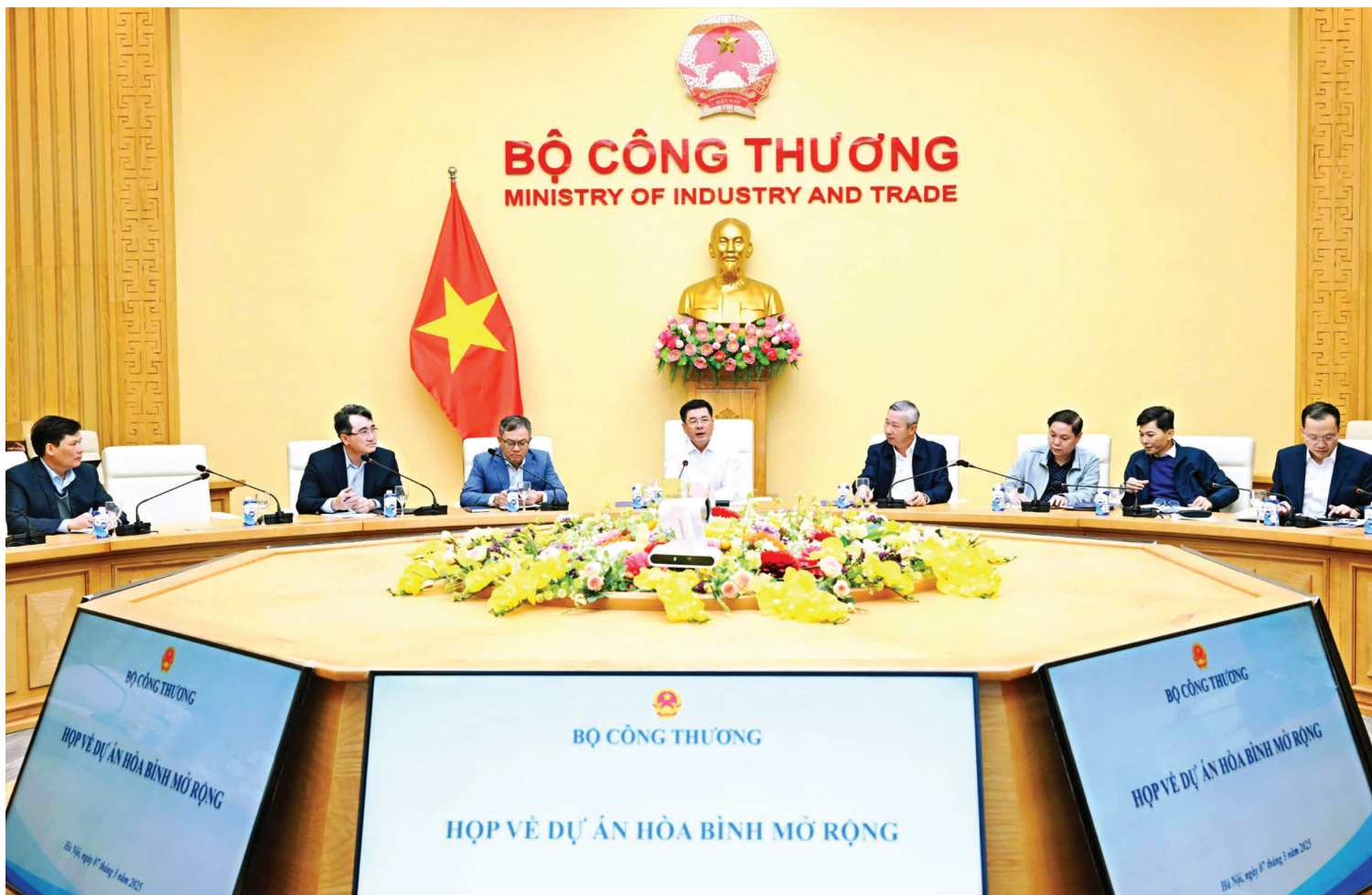
Toàn cảnh buổi làm việc