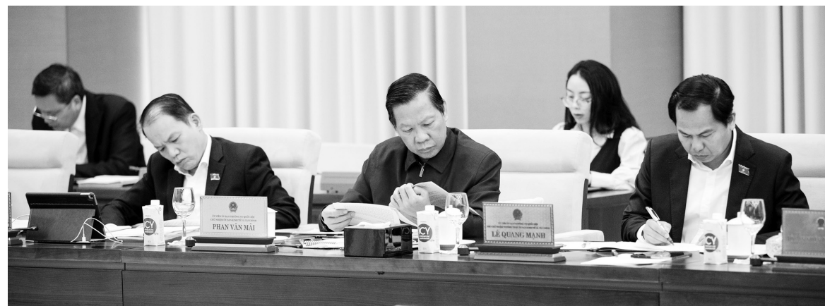
Các thành viên Ủy ban Thường vụ Quốc hội và khách mời tham dự phiên họp

Đồng thời, cần nghiên cứu, tiếp thu, chỉnh lý ý kiến của các cơ quan, đặc biệt về phân loại hàng hóa giữa các nhóm; nghiên cứu bổ sung quy định quản lý chất lượng sản phẩm, hàng hóa qua thương mại điện tử, nghiên cứu các hình thức hàng hóa vô hình ảnh hưởng đến văn hóa, đạo đức của con người... ■