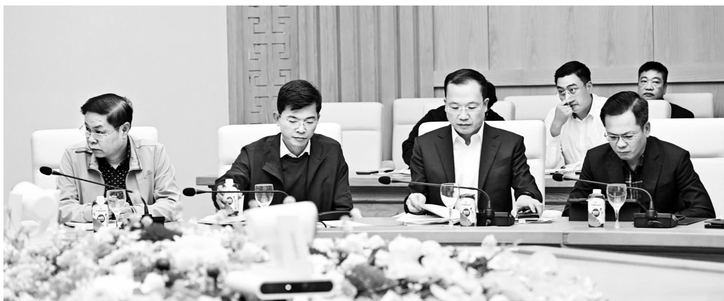
Đại diện các đơn vị tham dự buổi làm việc

Cục Kỹ thuật an toàn và Môi trường Công nghiệp chủ trì, phối hợp với các đơn vị của Bộ Nông nghiệp và Môi trường đề xuất nội dung điều chỉnh các quy trình liên hồ chứa phù hợp với thực tế, ưu tiên sử dụng tài nguyên nước cho phát điện. Vụ Pháp chế tiếp tục phối hợp với Cục Điện lực và NSMO để rà soát việc triển khai các công việc theo kết luận sau buổi làm việc. ■