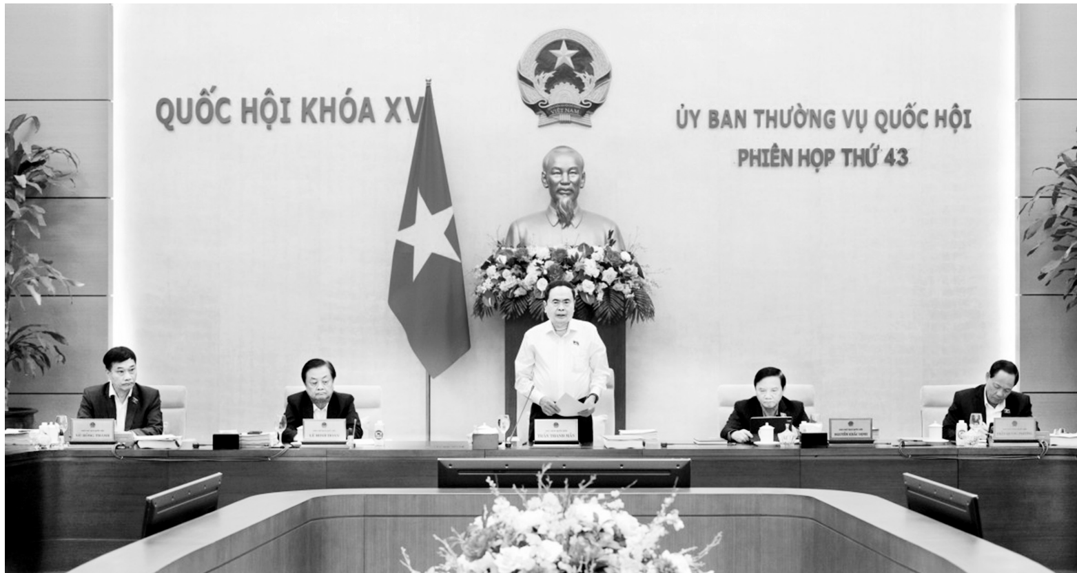
Chủ tịch Quốc hội Trần Thanh Mẫn phát biểu tại Phiên họp thứ 43 của Ủy ban Thường vụ Quốc hội