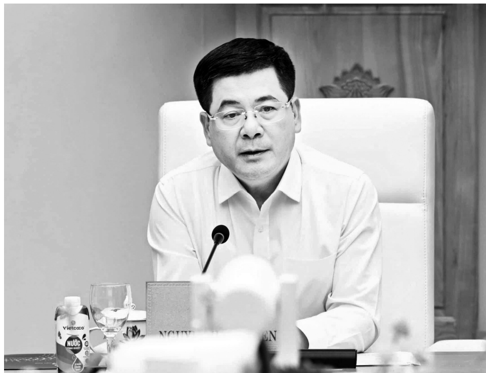
Bộ trưởng Bộ Công Thương Nguyễn Hồng Diên yêu cầu chủ đầu tư và các nhà thầu phải trực tiếp rà soát để hoàn thiện báo cáo về tình hình thực hiện dự án

là Bộ Nông nghiệp và Môi trường để nắm rõ các ý kiến và đồng bộ với các đề xuất của Bộ Công Thương trước khi tham mưu với Thủ tướng Chính phủ. Đồng thời, tham mưu, tư vấn Bộ Nông nghiệp và Môi trường trong việc điều phối liên hồ chứa tại các hồ chứa khác có liên quan đến hồ Hòa Bình để thực hiện những khâu khép kín ngay từ đầu..