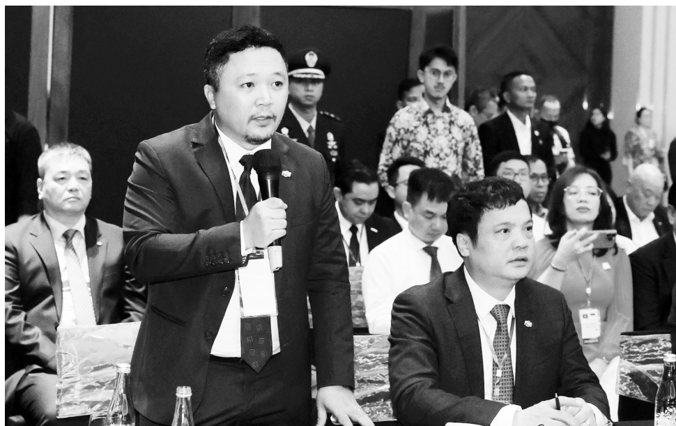
Đại diện doanh nghiệp dự tọa đàm phát biểu