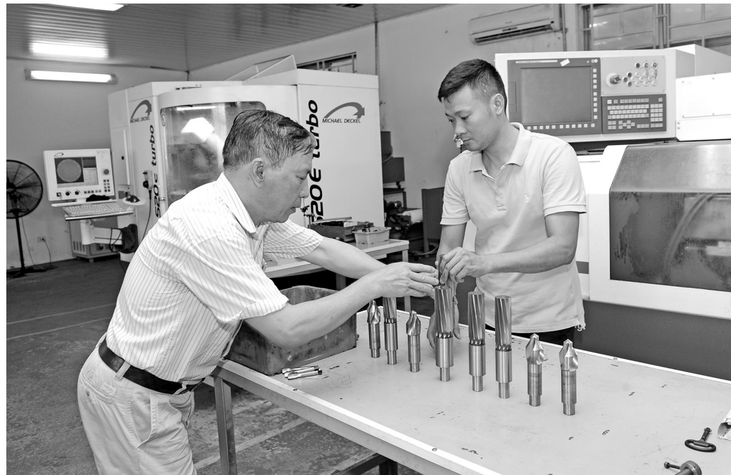
Ưu tiên phát triển công nghiệp hỗ trợ

Theo Bộ Công Thương, cả nước hiện có khoảng 5.000 doanh nghiệp chế biến tham gia cung cấp