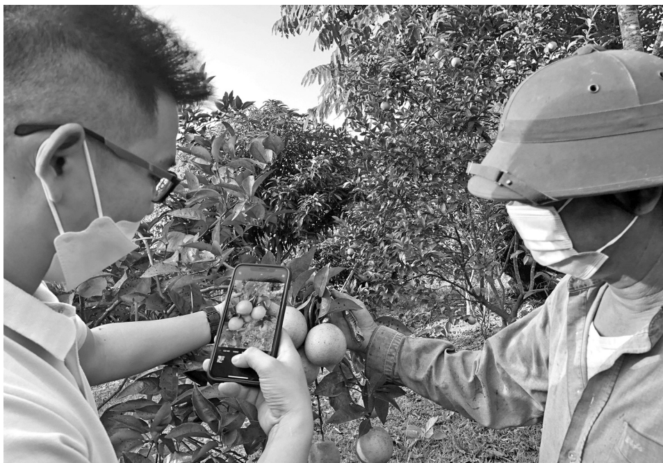
Tăng cường tiêu thụ sản phẩm cho bà con trên nền tảng thương mại điện tử

Năm 2025, Sở Công Thương Yên Bái sẽ phối hợp với các tổ chức và các đơn vị liên quan, triển khai nhiều hoạt động thiết thực để hỗ trợ doanh nghiệp, hợp tác xã, các hộ dân tham gia các chương trình của Cuộc vận động “Người Việt Nam ưu tiên dùng hàng Việt Nam”. Đồng thời, tổ chức các buổi tọa đàm, hội thảo giúp hợp tác xã, hộ nông dân trang bị kiến thức về thị trường, nâng cao kỹ năng xây dựng thương hiệu cho sản phẩm.