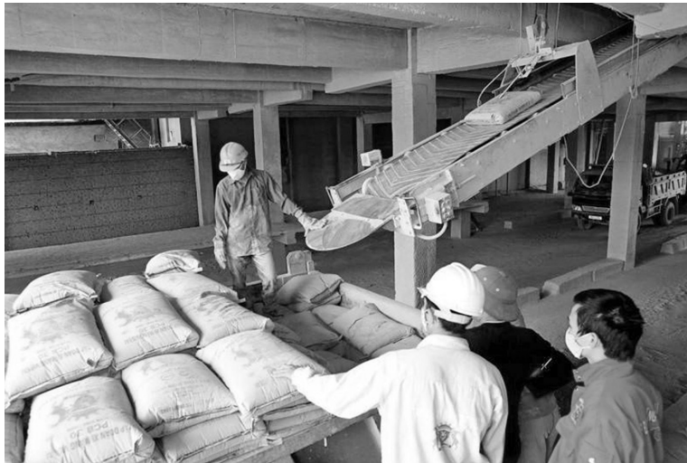
Nghị định 153 được đánh giá là chính sách tác động mạnh mẽ đến lượng phát thải trong quá trình sản xuất của doanh nghiệp