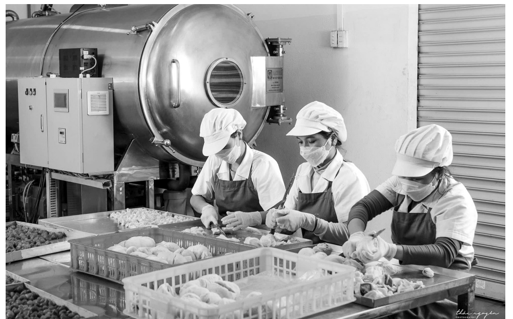
Để nâng cao chất lượng sản phẩm, các doanh nghiệp đẩy mạnh đầu tư công nghệ sản xuất