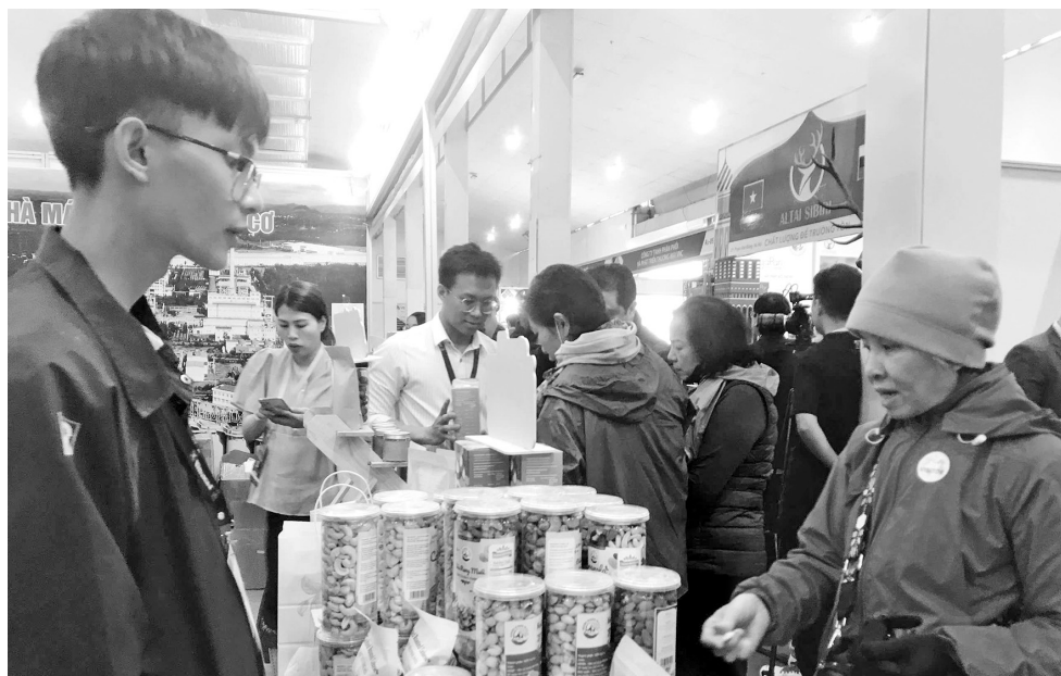
Sản phẩm mắc ca Tây Nguyên hút khách tại Vietnam Expo 2025

Sau 33 năm tổ chức, Vietnam Expo 2025 tiếp tục chứng minh vai trò cầu nối giữa doanh nghiệp và thị trường, giúp sản phẩm vùng dân tộc thiểu số và miền núi ngày càng vươn xa.