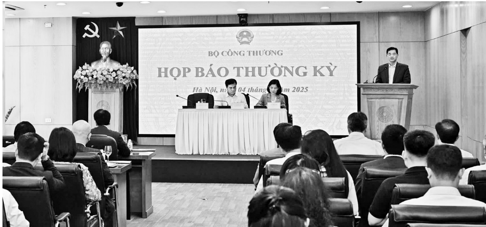
Toàn cảnh họp báo