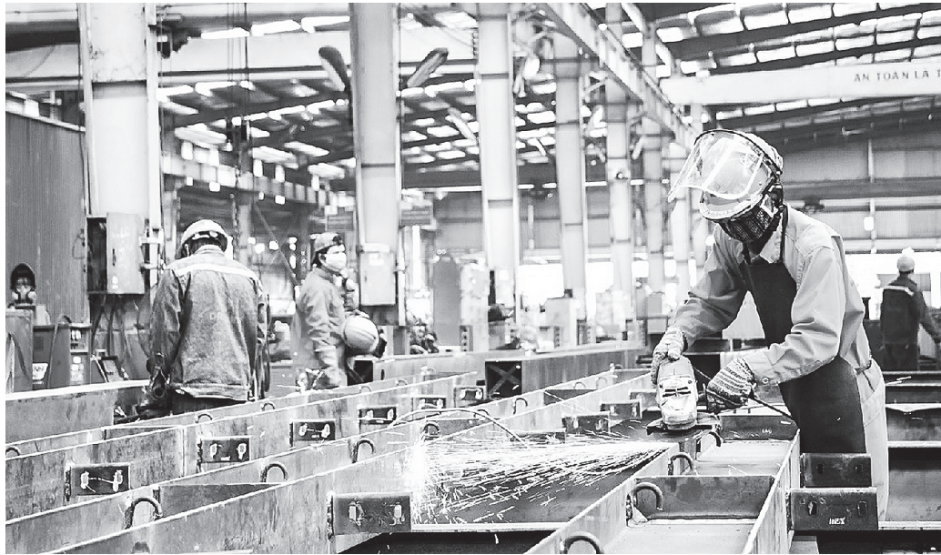
Hướng tới mục tiêu tăng trưởng bền vững, ngành sản xuất cần tập trung đẩy mạnh sản xuất xanh.

Đối với các doanh nghiệp (DN) trong ngành công nghiệp, đơn cử như Công ty TNHH Kangyin Electronic Technology, Khu công nghiệp Châu Sơn (TP. Phú Lý - Hà Nam) hoạt động trong lĩnh vực sản xuất các mặt hàng điện tử như camera hành trình trên xe ô tô, tai nghe điện thoại, dây sạc điện thoại, sạc dự phòng, tháng 3/2025 số lượng đơn hàng mới của Kangyin Electronic Technology tiếp tục có sự khởi sắc mạnh mẽ. Hiện, ngoài việc duy trì xuất khẩu sang một số thị trường truyền