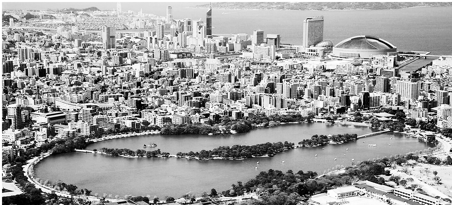
Toàn cảnh thành phố Fukuoka (Nhật Bản)

Sáp nhập tỉnh nếu được thực hiện bài bản, quyết đoán, có đồng thuận xã hội và tầm nhìn dài hạn sẽ là liều thuốc cải tổ mạnh mẽ cho quốc gia. Nó có thể tạo ra những siêu đơn vị hành chính có khả năng huy động nguồn lực, phân bổ hiệu quả, vận hành tinh gọn và thúc đẩy phát triển vùng một cách mạnh mẽ.