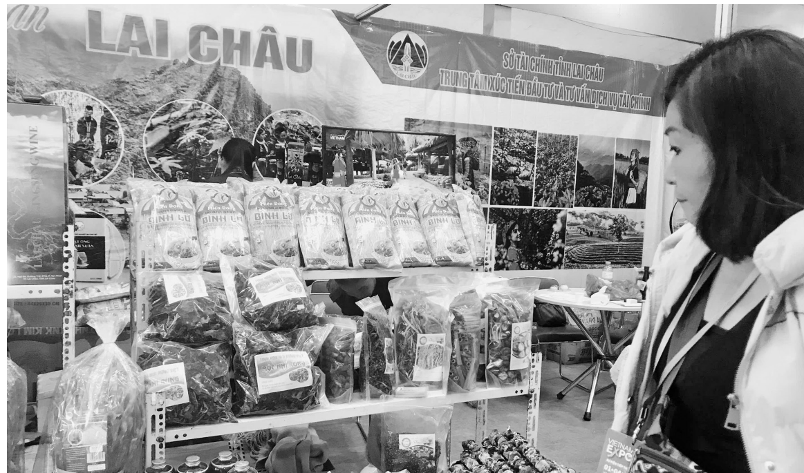
Sản phẩm vùng Tây Bắc tại Vietnam Expo 2025

Không chỉ Đắk Lắk, Đắk Nông cũng mang đến hội chợ những sản phẩm đặc trưng của đồng bào Tây Nguyên. Theo đó, Công ty TNHH Xuất nhập khẩu Maca Hills gây chú ý khi giới thiệu các sản phẩm mắc