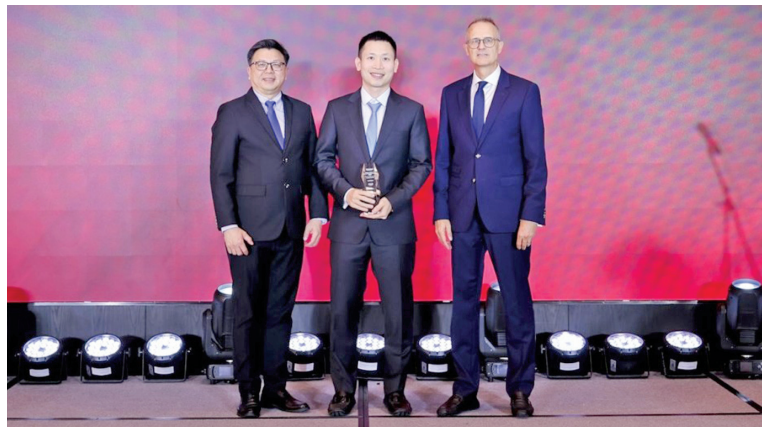
VietinBank tự hào được vinh danh "Ngân hàng SME tốt nhất Việt Nam" trong 5 năm liên tiếp

thực hiện việc giải ngân và phát hành bảo lãnh online 100% giúp chủ động trong việc thực hiện giao dịch mọi lúc, mọi nơi. VietinBank xây dựng 30 gói thuê bao bảo lãnh không giới hạn số lần phát hành bảo lãnh trong hạn mức của gói thuê bao, giúp doanh nghiệp tiết kiệm thời gian và chi phí khi sử dụng dịch vụ. Ngân hàng cũng cho ra mắt sản phẩm tiền gửi xanh để kết nối các doanh nghiệp có cùng chung mục tiêu phát triển bền vững, tạo ra dòng vốn xanh cho các dự án mang lại lợi ích cho môi trường, xã hội và cộng đồng. Đặc biệt,