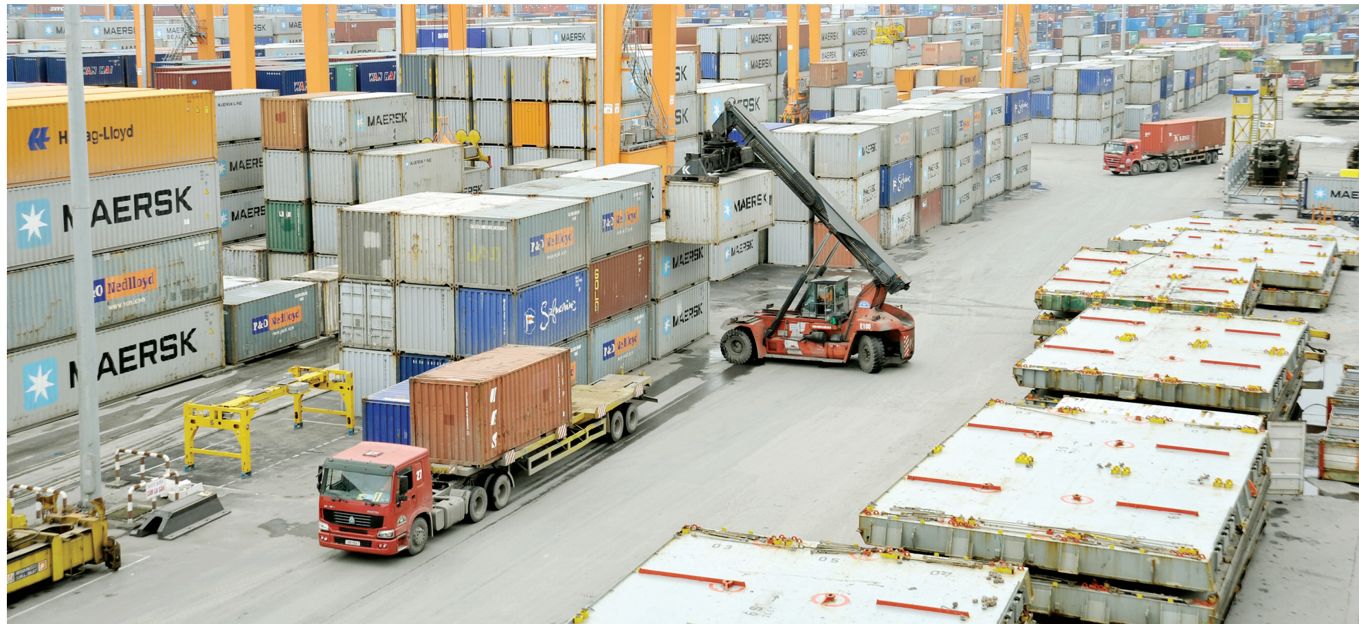
Năm 2025, Bộ Công Thương đặt mục tiêu xuất khẩu tăng trưởng khoảng 12%