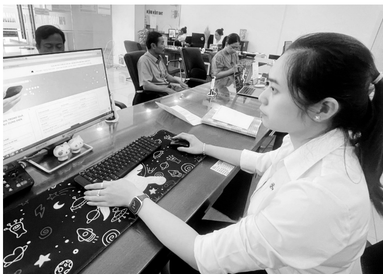
Nhân viên Điện lực Đồng Xoài, tỉnh Bình Phước hướng dẫn khách hàng sử dụng các dịch vụ điện trực tuyến

Để đạt được mục tiêu phát triển kinh tế số, Sở Công Thương tỉnh Bình Phước đã