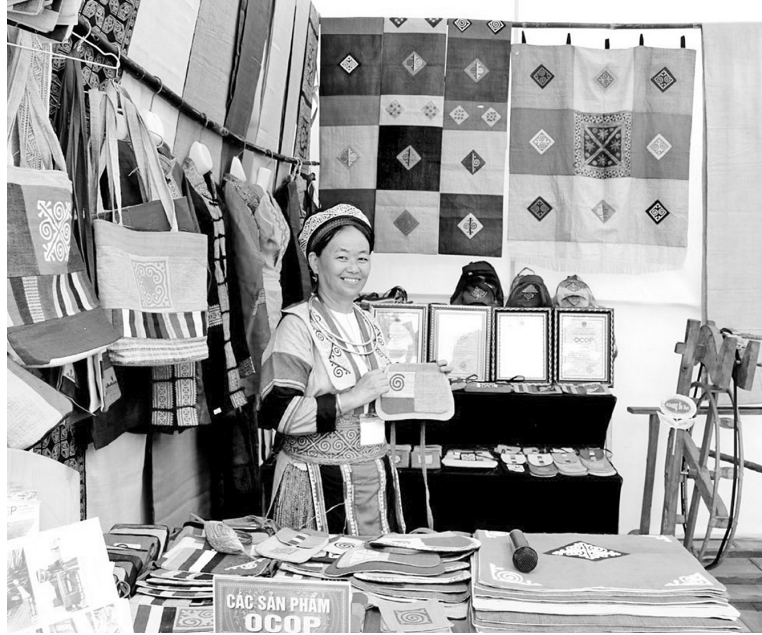
Sản phẩm lạnh OCOP của Hợp tác xã sản xuất vải lanh xã Cán Tỷ (huyện Quản Bạ) được giới thiệu trên các gian hàng thương mại điện tử

Đối với các sản phẩm nông sản, đến nay, huyện Xín Mần đã triển khai ứng dụng phần mềm đánh giá theo Bộ tiêu chí đánh giá phân hạng sản phẩm OCOP. Đồng thời, thực hiện xây dựng cơ sở dữ liệu và các phần mềm, ứng dụng chuyển đổi số trong xây dựng nông thôn mới để hỗ trợ đồng bào mở rộng thị trường tiêu thụ sản phẩm.