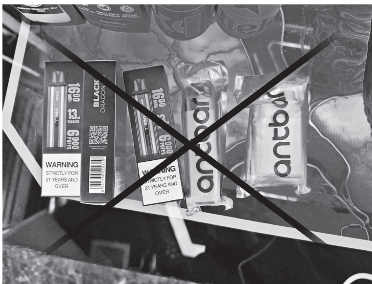
Thuốc lá điện tử xuất hiện tại các quán karaoke

Bên cạnh việc buôn bán, tình trạng sử dụng thuốc lá điện tử tại Việt Nam vẫn còn khá phổ biến, bất chấp lệnh cấm. Anh Q.V (Hà Nội) bộc bạch, dù đã giảm bớt tần suất sử dụng nhưng để bỏ hẳn, anh chưa thể làm được. "Dù đã cấm nhưng vẫn có nhiều người bán vì đã lỡ ôm hàng từ trước nên vẫn phải tìm đầu ra. Bởi vậy, tôi và bạn bè vẫn có thể tìm mua sản phẩm bằng hình