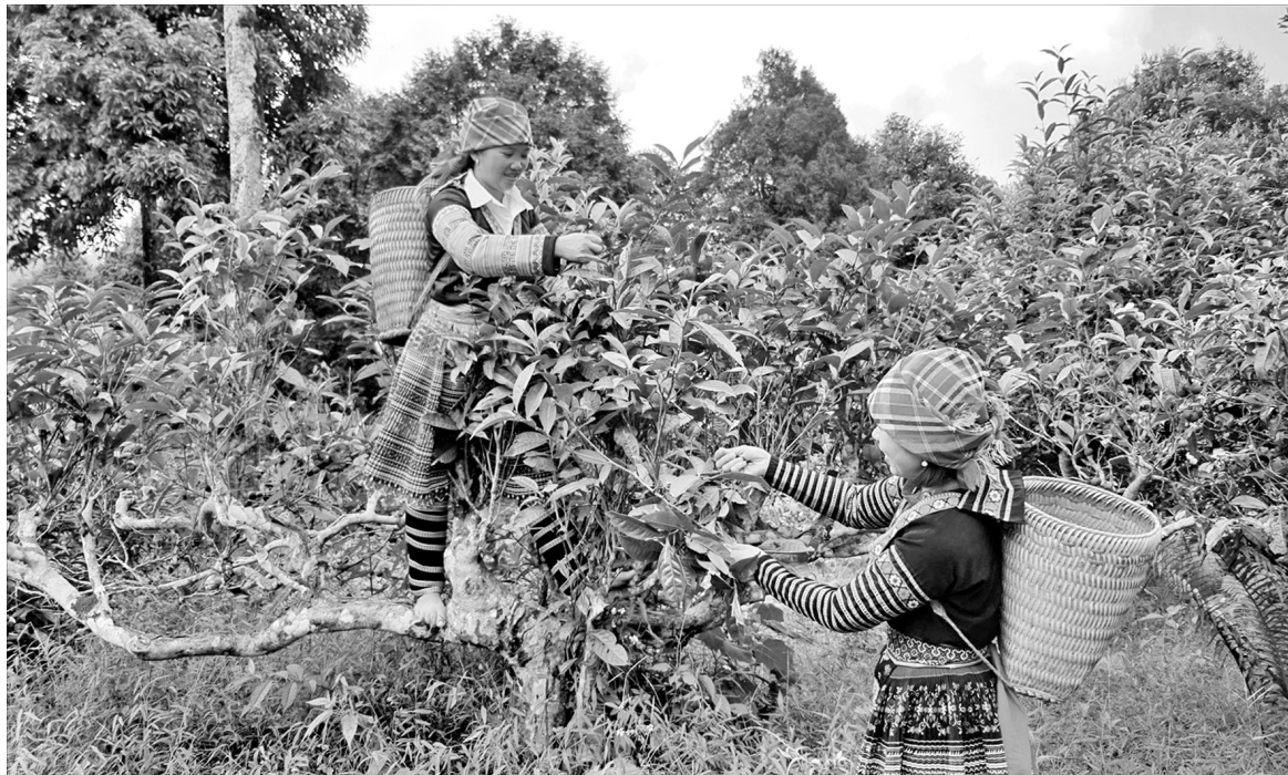
Chè Shan tuyết là sản phẩm đặc trưng của bà con dân tộc Mông, Dao tỉnh Lào Cai.