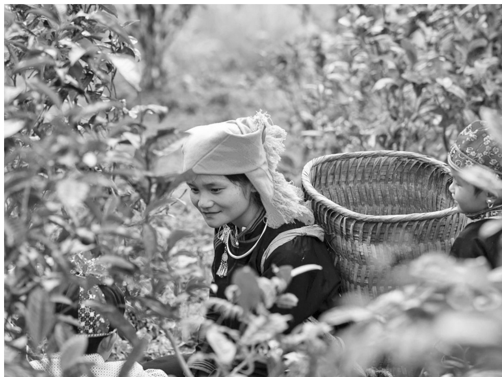
Lào Cai định hướng phát triển du lịch từ cây chè cổ thụ