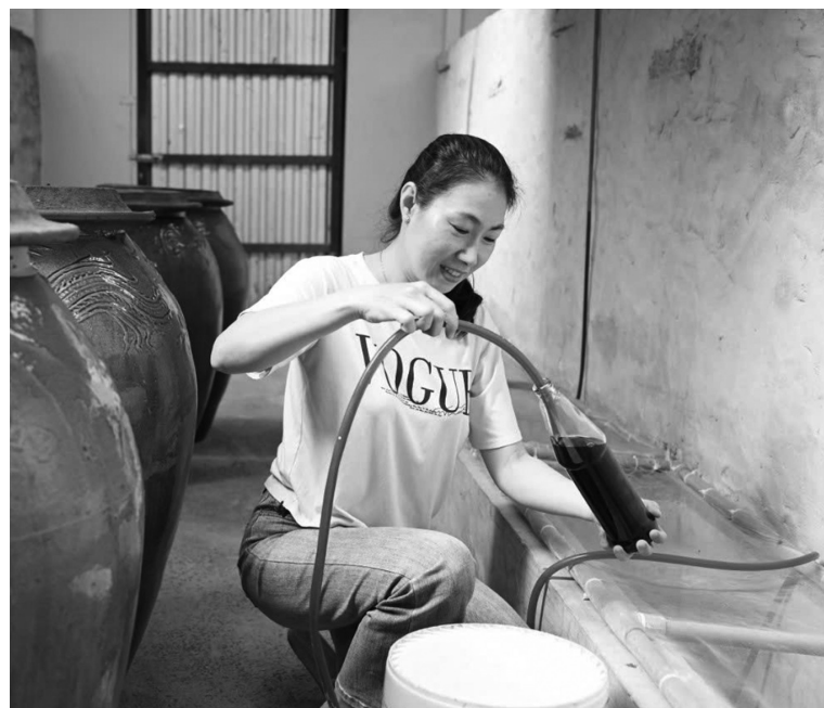
Kiên Giang dành 1,8 tỷ đồng triển khai kế hoạch khuyến công địa phương đợt I/2025