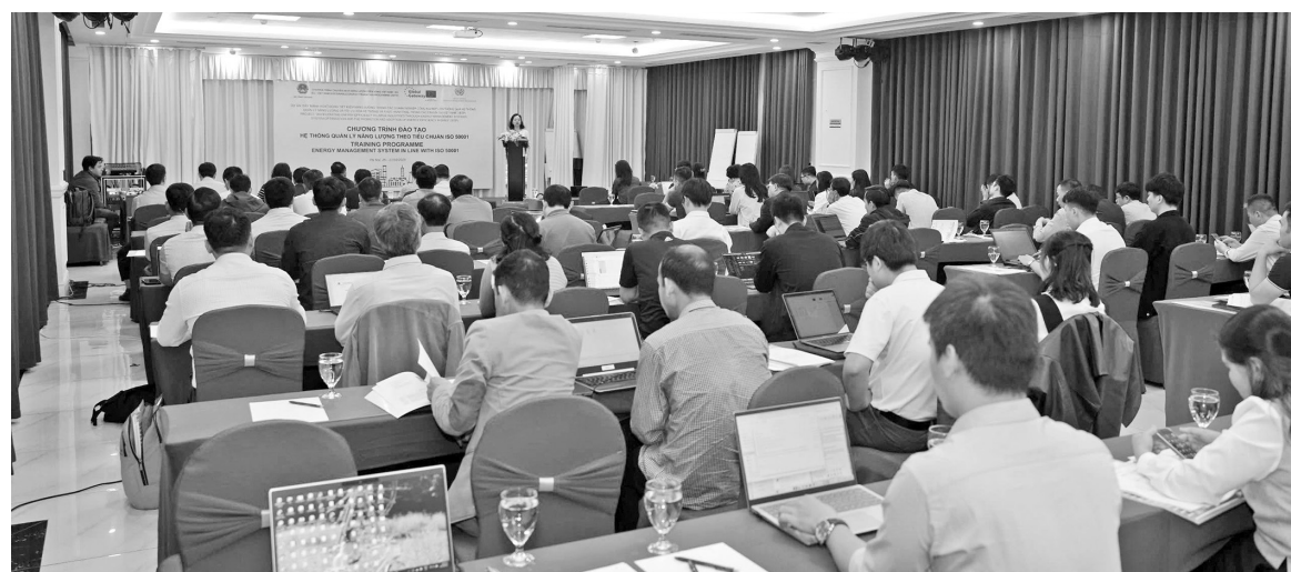
Một chương trình đào tạo nâng cao kiến thức chuyên ngành

Nhằm đáp ứng yêu cầu hội nhập kinh tế quốc tế, cuộc Cách mạng công nghiệp 4.0, thích ứng với bối cảnh mới, ngành Công Thương đang tiếp tục đẩy mạnh công tác đào tạo, bồi dưỡng cán bộ, công chức, viên chức (CBCCVC).