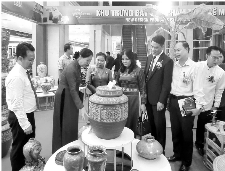
Sản phẩm công nghiệp nông thôn tiêu biểu của Hà Nội vượt trội cả về chất và lượng

Như năm vừa qua, tại Hội chợ Công nghiệp, Thương mại vùng Đồng bằng sông Cửu Long - Tiền Giang, Hà Nội tham gia