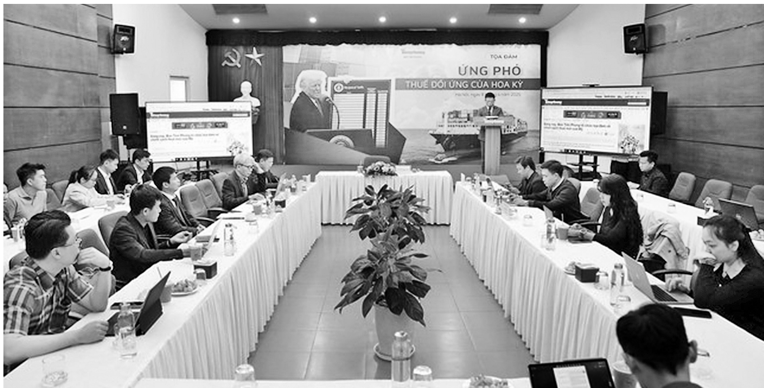
Toàn cảnh tọa đàm

Trước tác động từ thuế đối ứng của Hoa Kỳ, Bộ Tài chính đã chủ động đề xuất loạt chính sách nhằm hỗ trợ doanh nghiệp và tạo sức bật cho nền kinh tế. Đó là, tăng cường kiểm soát gian lận thuế xuyên quốc gia; xây dựng cơ sở dữ liệu chia sẻ với đối tác..., góp phần củng cố niềm tin và thúc đẩy đàm phán song phương.