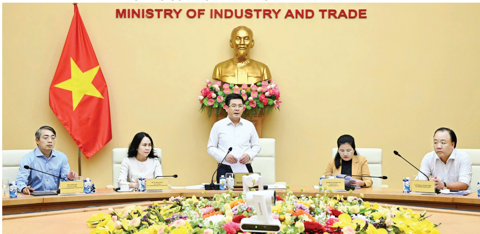
Bộ trưởng Bộ Công Thương Nguyễn Hồng Diên chủ trì hội nghị