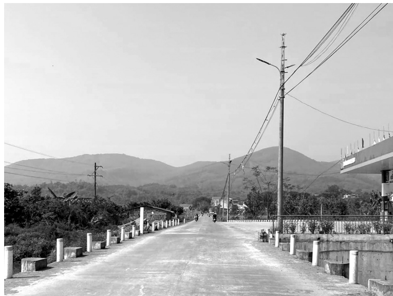
Hệ thống lưới điện nông thôn cơ bản đáp ứng nhu cầu phát triển kinh tế - xã hội của địa phương

Trước thực trạng đó, ngành Công Thương đang đẩy mạnh thu hút, bố trí các nguồn vốn, đồng thời ứng dụng năng lượng tái tạo, năng lượng mới để từng bước hiện đại hóa lưới điện nông thôn. Song song, các đơn vị chức năng tăng cường kiểm tra, giám sát hoạt động của các tổ chức quản lý điện, yêu cầu thực hiện đúng quy định pháp luật về phân phối, bán lẻ điện và đầu tư hạ tầng. Các công trình đã đạt tiêu chí nhưng có dấu hiệu xuống cấp cũng sẽ được rà soát và cải tạo kịp thời.