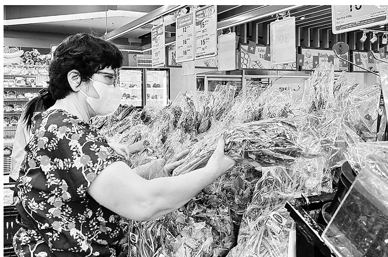
Tổng mức bán lẻ hàng hoá và doanh thu dịch vụ tiêu dùng đã tăng 9,9% trong quý I/2025.

Doanh thu du lịch lữ hành quý I/2025 ước đạt 21,5 nghìn tỷ đồng, chiếm 1,3% tổng mức và tăng 18,3% so với cùng kỳ năm trước. Doanh thu dịch vụ lữ hành quý I/2025 của một số địa phương tăng cao so với cùng kỳ năm trước như sau: Hà Nội tăng 23,5%; Đà Nẵng tăng 22,1%; Quảng Ninh tăng 20,9%; Bình Dương tăng 19,3%; TP. Hồ Chí Minh tăng 15,1%; Hải Phòng tăng 9,1%.