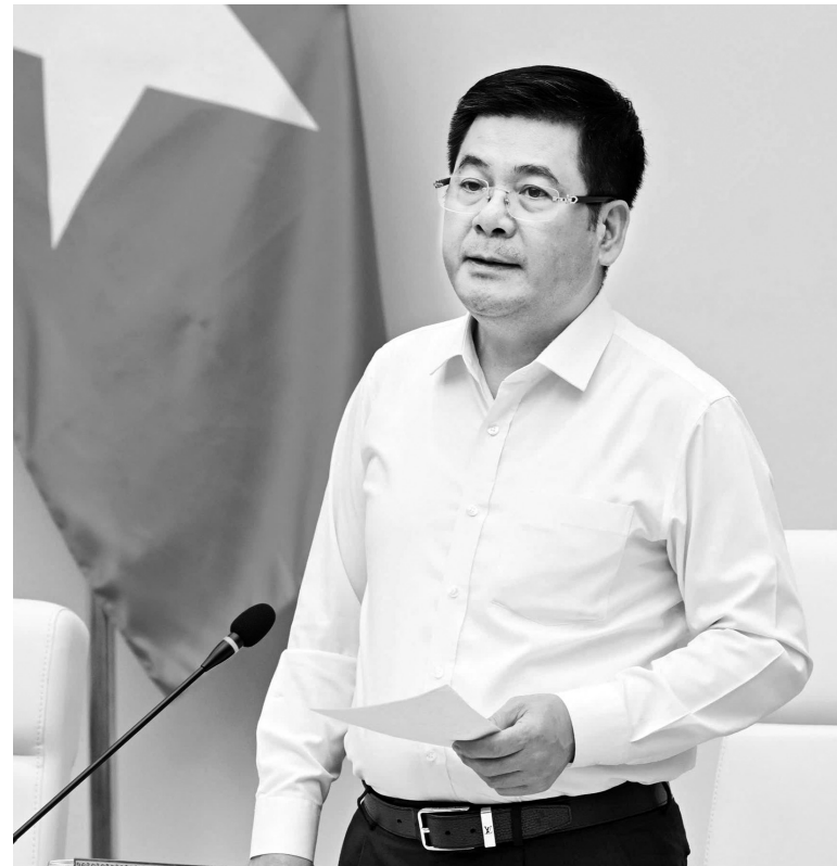
Bộ trưởng Bộ Công Thương Nguyễn Hồng Diên phát biểu chỉ đạo tại hội nghị