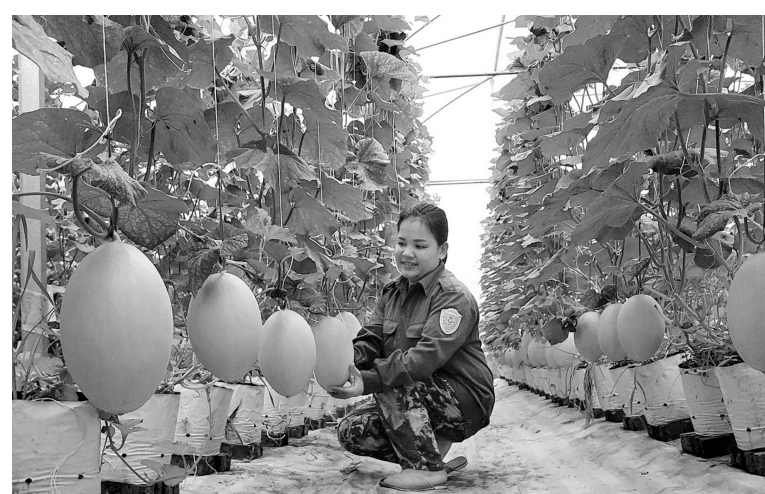
Hợp tác xã Dương Quang đã ứng dụng công nghệ cao vào sản xuất dưa lưới

Để giải quyết vấn đề này, tỉnh Bắc Kạn đã hỗ trợ các hợp tác xã đầu tư vào hệ thống điều khiển trung tâm kết nối với các thiết bị như hệ thống tưới tự động, hệ thống kiểm soát nhiệt độ, độ ẩm, pH... Từ đó, giúp sản phẩm chè và dưa lưới của các hợp tác xã này đạt chất lượng ổn định,