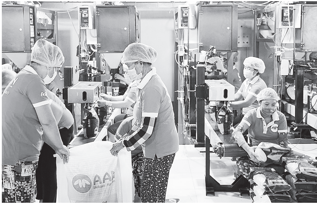
Chế biến gạo xuất khẩu

Tại thị trường trong nước, nhiều doanh nghiệp đã trừ gạo tương đối lớn để đàm phán giá với đối tác. Tín hiệu tốt từ thị trường và chất lượng gạo vụ Đông Xuân là tốt nhất trong năm nên các doanh nghiệp xuất khẩu cũng không vội chốt đơn.