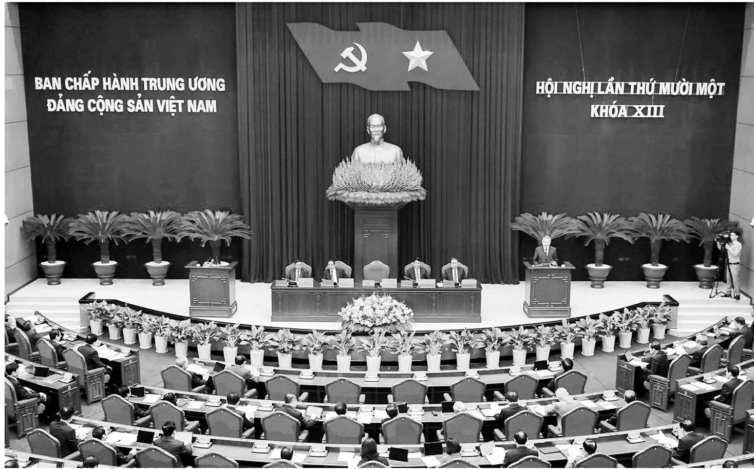
Toàn cảnh Hội nghị lần thứ 11 Ban Chấp hành Trung ương Đảng khóa XIII