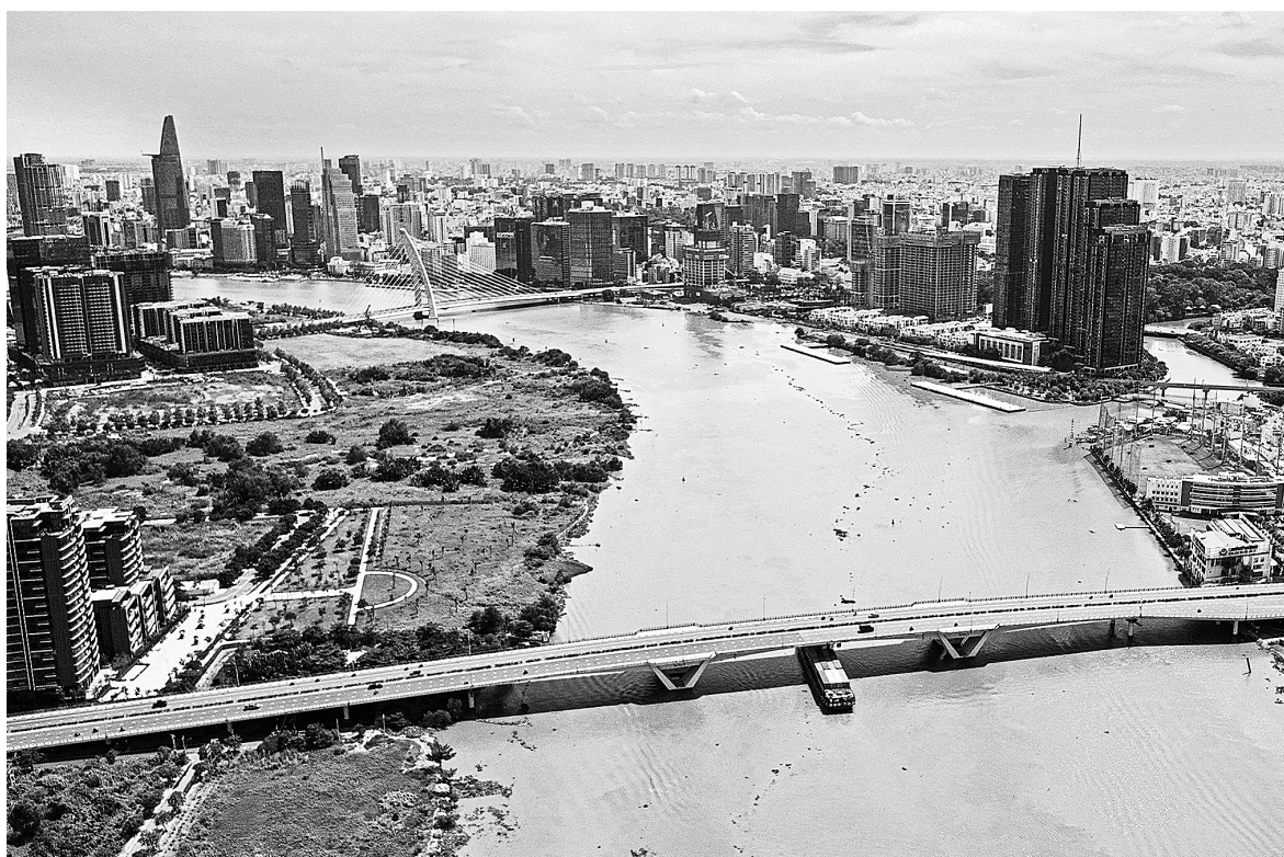
Sáp nhập tỉnh sẽ giúp mở rộng không gian phát triển

Thực tế thời gian qua cho thấy, việc sáp nhập, mở rộng địa giới hành chính đã mang lại không gian phát triển rõ rệt ở nhiều địa phương. Sáp nhập tỉnh không chỉ là việc gộp địa lý đơn thuần, mà là một tư duy chiến lược dài hạn. Trong bối cảnh nguồn lực đất nước có hạn, việc tái cơ cấu lại địa giới hành chính, nâng cao hiệu quả quản lý là điều tất yếu. ■