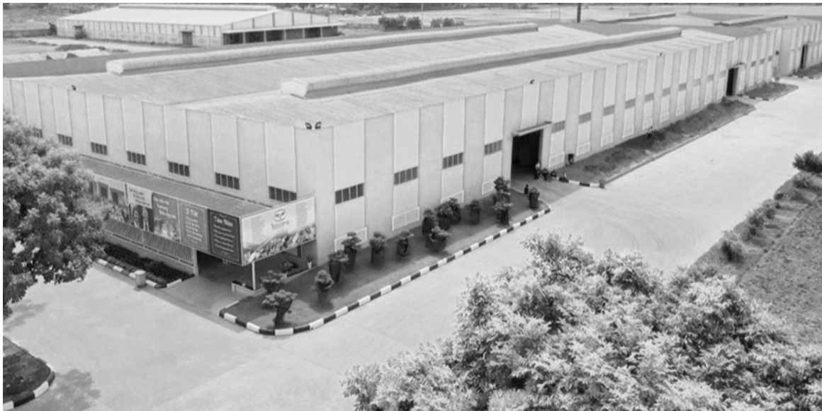
Nhà máy dinh dưỡng cây trồng Tiên Nông Bim Sơn được công nhận là mô hình kinh tế không phát thải ra môi trường