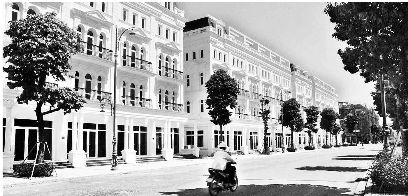
Nhiều căn biệt thự liền kề được cho thuê với giá rẻ