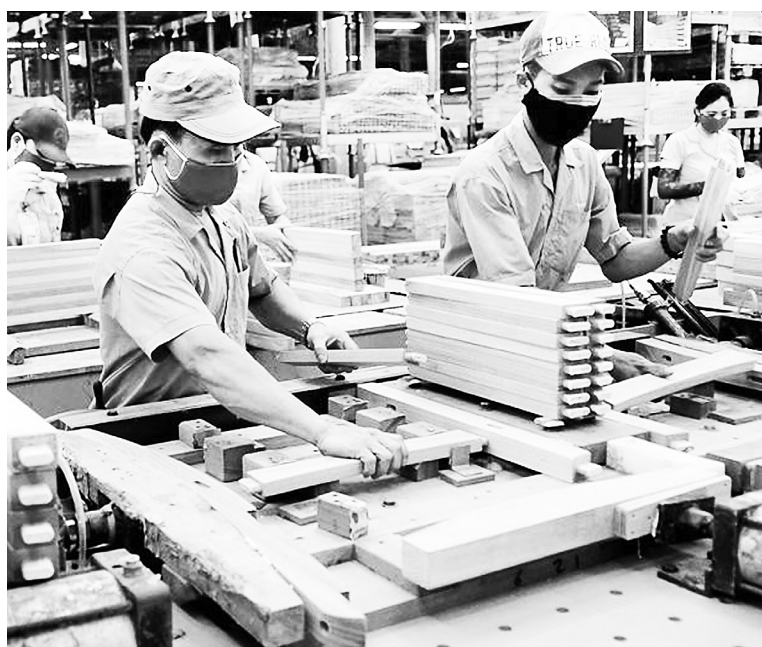
Quý I/2025, giá trị xuất khẩu gỗ và sản phẩm gỗ đạt 3,95 tỷ USD, tăng 11,6% so với cùng kỳ năm 2024

Tuy nhiên, ngành gỗ đang phải đối mặt với những thách thức lớn yêu cầu phải có chiến lược