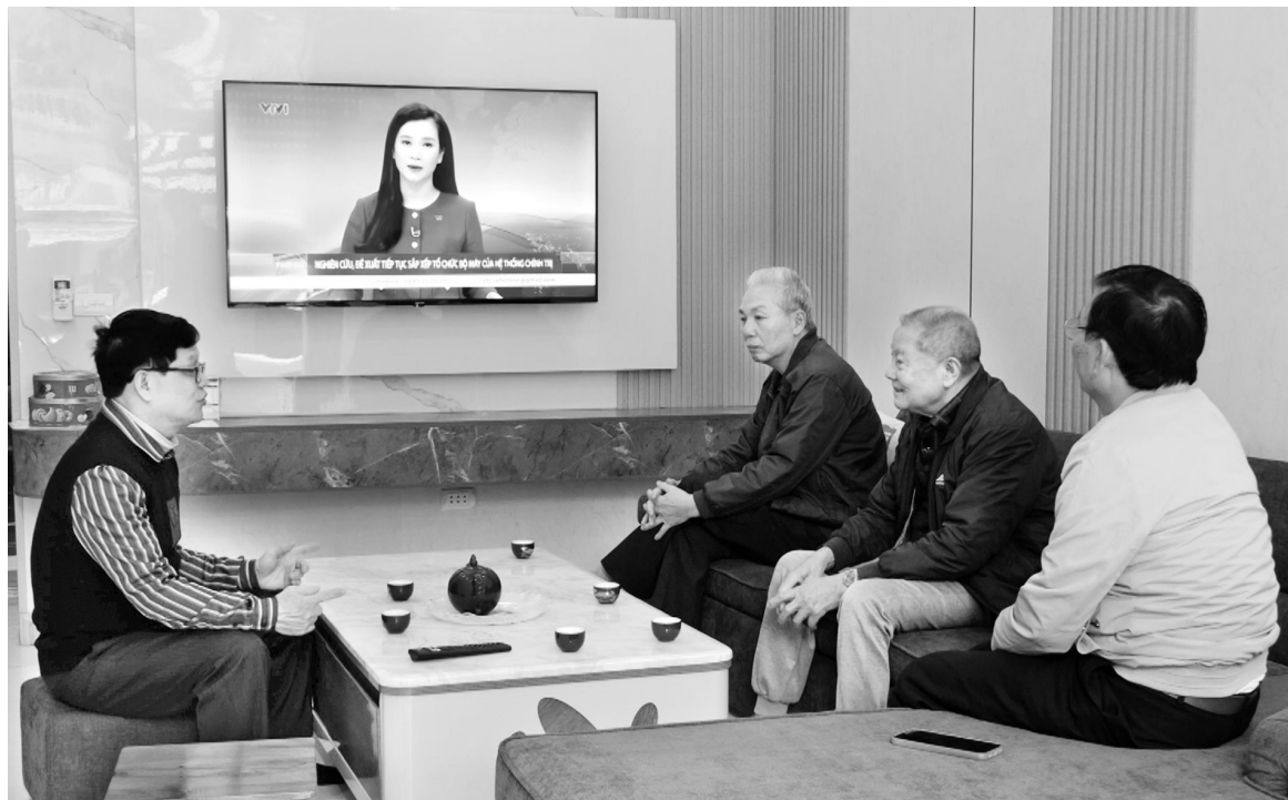
Nhân dân Lào Cai quan tâm tới chủ trương sáp nhập tỉnh

Những luận điệu xuyên tạc của các thế lực thù địch đó sẽ không thể lay chuyển lòng tin của người dân. Bởi lẽ, chúng đã cố tình quên một điều đơn giản: Chính người dân mới là những người hiểu rõ nhất lợi ích của mình, và họ đã tin tưởng, ủng hộ mạnh mẽ chủ trương của Đảng về cuộc cách mạng tinh gọn bộ máy.