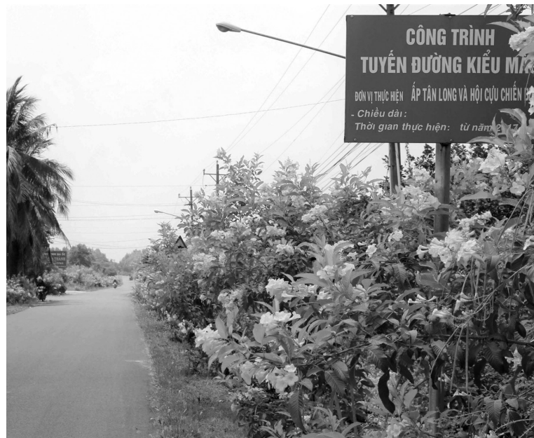
Những tuyến đường hoa rực rỡ ở "Làng thông minh" Bạch Đằng

Tỉnh cũng lựa chọn từ 1 đến 2 xã để triển khai mô hình thí điểm "xã NTM thông minh", "xã thương mại điện tử", đảm bảo đáp ứng các mục tiêu đề ra trong Chương trình chuyển đổi số xây dựng NTM thông minh giai đoạn 2021-2025.