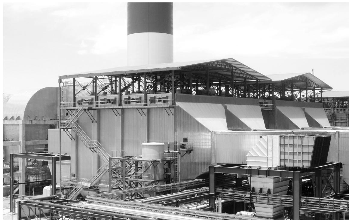
Hệ thống lọc bụi tĩnh điện tại Nhà máy nhiệt điện Thái Bình 1 do Viện Nghiên cứu Cơ khí cung cấp

Quyết định số 19 92/QĐ-BCT đặt ra mục tiêu đến năm 2030, triển khai thành công ít nhất 30 dự án công nghệ cao ứng dụng trong công nghiệp, có tinh lan toả về mặt KH&CN và kinh tế - xã hội.