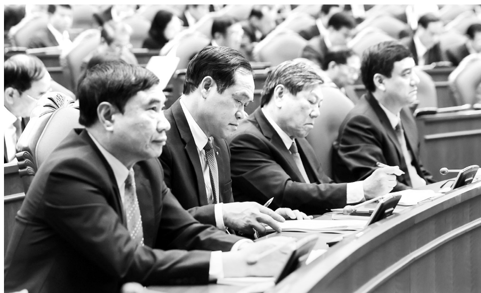
Các đại biểu dự hội nghị

Cụ thể, Tổng Bí thư đề nghị Trung ương tập trung cho ý kiến về việc sắp xếp đơn vị hành chính cấp tỉnh còn 34 tỉnh, thành phố; không tổ chức cấp huyện; giảm khoảng 50% đơn vị hành chính cấp xã. Đây là bước đi lớn, đồng thời là thách thức trong việc tái cấu trúc mô hình chính quyền, gắn với