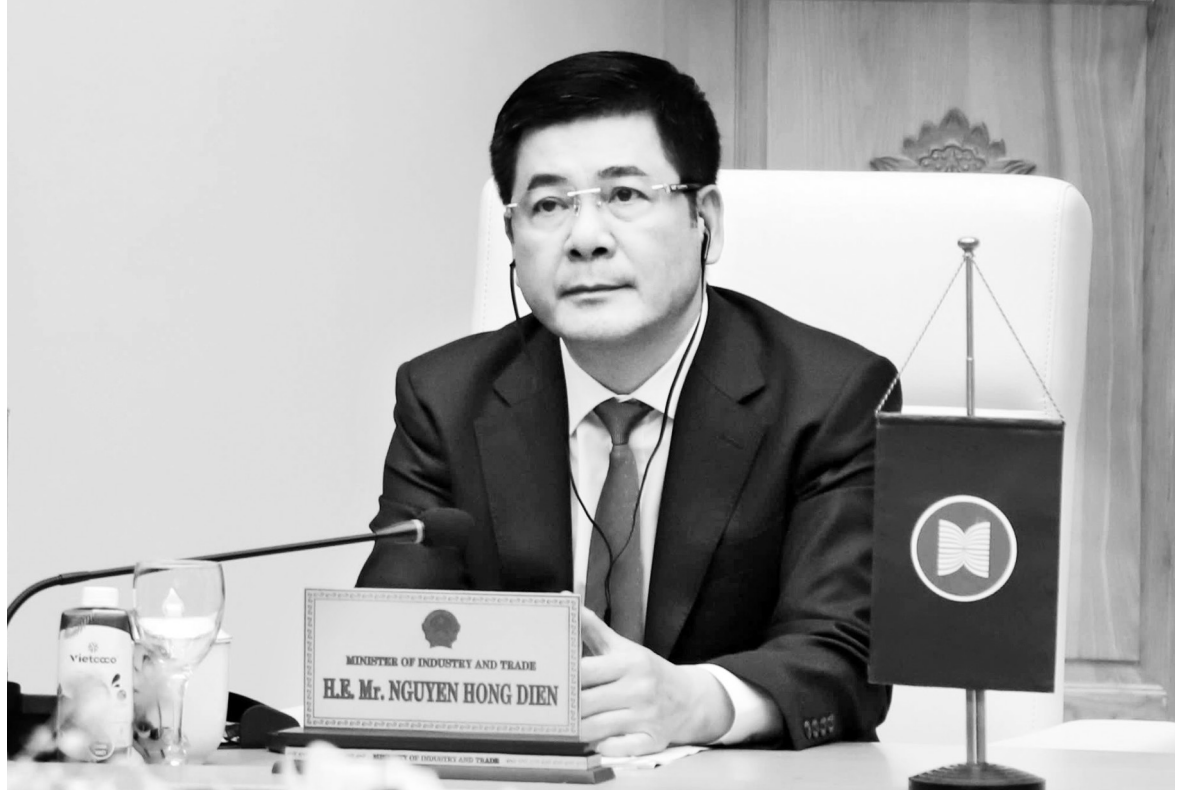
Đoàn Việt Nam tham dự hội nghị do Bộ trưởng Bộ Công Thương Nguyễn Hồng Diên làm Trưởng đoàn

Sau khi trao đổi trên tinh thần thẳng thắn, cởi mở và hợp tác, các Bộ trưởng đã nhất trí thông