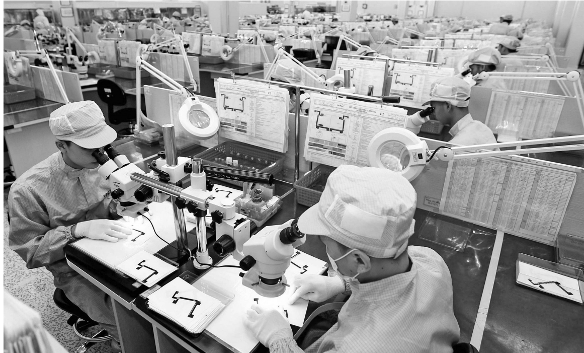
Hoạt động nghiên cứu công nghệ cao