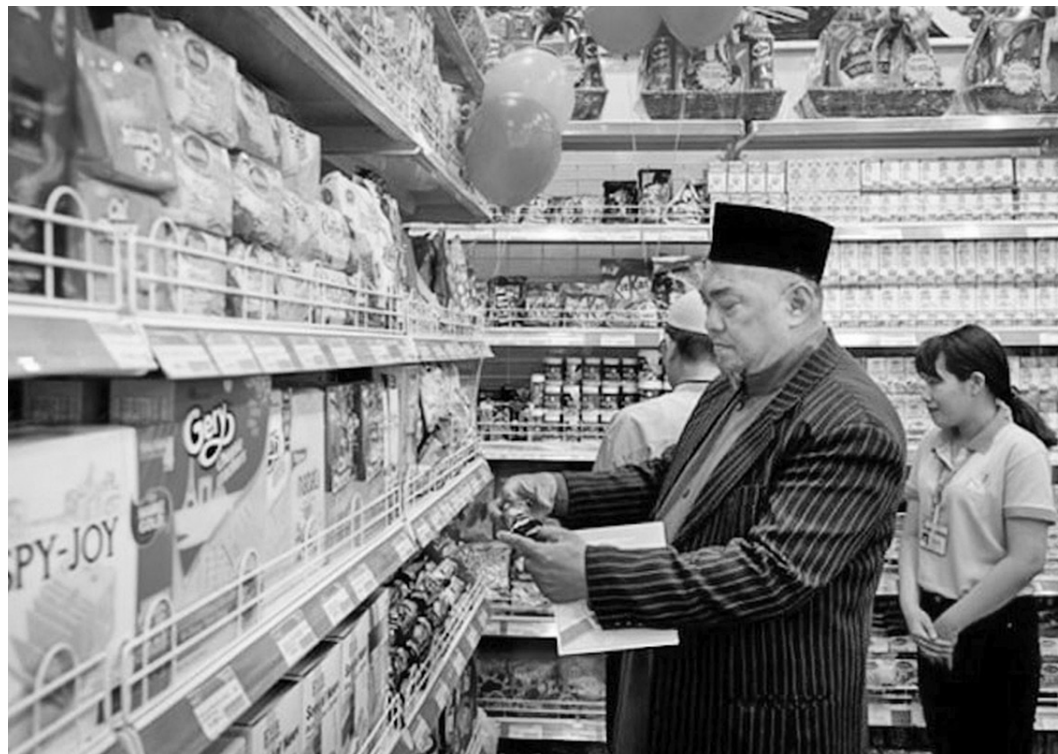
Một cửa hàng tiện lợi được chứng nhận Halal tại TP. Hồ Chí Minh

"Tiêu chuẩn Halal là một cam kết về niềm tin. Muốn đạt được điều đó, cần có hệ sinh thái đầy đủ từ công ty chứng nhận, nhà sản xuất đạt chuẩn, hệ thống phân phối