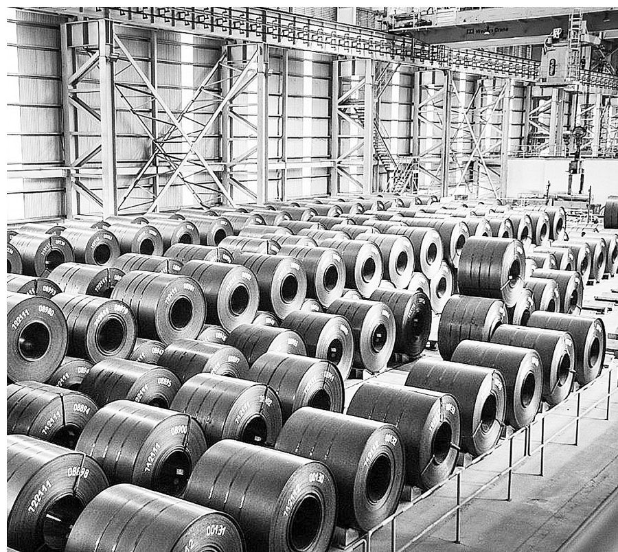
EU đang siết chặt nhập khẩu nhiều mặt hàng, trong đó có thép

Những tác động từ EVFTA giúp hàng Việt Nam có chỗ đứng tốt hơn ở EU, song cũng tiềm ẩn nhiều nguy cơ hàng hóa bị mượn xuất xứ. Sự thận trọng và chủ động vào thời điểm này không chỉ giúp bảo vệ thị trường xuất khẩu sang EU mà còn giữ gìn uy tín hàng Việt Nam trên trường quốc tế trong bối cảnh thị trường toàn cầu đang đầy biến động. ■