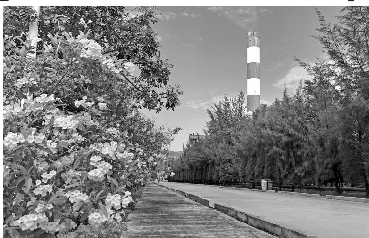
Hệ thống cây xanh được trồng xung quanh và trong khuôn viên Nhà máy Nhiệt điện Vinh Tân

Đồng thời, khuôn viên công ty đã được phủ xanh bằng hàng rào cây dương bao quanh khu vực kho than, gian máy, cảng than, dọc các tuyến đường nội bộ, kênh nước hồ của nhà máy. "Hiện, chúng tôi đã trồng được 20.000 cây xanh và hơn 102.000m 2 cỏ cảnh, giúp tạo không gian xanh, tươi mát, cũng như cải thiện điều kiện làm việc, bảo vệ môi trường