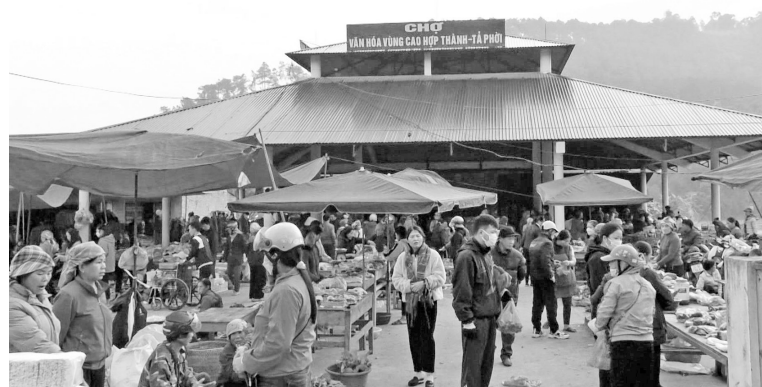
Chợ văn hóa vùng cao Hợp Thành - Tà Phời

địa bàn tỉnh có 15 chợ ở khu vực biên giới (4 chợ biên giới và 11 chợ trong khu kinh tế cửa khẩu), 26 cửa hàng bán lẻ xăng dầu và chuỗi cửa hàng tự chọn, cửa hàng tiện ích, cửa hàng tổng hợp, siêu thị mini... đang hoạt động đạt hiệu quả cao. Qua đó, góp phần tích cực trong quá trình phát triển kinh tế - xã hội khu vực biên giới giữa Lào Cai (Việt Nam) và Vân Nam (Trung Quốc). Đồng