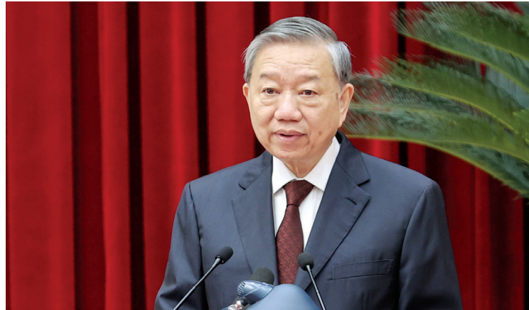
Tổng Bí thư Tô Lâm phát biểu khai mạc hội nghị