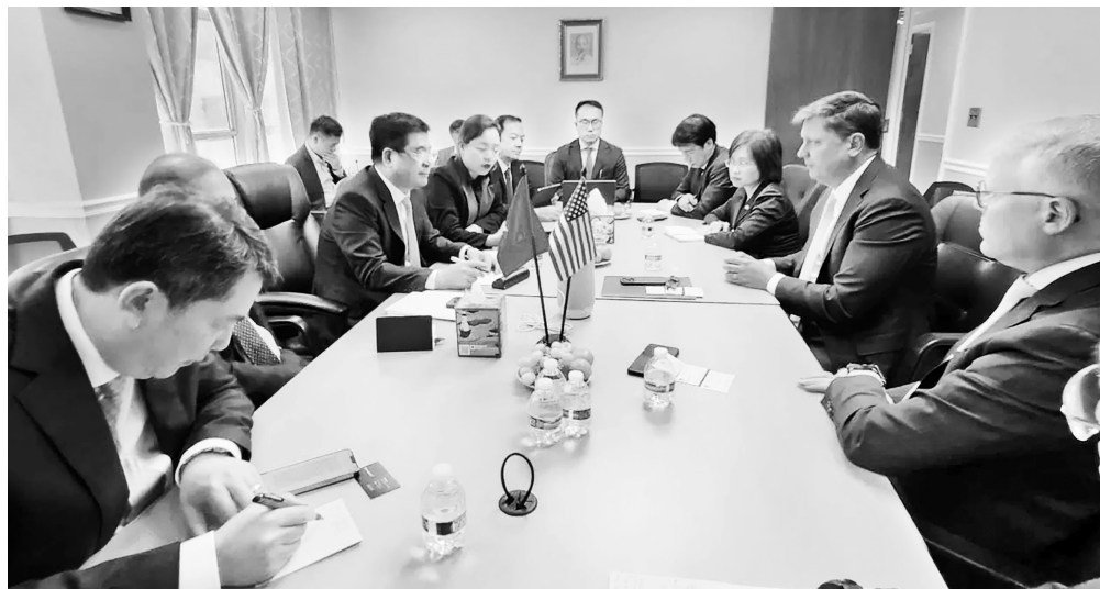
Bộ trưởng Nguyễn Hồng Diên - Trưởng Đoàn đàm phán Chính phủ cùng đoàn công tác làm việc với lãnh đạo Tập đoàn SpaceX để trao đổi về hợp tác công nghệ trong lĩnh vực hàng không, vũ trụ