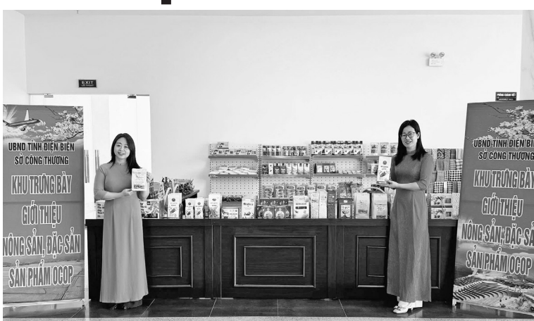
Nhiều điểm trưng bày, giới thiệu và bán sản phẩm OCOP Điện Biên đã được Sở Công Thương triển khai hiệu quả

Ngoài ra, Sở Công Thương còn đẩy mạnh ứng dụng