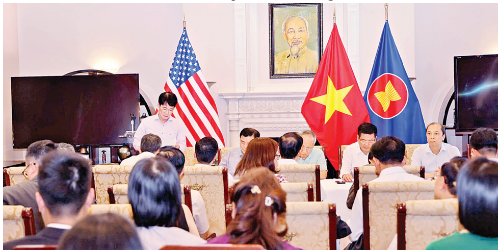
Bộ trưởng Nguyễn Hồng Diên - Trưởng Đoàn đàm phán Chính phủ chủ trì họp với các thành viên đoàn

• Trong các phiên đàm phán trực tiếp cấp Bộ trưởng, cấp kỹ thuật về Hiệp định song phương về thương mại đối ứng giữa Việt Nam và Hoa Kỳ, hai bên thống nhất cao các vấn đề về nguyên tắc, cách tiếp cận, định hướng nội dung và kế hoạch đàm phán... Trang 3