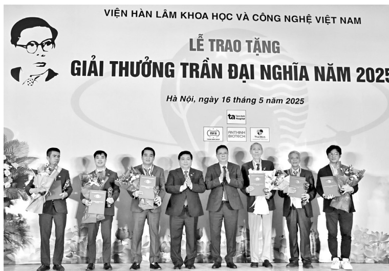
Năm 2025, Giải thưởng Trần Đại Nghĩa đã được trao cho 2 công trình khoa học tiêu biểu

Phát biểu tại lễ trao Giải thưởng Trần Đại Nghĩa, Phó Thủ tướng Nguyễn Chí Dũng nhấn mạnh, giải thưởng được tổ chức không chỉ là dịp tôn vinh những công trình khoa học xuất sắc, mà còn khẳng định vai trò quan trọng của