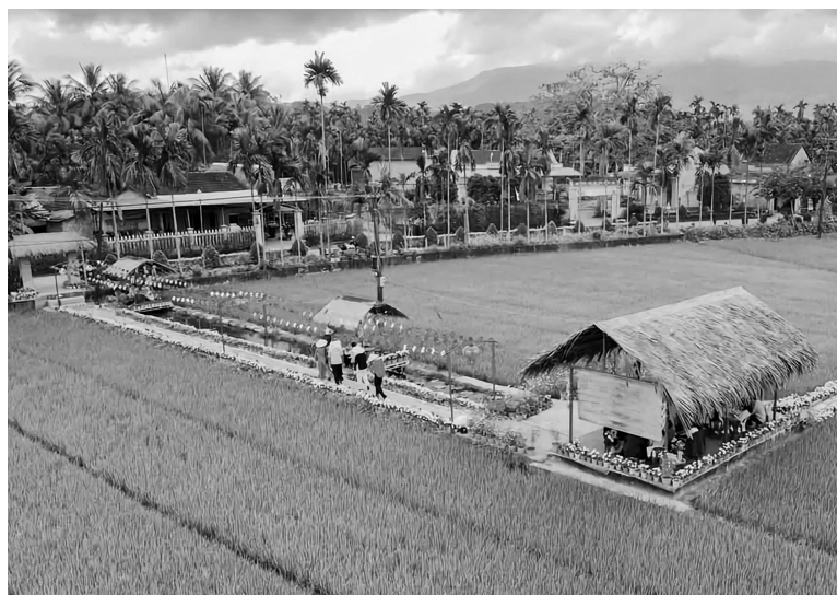
Mô hình du lịch nông thôn ở làng du lịch cộng đồng Bình Thành, xã Hành Nhân, huyện Nghĩa Hành

Huyện Lý Sơn triển khai mô hình "Một ngày làm nông dân đất đảo - Kỳ bí đảo núi lửa Lý Sơn", phát triển du lịch cộng