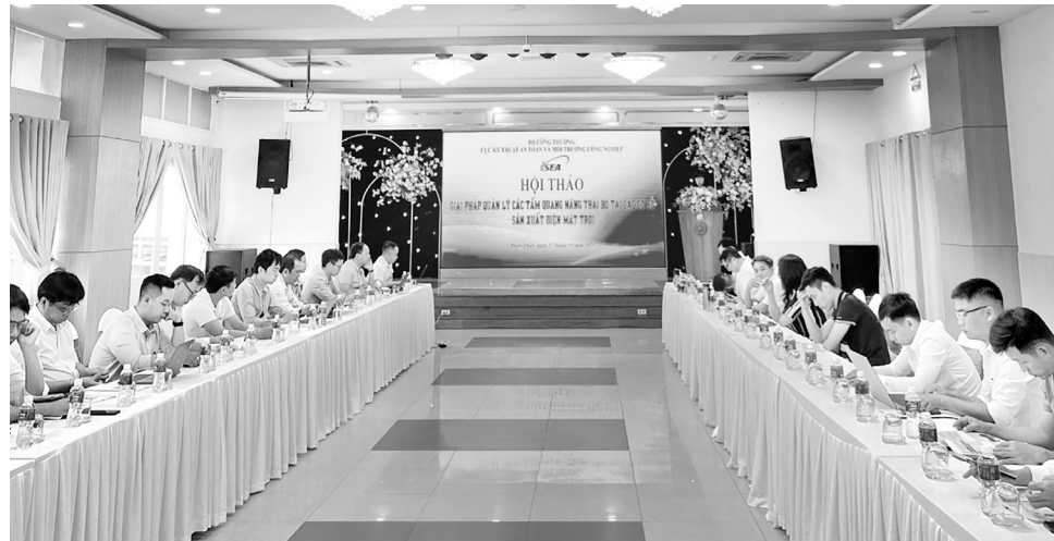
Bộ Công Thương tổ chức hội thảo giải pháp quản lý các tấm quang năng thải bỏ từ sản xuất điện mặt trời tại Bình Thuận