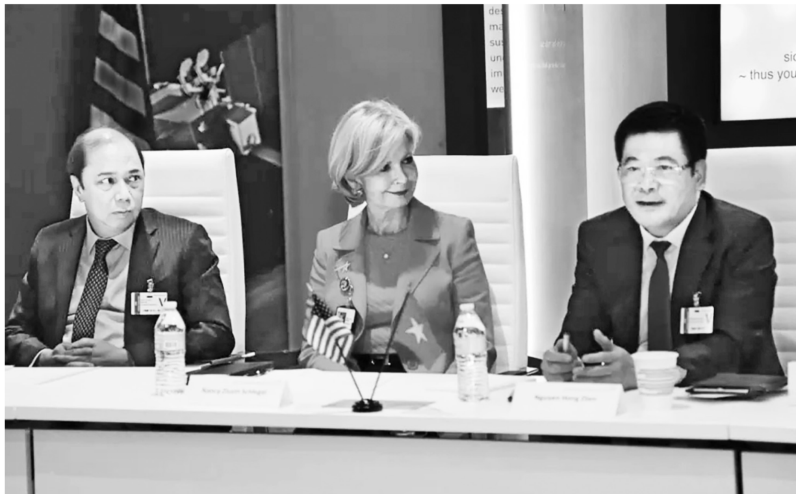
Bộ trưởng Nguyễn Hồng Diên cho biết, Việt Nam đánh giá cao việc hợp tác với Tập đoàn Lockheed Martin trong công nghiệp quốc phòng, hàng không vũ trụ