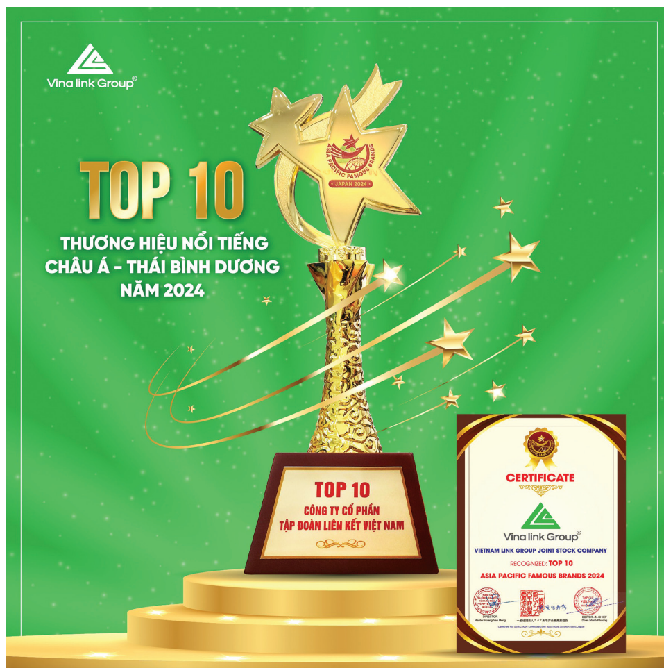
Vinalink Group giành giải thưởng “Top 10 thương hiệu nổi tiếng châu Á - Thái Bình Dương”

Công ty Cổ phần Tập đoàn Liên kết Việt Nam (Vinalink Group) – thương hiệu Việt gần 20 năm tuổi đang nỗ lực không ngừng trong việc đồng hành cùng cộng đồng và thích ứng với dòng chảy đổi mới của đất nước.