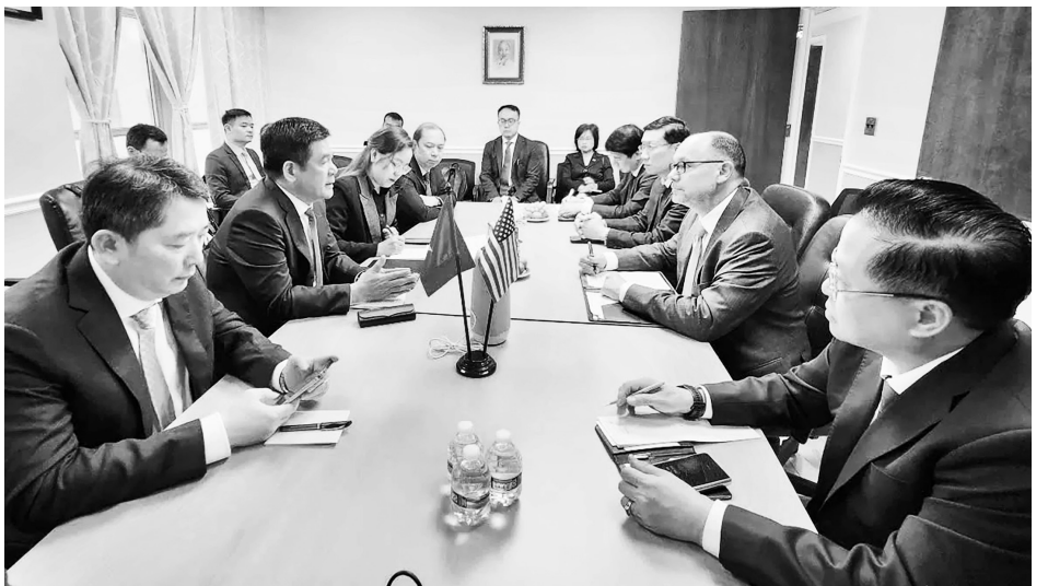
Bộ trưởng Nguyễn Hồng Diên làm việc với Tập đoàn Exceletrate Energy về hợp tác khí LNG