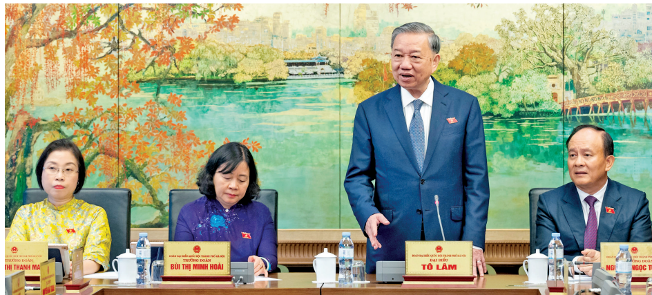
Tổng Bí thư Tô Lâm phát biểu trong phiên thảo luận tại tổ về sửa đổi, bổ sung một số điều của Hiến pháp 2013