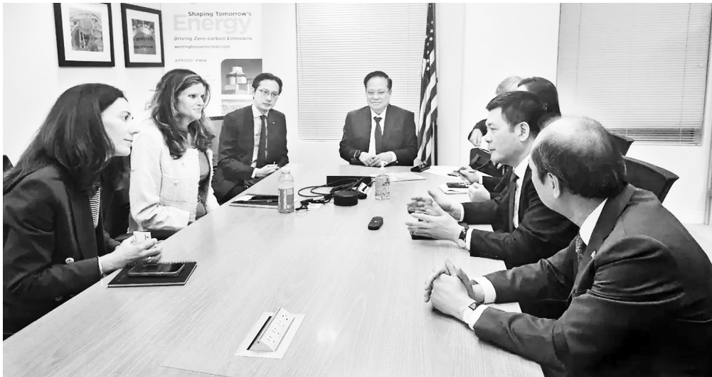
Bộ trưởng Nguyễn Hồng Diên làm việc với Tập đoàn Westinghouse - một trong những tập đoàn hàng đầu thế giới về công nghệ điện hạt nhân