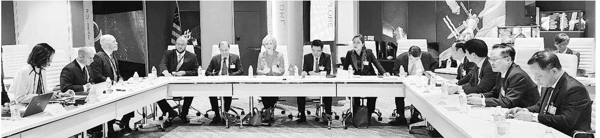
Toàn cảnh buổi làm việc giữa Bộ trưởng Nguyễn Hồng Diên - Trưởng Đoàn đàm phán Chính phủ với lãnh đạo Tập đoàn Lockheed Martin