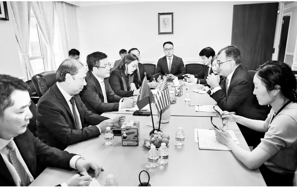
Bộ trưởng Nguyễn Hồng Diên làm việc với lãnh đạo Tập đoàn công nghệ hàng đầu - Google