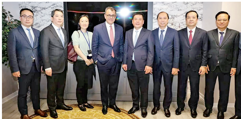
Bộ trưởng Nguyễn Hồng Diên cùng đoàn công tác làm việc với lãnh đạo Tập đoàn Google