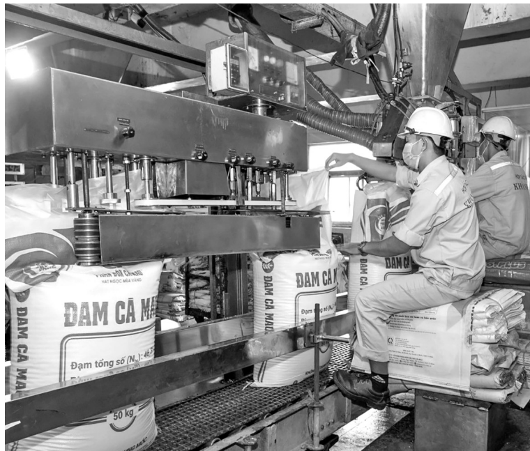
Việc tăng cường ứng dụng khoa học, công nghệ vào quá trình sản xuất đã giúp ngành phân bón nâng cao năng suất, chất lượng sản phẩm, hướng tới phát triển bền vững

Trước tiên, phải kể đến Công ty Cổ phần Supe phốt phát và