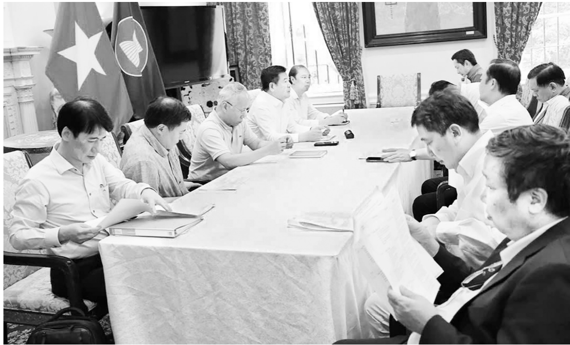
Bộ trưởng Nguyễn Hồng Diên - Trưởng Đoàn đàm phán Chính phủ chủ trì họp với đại diện các thành viên đoàn đàm phán và các bộ phận liên quan

Cùng với các phiên đàm phán trực tiếp về Hiệp định song phương Thương mại đối ứng giữa hai nước Việt Nam - Hoa Kỳ, Bộ trưởng Bộ Công Thương Nguyễn Hồng Diên - Trưởng đoàn công tác đàm phán đã có cuộc gặp và làm việc với lãnh đạo các tập đoàn: Excelebrate Energy, Lockheed Martin, SpaceX, Google và Westinghouse... để trao đổi, thảo luận các giải pháp về việc tăng cường hợp tác chiến lược với Việt Nam trong các lĩnh vực năng lượng, hàng không vũ trụ, công nghệ, điện hạt nhân và trí tuệ nhân tạo (AI). Bộ trưởng nhấn mạnh, thúc đẩy hợp tác trong các lĩnh vực này là động lực quan trọng góp phần cân bằng cán cân thương mại song phương.