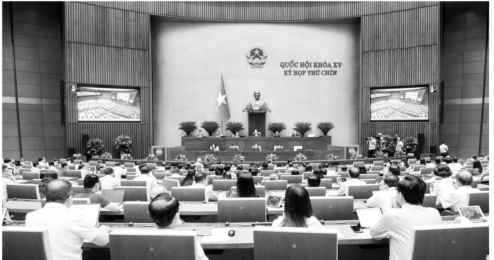
Quốc hội tiến hành thảo luận ở hội trường về dự thảo Nghị quyết của Quốc hội sửa đổi, bổ sung một số điều của Hiến pháp năm 2013 (ngày 14/5/2025)

Nhiều ý kiến cho rằng, việc sửa đổi, bổ sung một số điều của Hiến pháp năm 2013 trong thời điểm hiện nay là hết sức cần thiết, tạo cơ sở cho việc thực