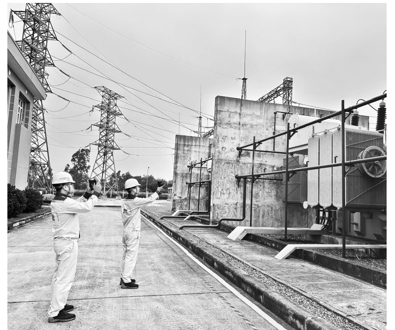
Nhiều doanh nghiệp tại Khu công nghiệp Thăng Long Vĩnh Phúc đầu tư lắp đặt hệ thống điện mặt trời áp mái

Bên cạnh đó, ngành thường xuyên phối hợp với các đơn vị chức năng kiểm tra, giám sát việc