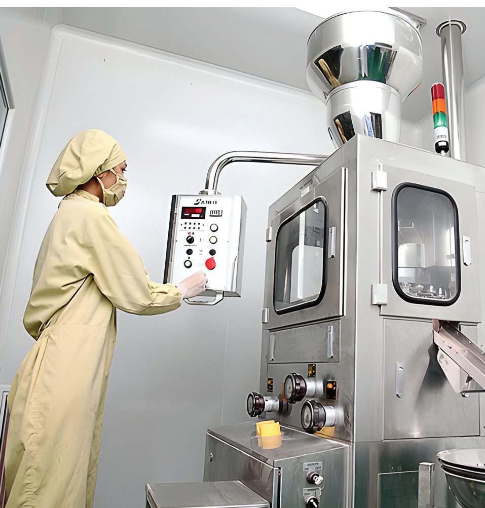
Ứng dụng công nghệ tiên tiến trong sản xuất là một trong những yếu tố then chốt giúp Vinalink Group không ngừng đổi mới và nâng cao chất lượng sản phẩm, đáp ứng nhu cầu ngày càng cao của thị trường

hưởng ứng chương trình “Kiên cố hóa trường, lớp học và nhà công vụ” do Bộ Giáo dục và Đào tạo phát động. Đó chính là cách Vinalink Group “cho đi” và “nhận lại” những giá trị nhân văn cao cả, làm giàu thêm cho chính sự phát triển của doanh nghiệp.