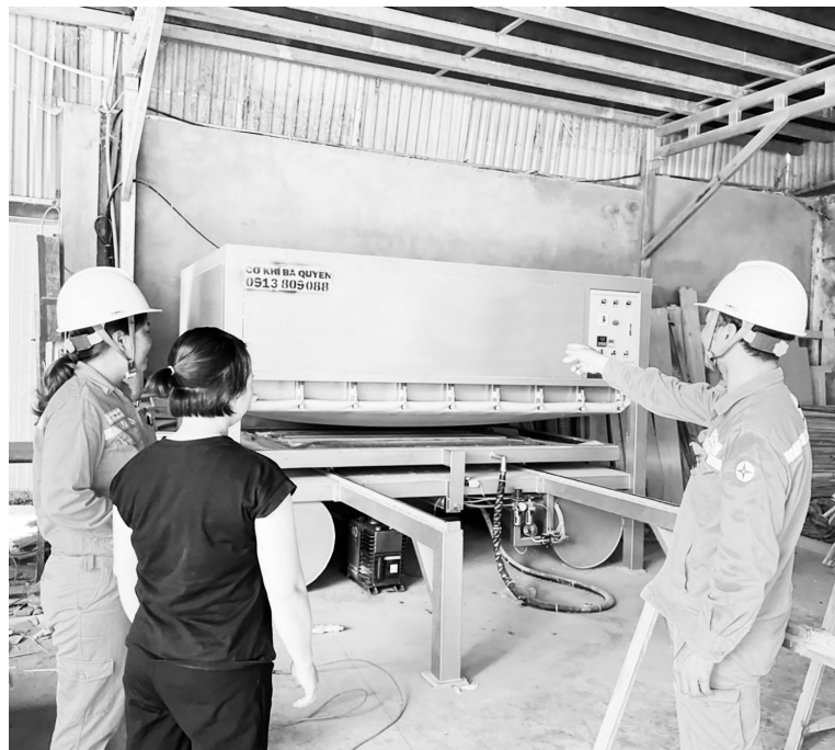
Doanh nghiệp Vinh Phúc triển khai thực hiện nhiều giải pháp hướng đến sản xuất xanh Ảnh: Thạch Thảo

Đặc biệt, việc vận chuyển nguyên vật liệu phục vụ sản xuất đã được thay đổi bằng che chắn không để rơi vãi nguyên liệu; công tác quy hoạch, quản lý, khai thác và sử dụng tài nguyên thiên nhiên, tài nguyên rừng và đa dạng sinh học đạt nhiều kết quả tích cực; công tác dự báo, cảnh báo tác động thiên tai, biến đổi