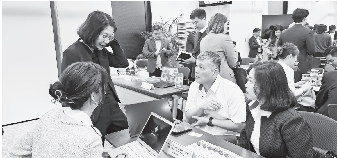
Doanh nghiệp Việt Nam - Nhật Bản kết nối, tìm hiểu cơ hội hợp tác trong nhiều lĩnh vực