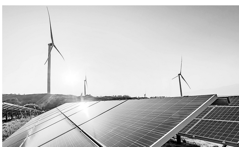
Phát triển năng lượng tái tạo là xu thế tất yếu

Thứ hai , không thể chuyển đổi năng lượng nếu thiếu một hệ thống lưới điện thông minh và linh hoạt. Theo Quyết định 768/