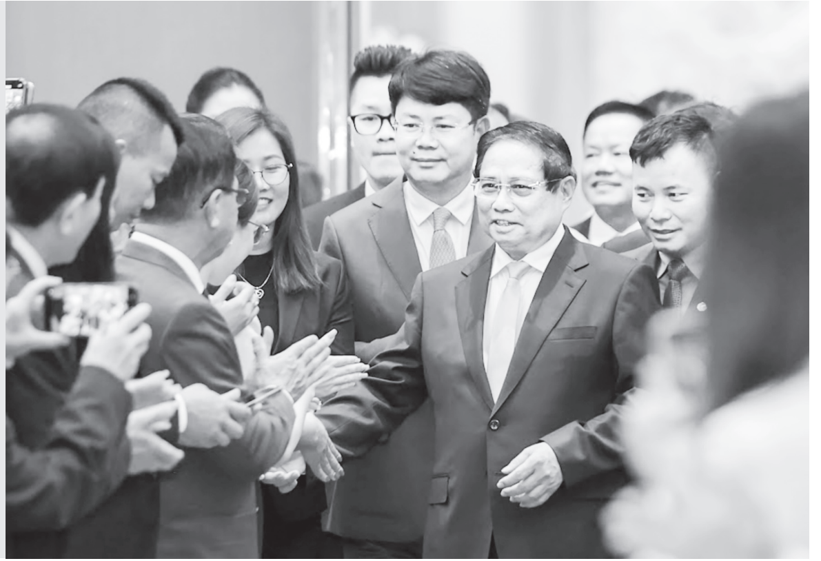
Thủ tướng Chính phủ Phạm Minh Chính đến dự và chủ trì tọa đàm