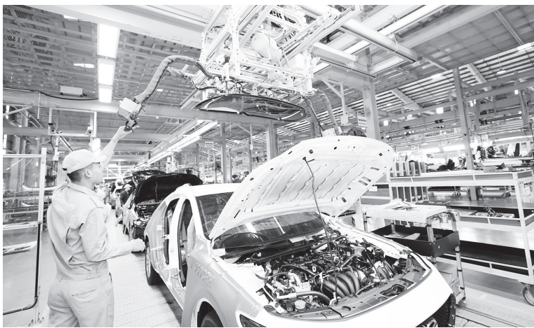
Hoàn thiện thể chế, cơ chế, chính sách để phát triển kinh tế tư nhân

Thứ sáu , với các đề xuất, nhất là những sáng kiến, những vấn đề cần có quản lý nhà nước,