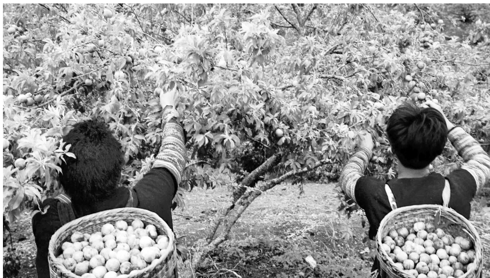
Mận Sơn La đang bước vào mùa thu hoạch rộ