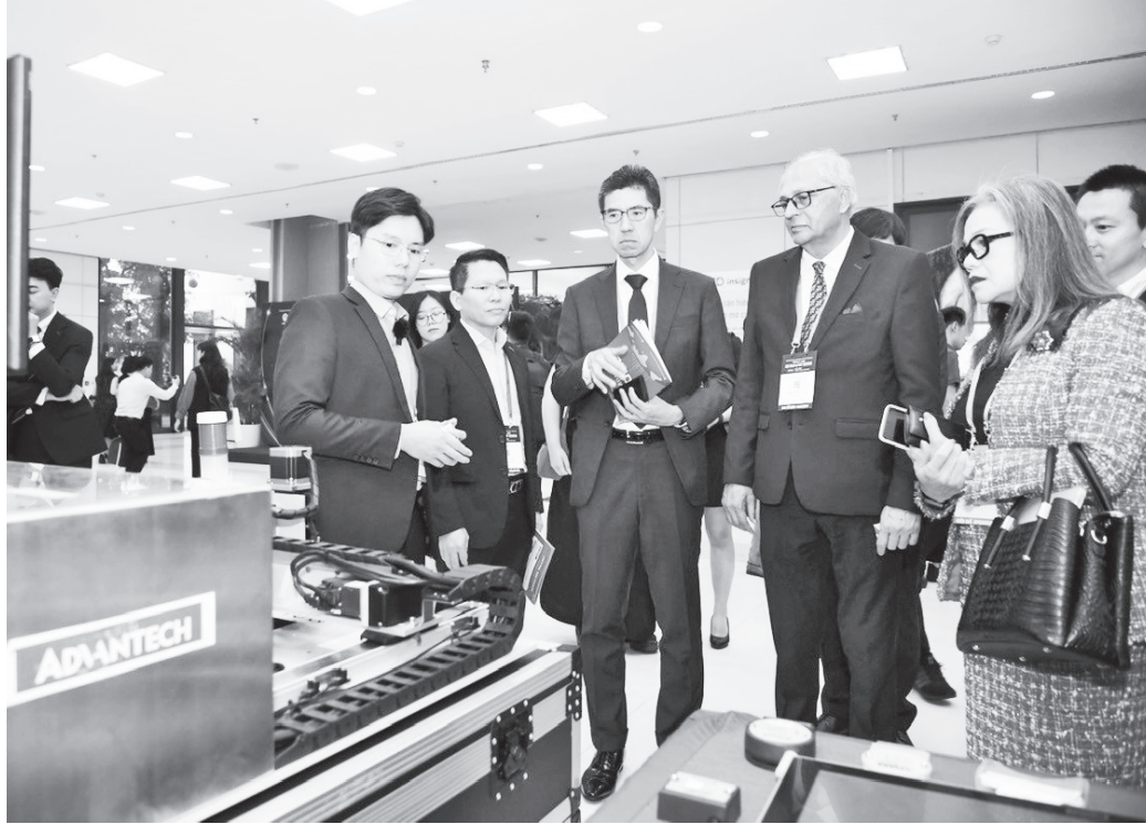
Gian hàng của doanh nghiệp khuôn khổ Diễn đàn cấp cao chuyển đổi số Việt Nam - châu Á 2025