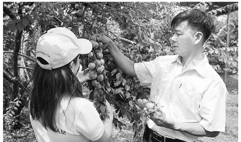
Bưu điện Việt Nam hỗ trợ tiêu thụ mận cho bà con Sơn La