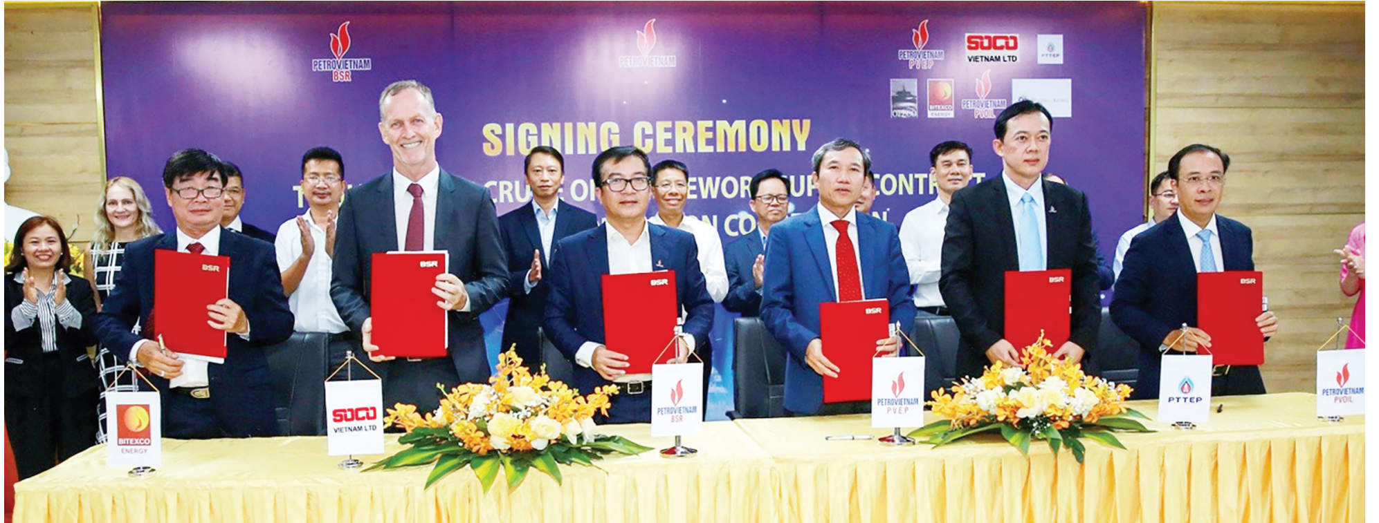
Dưới sự chỉ đạo sát sao của Đảng ủy, BSR đã chủ động đàm phán tăng nguồn cung dầu thô

Tại Công ty Lọc hóa dầu Bình Sơn (BSR), việc học và làm theo Bác được cụ thể hóa bằng những hành động thiết thực, đặc biệt là trong thực hành tiết kiệm, chống lãng phí.