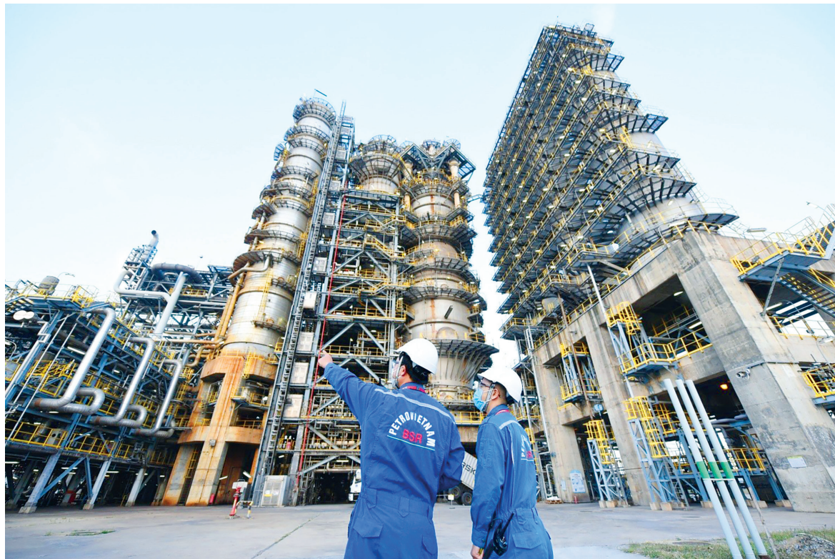
Người lao động BSR đã thực sự làm chủ khoa học công nghệ lọc hóa dầu