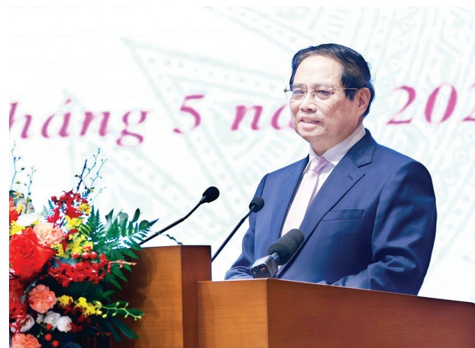
Thủ tướng Chính phủ Phạm Minh Chính phát biểu kết luận tọa đàm