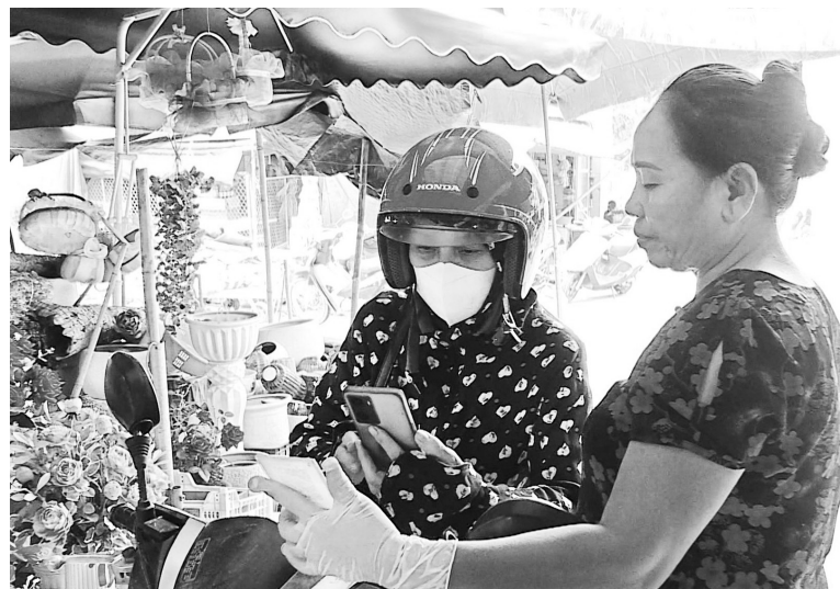
Người dân dùng điện thoại để quét mã QR chuyển khoản khi mua hàng

quá trình giao dịch an toàn hơn. Qua đó, giúp người dân tiết kiệm thời gian, chi phí đi lại.