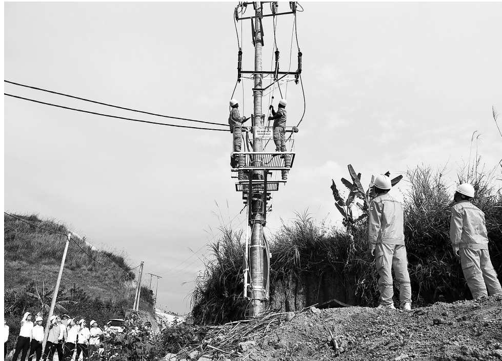
Lễ đóng điện Công trình xây dựng đường dây 35kV khu vực xã Nậm Sỏ, huyện Tân Uyên, tỉnh Lai Châu, cấp điện cho bản Khâu Hòm

Trong năm 2025, PC Gia Lai dự kiến đầu tư hơn 70 tỷ đồng để xây dựng gần 42 km đường dây trung thế, 55,5 km đường dây hạ thế và 69 trạm biến áp với tổng công suất