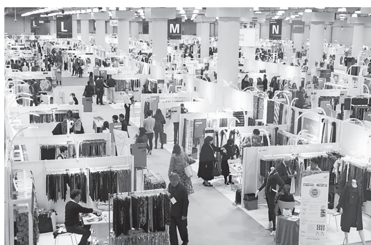
Doanh nghiệp ngành dệt may muốn khẳng định chỗ đứng trên thị trường cần xây dựng thương hiệu riêng

Dù quý I/2025, nhóm hàng HS 61 (quần áo dệt kim) xuất sang Canada của Việt Nam vẫn tăng 1,5%, HS 62 (quần áo dệt thoi)