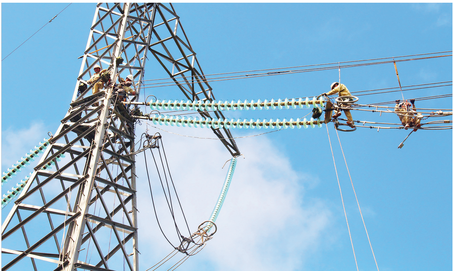
Bảo đảm cung cấp đủ điện cho nhu cầu phát triển kinh tế - xã hội và đời sống sinh hoạt của nhân dân